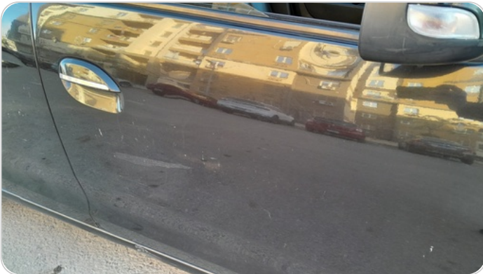
الباب الأمامي يمين : فبريكة (خرايش)