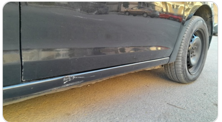
العتب السفلي يمين : فبريكة (خرايش)