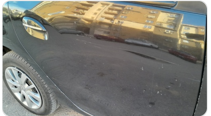
الباب الخلفي يمين : فبريكة (خرايش)