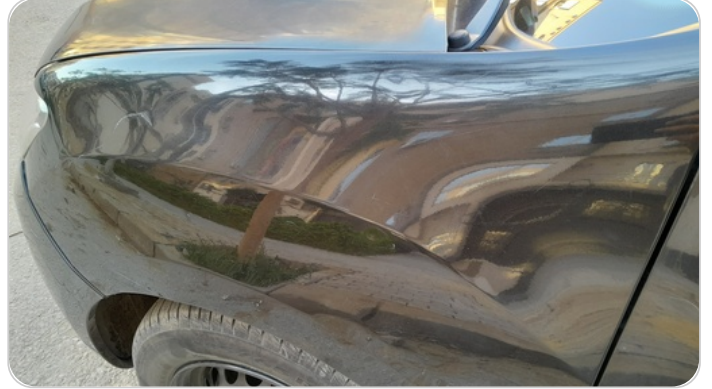
الرفرف الأمامي شمال : فبريكة ( خرابيش )