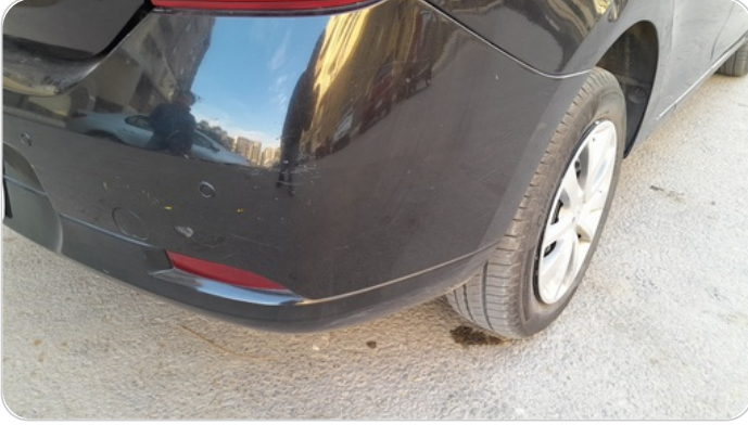
الاكصدام الخلفي : فبريكة (خرايش)