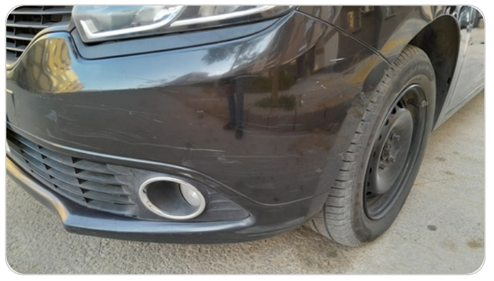
الاكصدام الأمامي : فبريكة (خرايش)