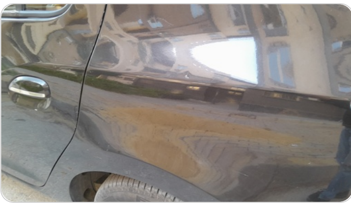
الرفرف الخلفي شمال : فبريكة (خرايش)