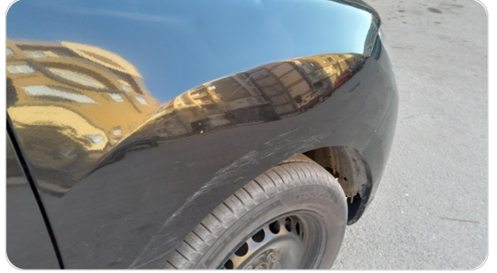
الرفرف الأمامي يمين : فبريكة (خرايش)