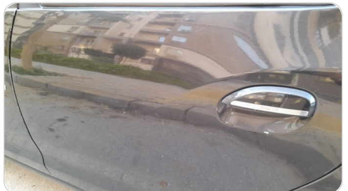
الباب الخلفي شمال : فبريكة ( خرابيش )