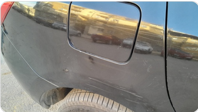
الرفرف الخلفي يمين : فبريكة (خرايش)