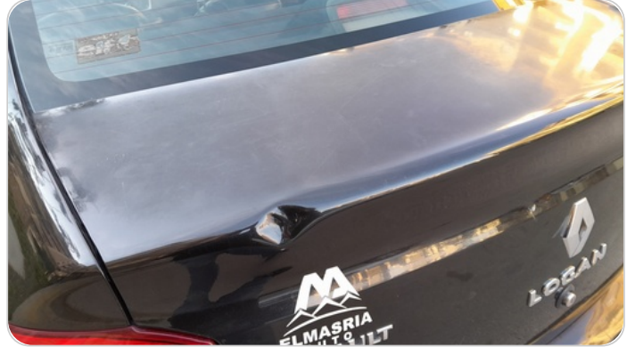
باب الشنطة : فبريكة ( الدهان متاكل )