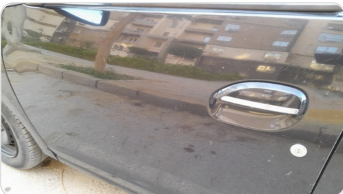
الباب الأمامي شمال : فبريكة ( خرابيش )