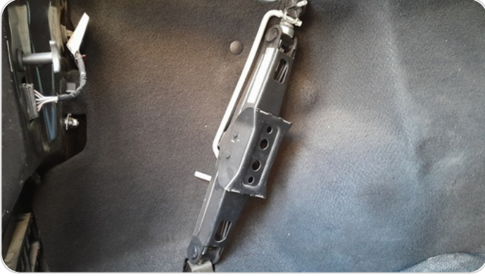
فرش كرسي أمامي شمال : قطع / كسر / شرخ / تلف