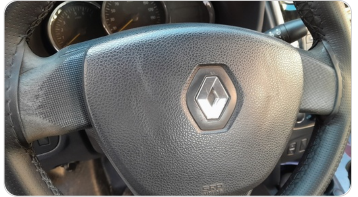
الطارة : متآكلة