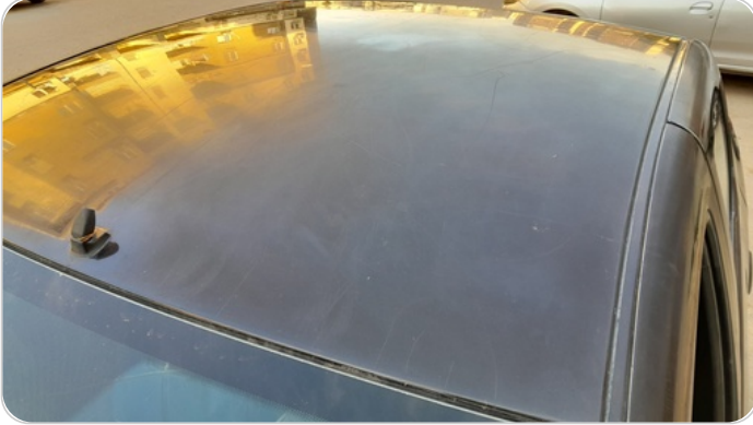
السقف : فبريكة ( الدهان متاكل )