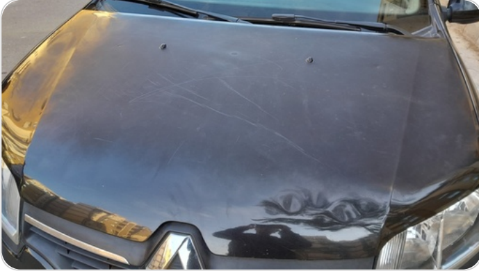
الكبوت : فبريكة ( الدهان متاكل )