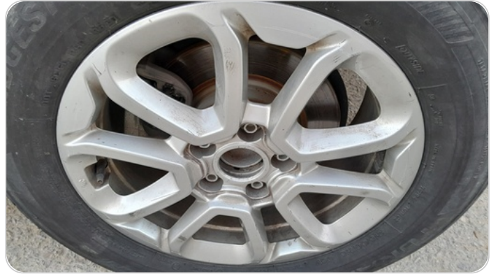
حالة الجنوط الخلفي : تجريحات بسيطه