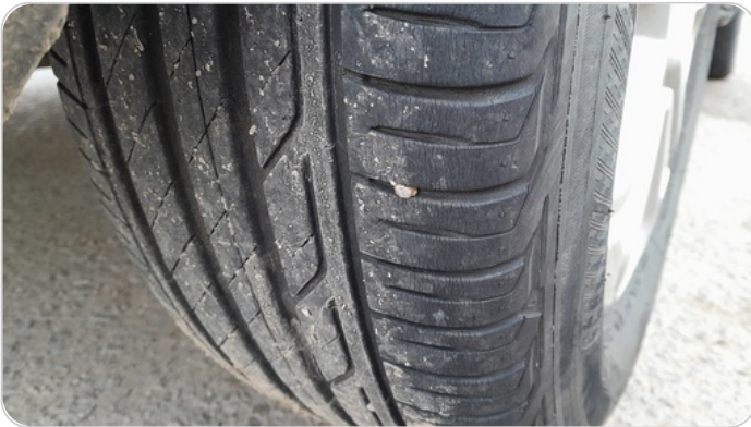
حالة الكاوتش الخلفي : النقشة متآكلة