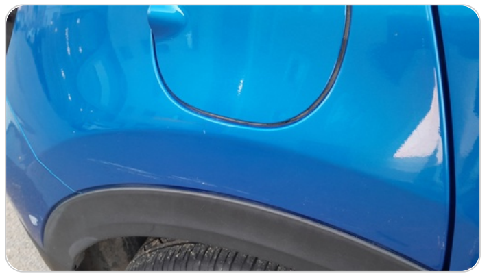
الرفرف الخلفي يمين : رش بدون معجون (خرايش)