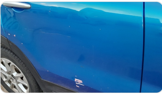
الباب الخلفي يمين : رش مع معجون (خرايش)