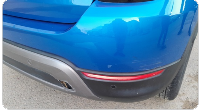
الاكصدام الخلفي : رش بدون معجون (خرابيش)