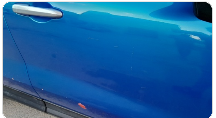
الباب الأمامي يمين : رش مع معجون (خرابيش)