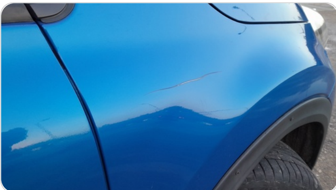
الرفرف الأمامي يمين : رش بدون معجون (خرابيش)