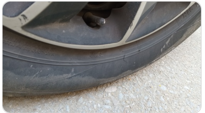
حالة الكاوتش الأمامي : تشققات/قطع بسيط