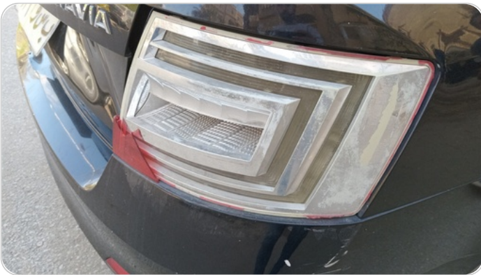
الكشاف الخلفي يمين : كسر بالباغة