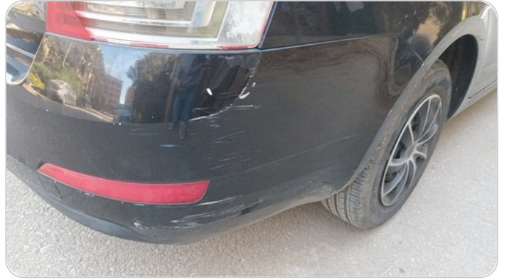
الاكصدام الخلفي : فبريكة (كسر)