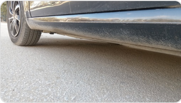
العتب السفلي شمال : فبريكة (خبطات)