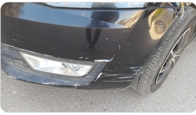
الاكصدام الأمامي : فبريكة (خرابيش - خبطات)