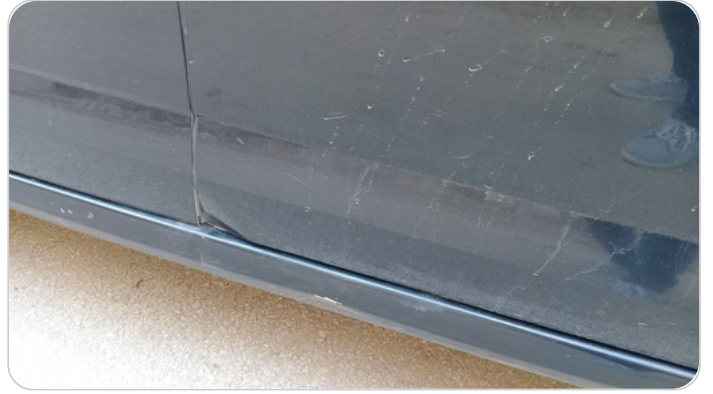
الباب الأمامي يمين : فبريكة (خبطات)