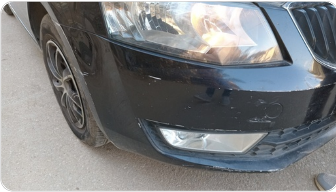
الاكصدام الامامي : فبريكة (خرابيش - خبطات)