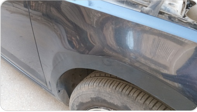
الرفرف الأمامي يمين : فبريكة (خرابيش - خبطات)