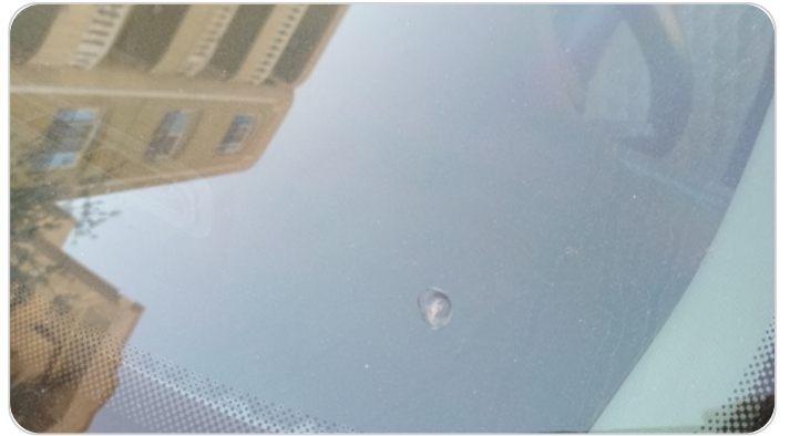
زجاج السيارة الأمامي : نقرة