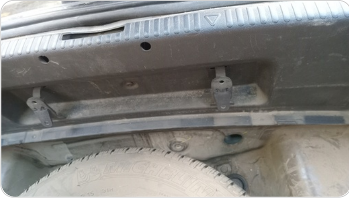
ستارة شنطة خلفية : صدمة بسيطة