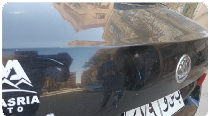
باب الشنطة : فبريكة ( خرابيش _خبطات )