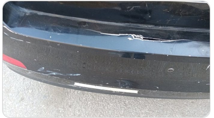
الاكصدام الخلفي : فبريكة (كسر)