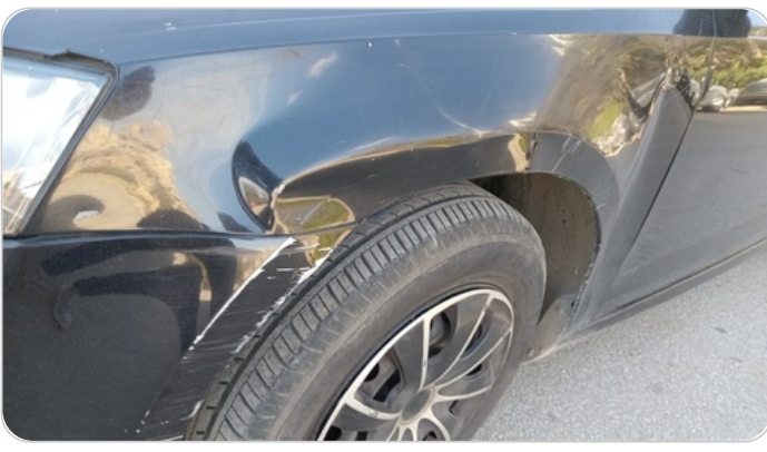
الرفرف الأمامي شمال : فبريكة (صدمة كبيرة)