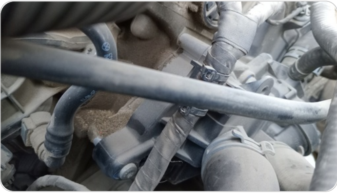
المحرك : اثار تسريبات زيت قديمة