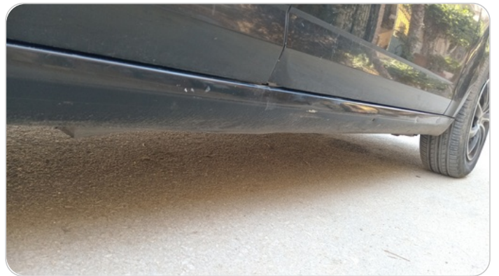
العتب السفلي يمين : فبريكة (خرابيش - خبطات)