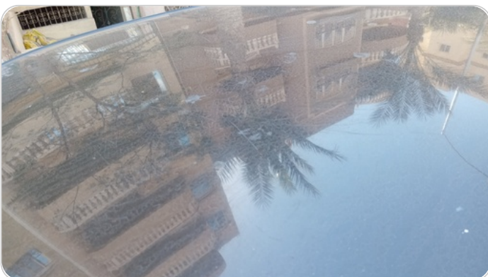
السقف : فبريكة (خرابيش)