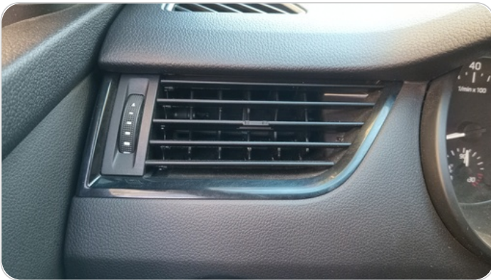
هوايات التكييف : كسر (هواية واحدة)