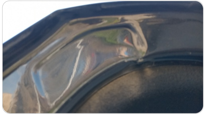
باب الشنطة : صدمة