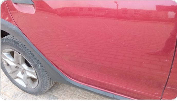
الباب الخلفي يمين : فبريكة (خرابيش - خبطات)