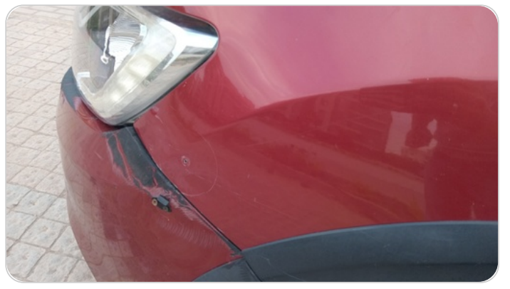
الرفرف الأمامي شمال : فبريكة ( خرابيش - خبطات )