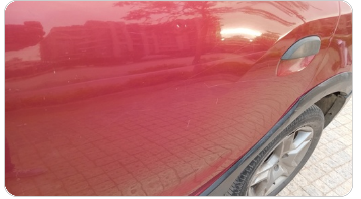
الباب الخلفي شمال : فبريكة ( خرابيش )