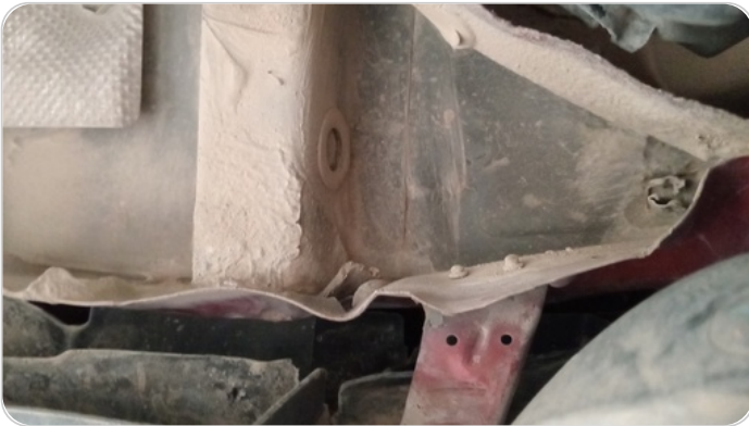
ستارة شنطة خلفية : صدمة بسيطة