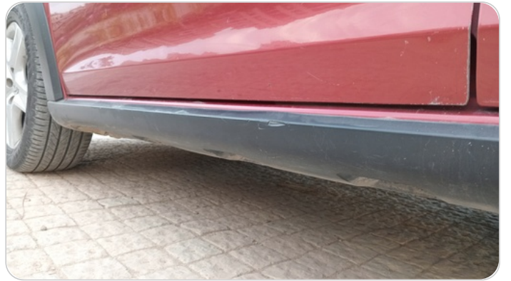
العتب السفلي شمال : فبريكة ( خرابيش )