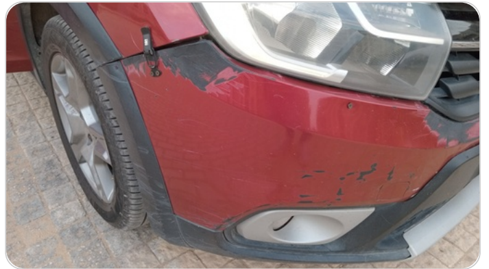
اكصدام امامي : فبريكة (خرابيش - خبطات)