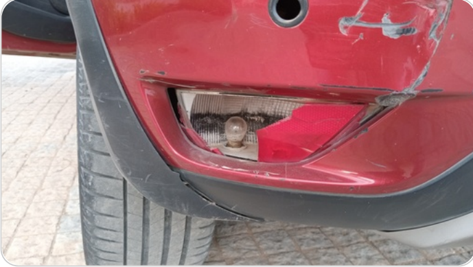
كشافات شبورة خلفي : كسر بالباغة