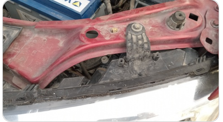
الكشاف الأمامي شمال : كسر في قواعد الكشاف