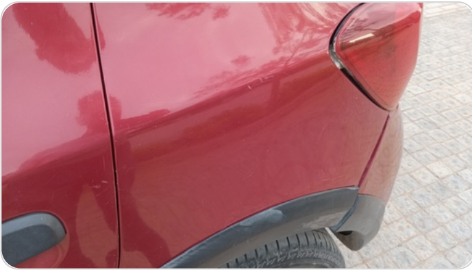
الرفرف الخلفي شمال : فبريكة ( خرابيش )