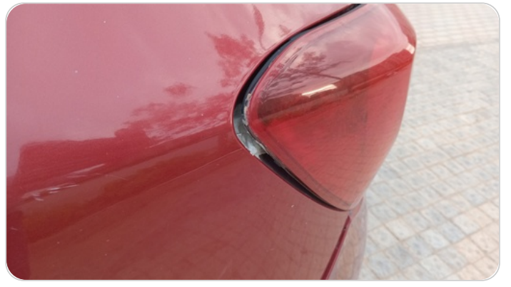
كشاف خلفي شمال : غير مثبت جيدا