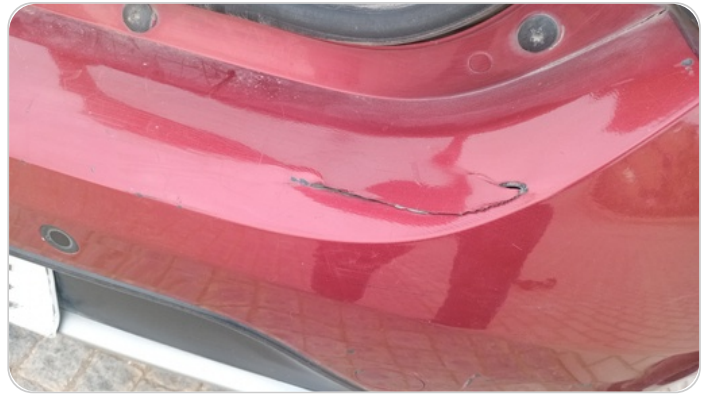
الاكصدام الخلفي : فبريكة (كسر)