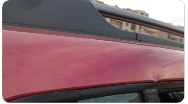
قائم خارجي خلفي يمين : فبريكة ( خرابيش )