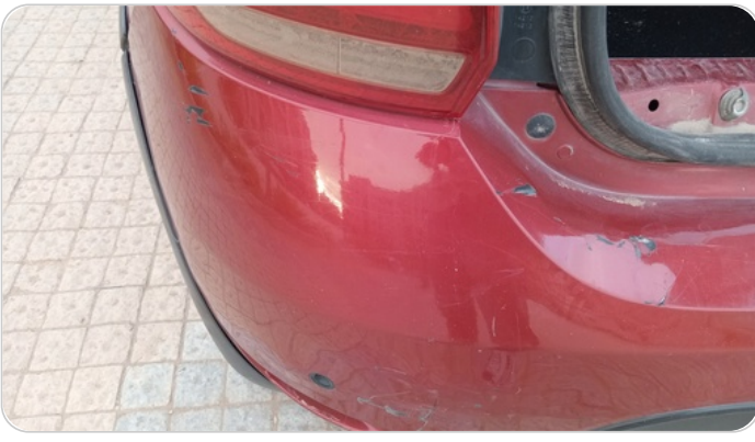
اكصدام خلفي : فبريكة (كسر)