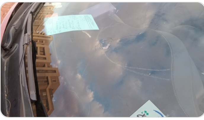
زجاج السيارة الأمامي : شروخ أو كسور