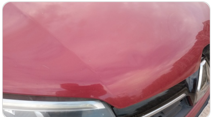
الكبوت : فبريكة (خرايش - خبطات)