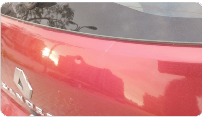
باب الشنطة : فبريكة ( خرابيش - خبطات )