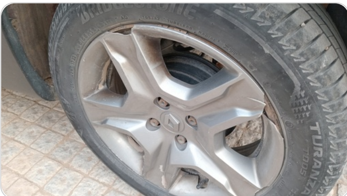
حالة الجنوط الخلفي : تجريحات بسيطة