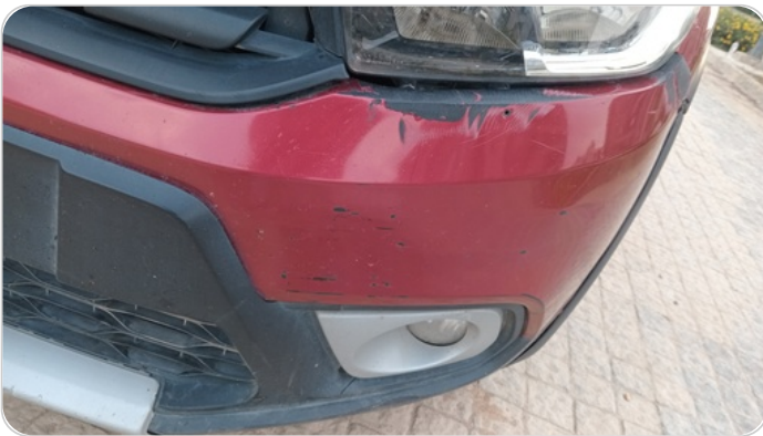
الاكصدام الأمامي : فبريكة ( خرابيش - خبطات )