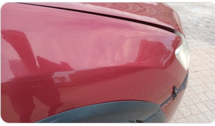
الرفرف الأمامي يمين : فبريكة (خرابيش - خبطات)