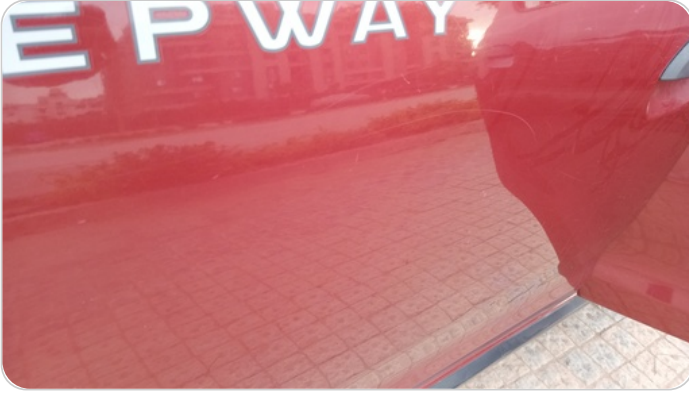
الباب الأمامي شمال : فبريكة ( خرابيش )