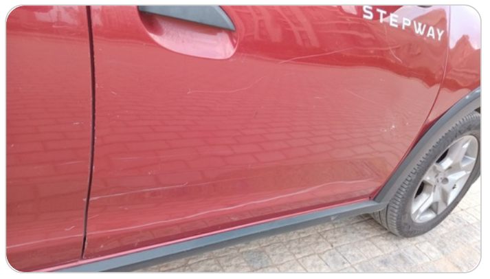
الباب الأمامي يمين : فبريكة (خرابيش - خبطات)