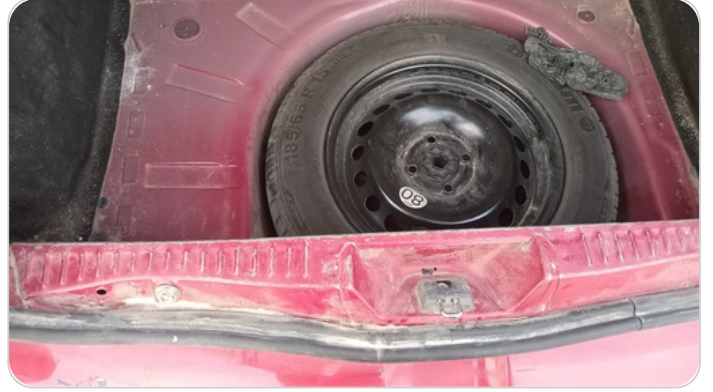
دواخل وأرضية الشنطة : فبريكة (خرابيش)