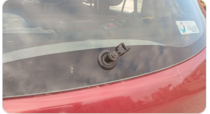
مساحة الزجاج الخلفي : الذراع مكسور