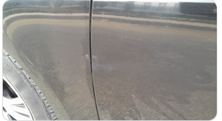
الباب الأمامي شمال : فبريكة (سمكره على البارد)