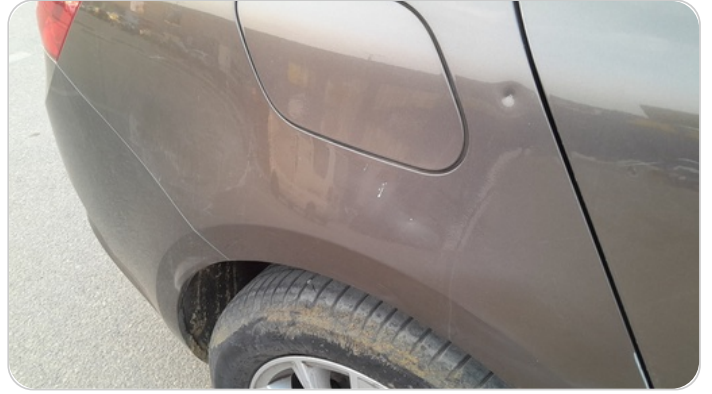
الرفرف الخلفي يمين : فبريكة (خبطات)