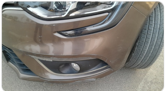
الاكصدام الأمامي : فبريكة (خرابيش)