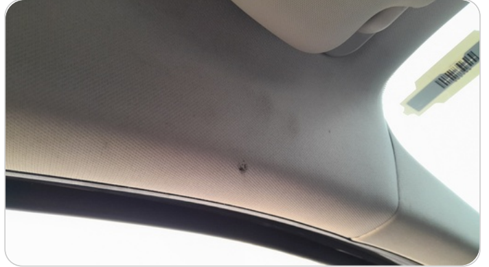
فرش السقف : قطع / كسر / شرخ / تلف