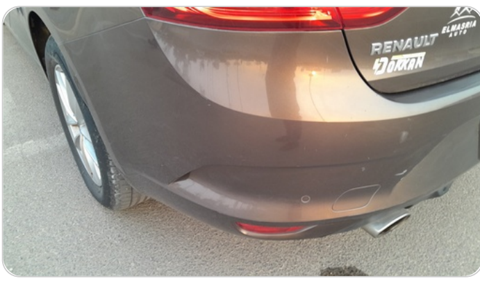
الاكصدام الخلفي : فبريكة (خرابيش)