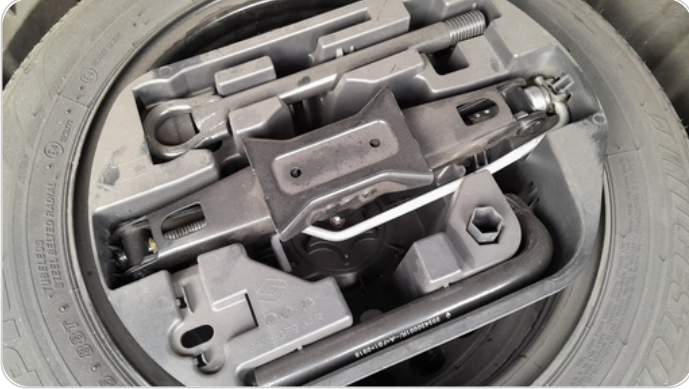
العدة وأدوات الأمان : متوفرة (بحالة جيدة)