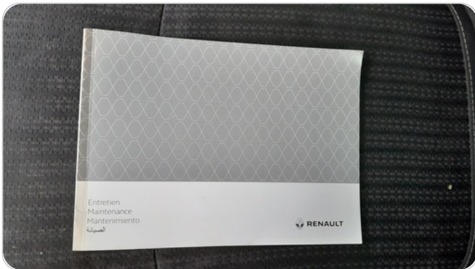
كتيب الضمان : موجود