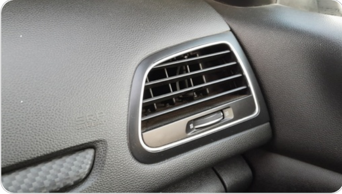
هوايات التكييف : كسر (هواية واحدة)