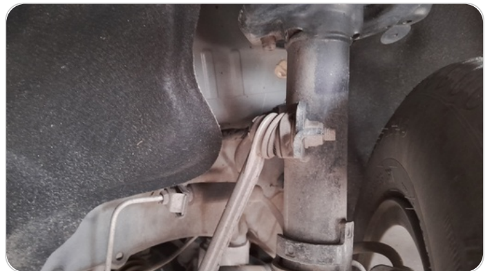
ذراع الميزان : تشققات (كاوتش الميزان)