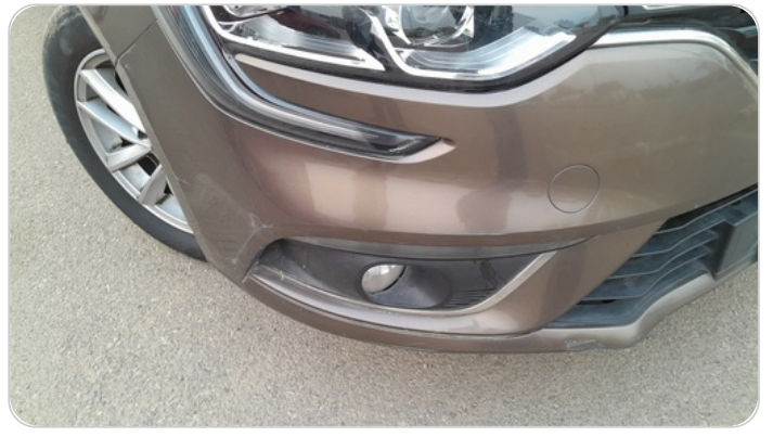
الاكصدام الامامي :