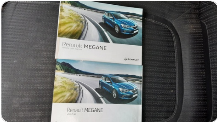
كتالوج السيارة : موجود