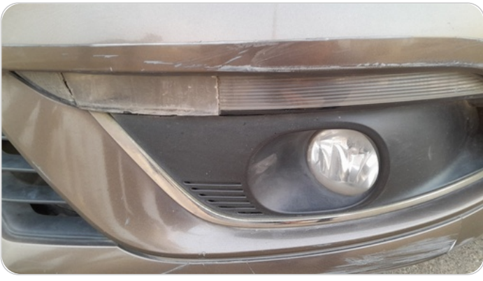
كشافات إشاره أمامي : كسر بالباغة