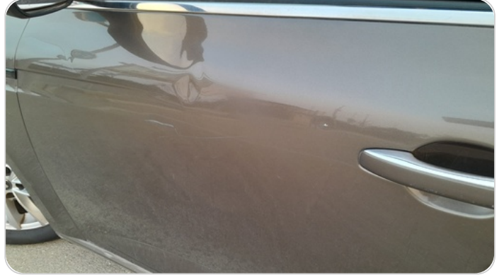
الباب الأمامي شمال : فبريكة (خرابيش)