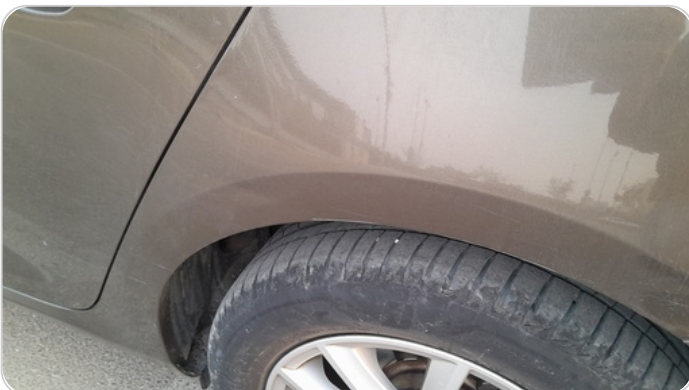
الرفرف الخلفي شمال : فبريكة (خرابيش)