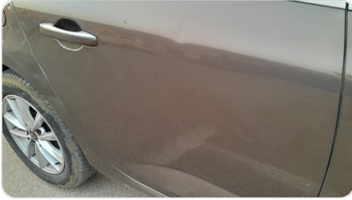
الباب الخلفي يمين : فبريكة (خرابيش)