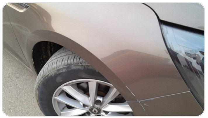
الرفرف الأمامي يمين : فبريكة (خرابيش)