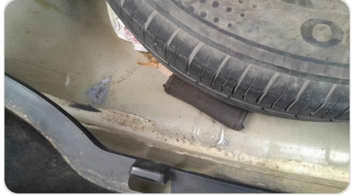
دواخل وأرضية الشنطة : فبريكة (خرايش)