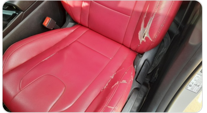
فرش كرسي أمامي شمال : قطع / كسر / شرخ / تلف