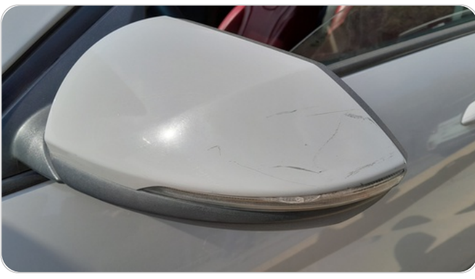
مراية الباب الأمامي شمال : فبريكة (خرابيش)