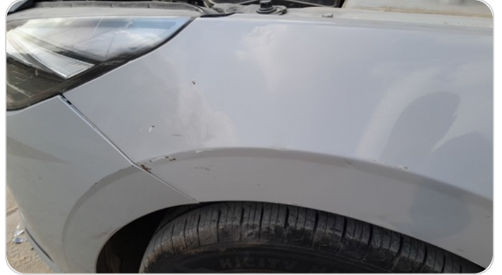
الرفرف الأمامي شمال : فبريكة (سمكره على البارد)