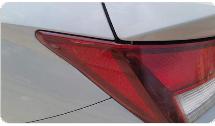
الكشاف الخلفي شمال : كسر بالباغة