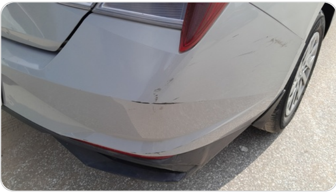
الاكصدام الخلفي :