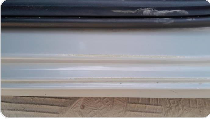
دواخل وقوائم باب الأمامي شمال : فبريكة (خرايش)