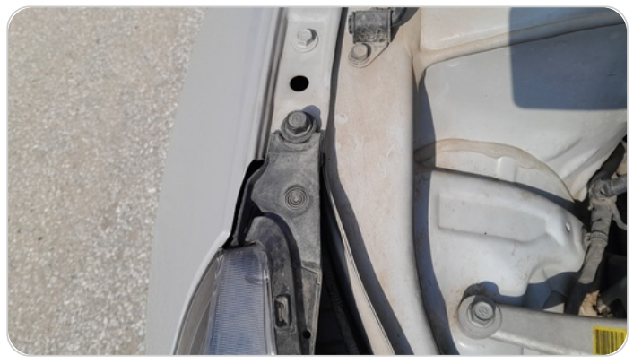
الكشاف الأمامي يمين : كسر في قواعد الكشاف