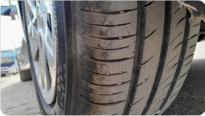
حالة الكاوتش الخلفي : النقشة متآكلة