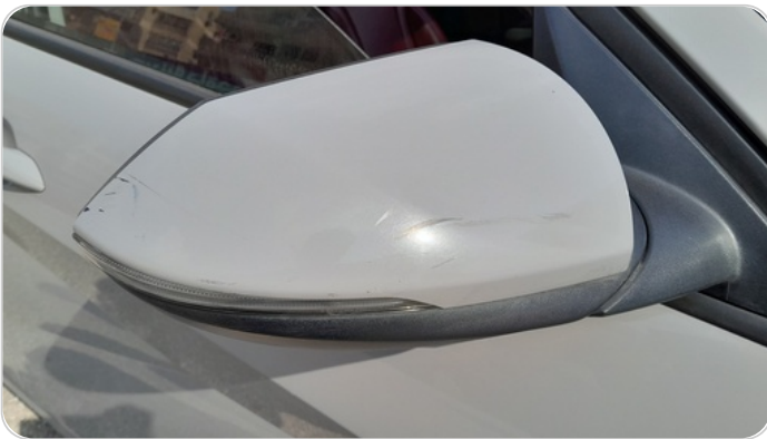
مراية الباب الأمامي يمين : فبريكة (خرابيش)