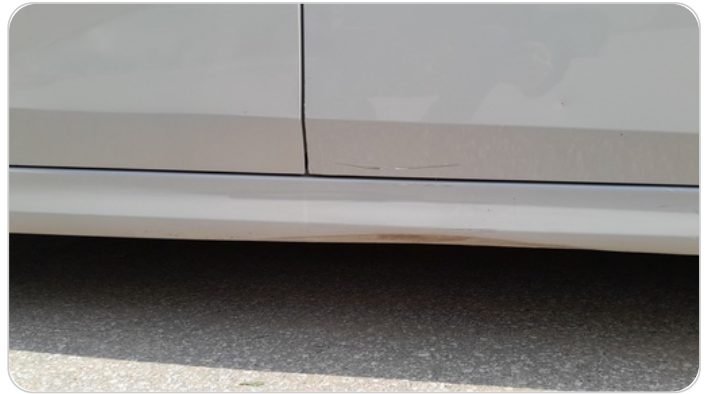
العتب السفلي يمين : رش بدون معجون (خرابيش)