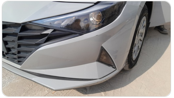
الاكصدام الامامي :