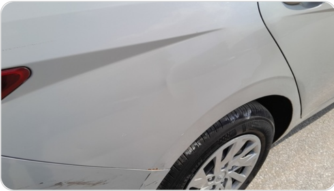
الرفرف الخلفي يمين : رش مع معجون (خرابيش)