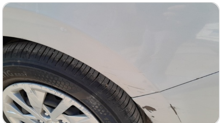
الرفرف الخلفي شمال : فبريكة (سمكره على البارد)