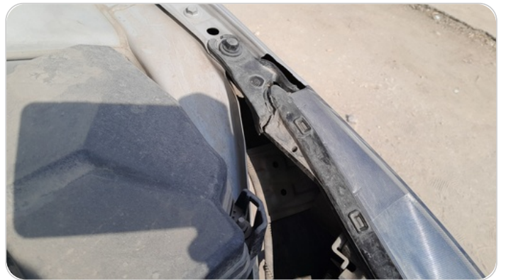
الكشاف الأمامي شمال : كسر في قواعد الكشاف