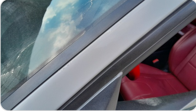
قائم خارجي أمامي شمال : فبريكة (خرابيش)