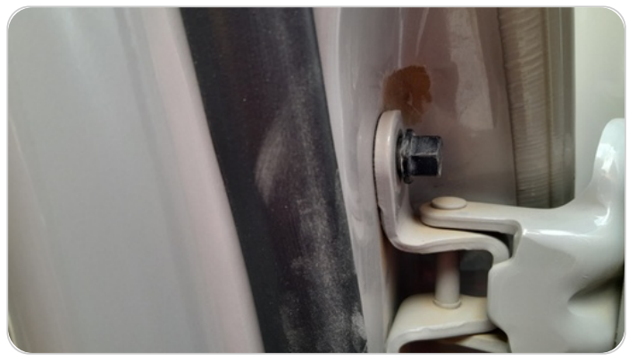
مفصلات ومسامير الباب الخلفي شمال : آثار فك وتركيب