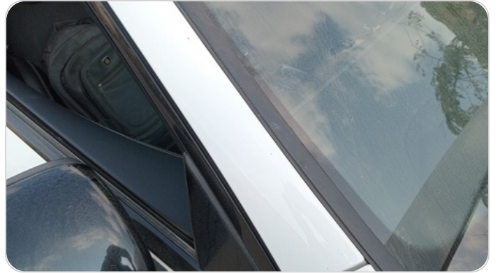
قائم خارجي أمامي يمين : فبريكة (خرابيش)