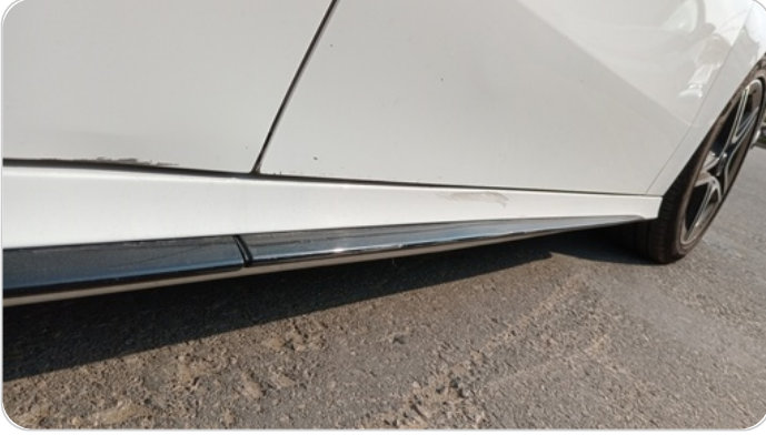
العتب السفلي يمين : فبريكة (خرابيش)