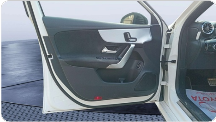
FR L DOOR