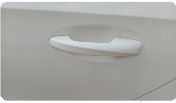
الباب الخلفي شمال : فبريكة (خرابيش)