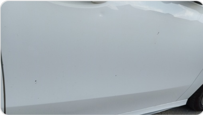
الباب الأمامي يمين : فبريكة (خرابيش)