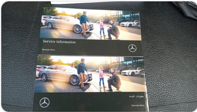
كتيب الضمان : موجود