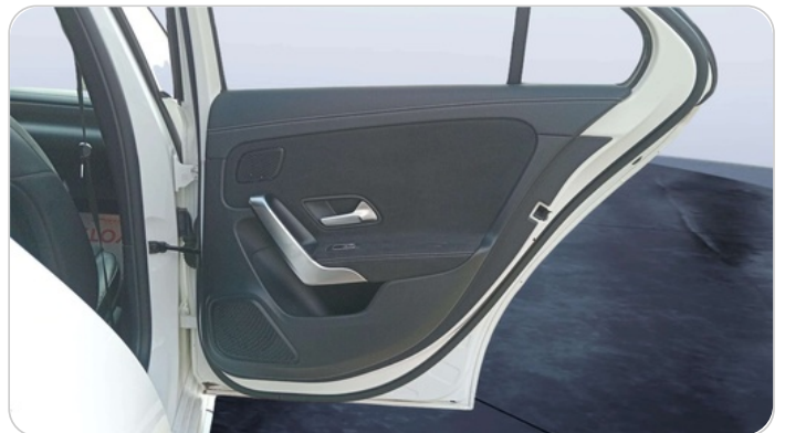
RR R DOOR