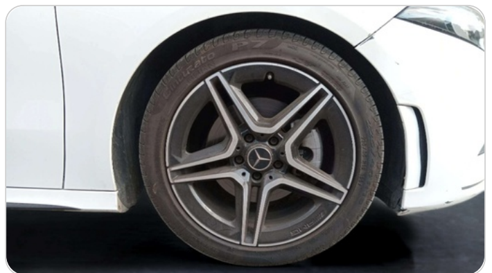
FR R TIRE