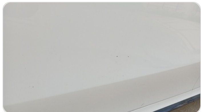
الباب الأمامي شمال : فبريكة (خرابيش)