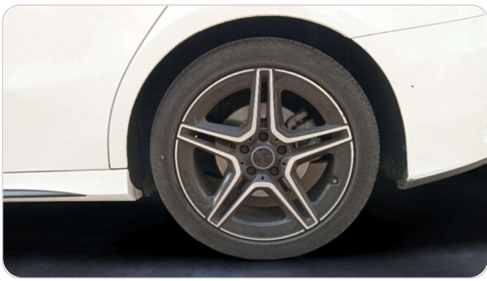
RR L TIRE