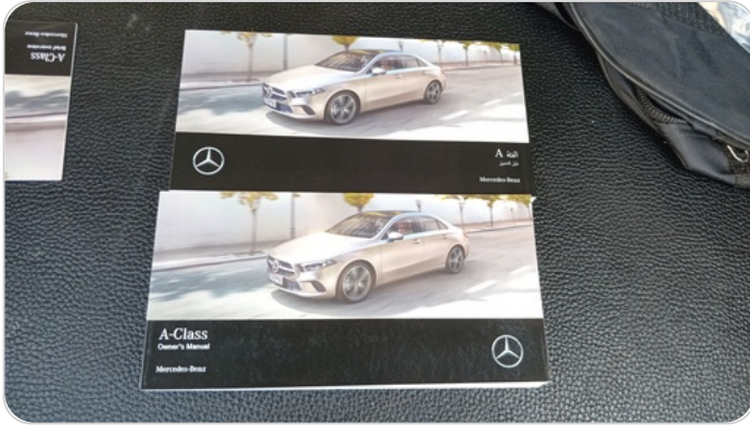
كتالوج السيارة : موجود