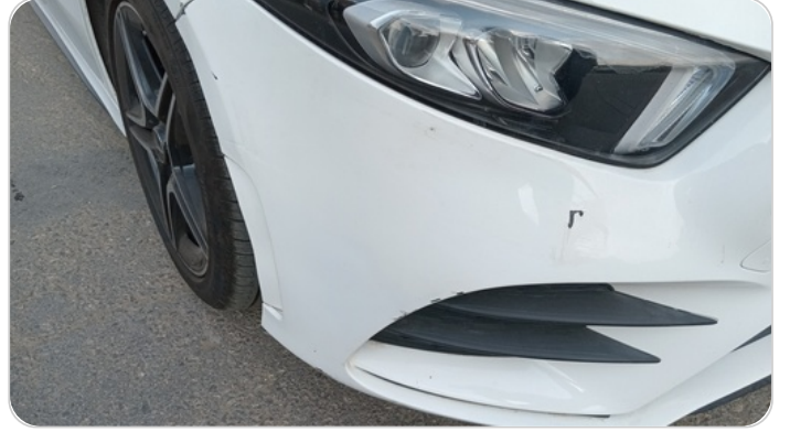
الاكصدام الأمامي : رش بدون معجون (خرابيش)