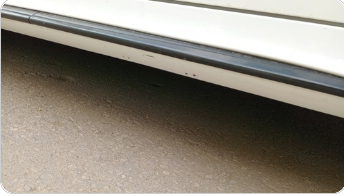
العتب السفلي شمال : فبريكة (خرابيش)