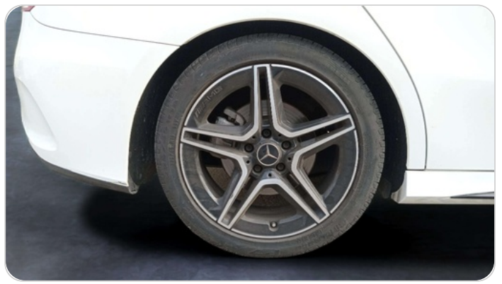
RR R TIRE