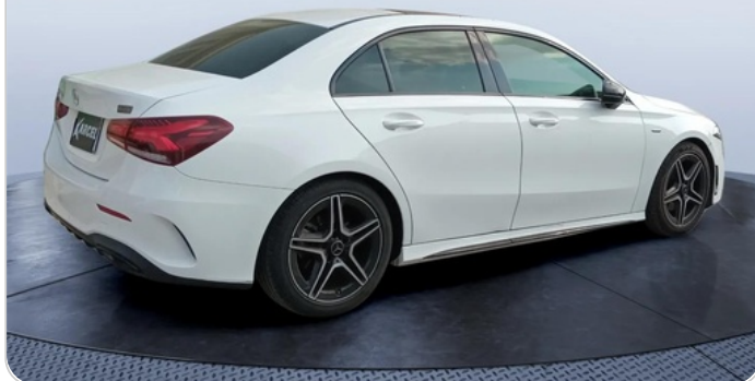
RR R 45