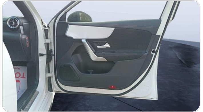
FR R DOOR