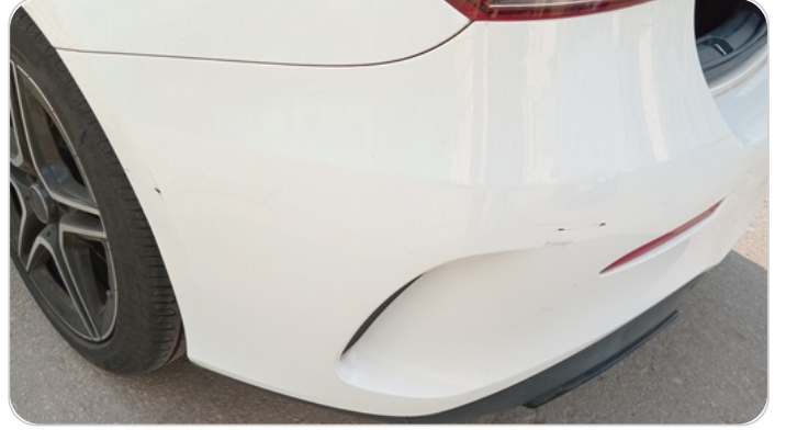
الاكصدام الخلفي : فبريكة (خرابيش)