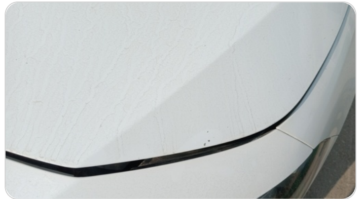
الكبوت : فبريكة (خرابيش)