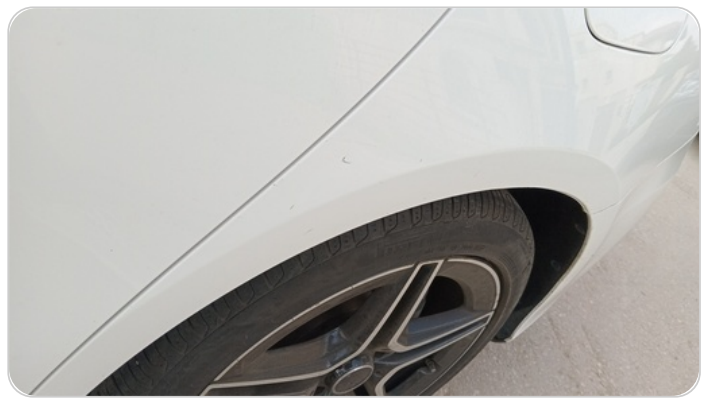
الرفرف الخلفي شمال : فبريكة (خرابيش)