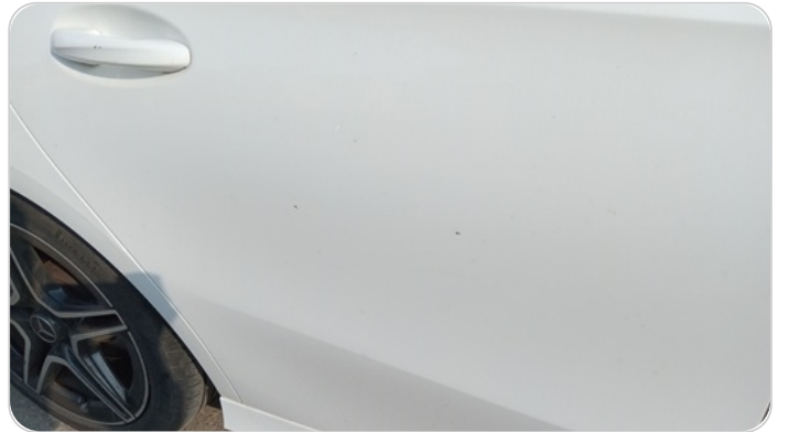
الباب الخلفي يمين : فبريكة (خرابيش)