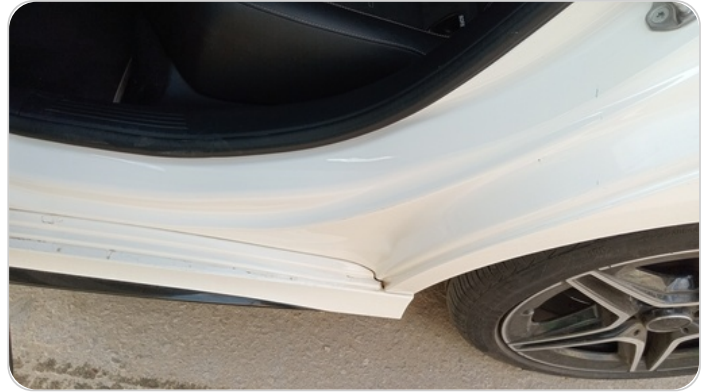
دواخل وقوائم باب الخلفي شمال : فبريكة (خرابيش)