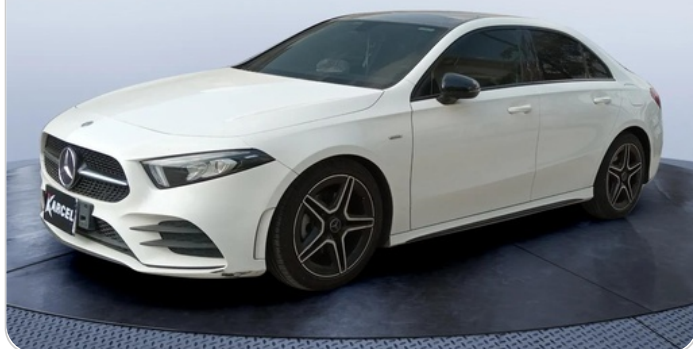
FR L 45