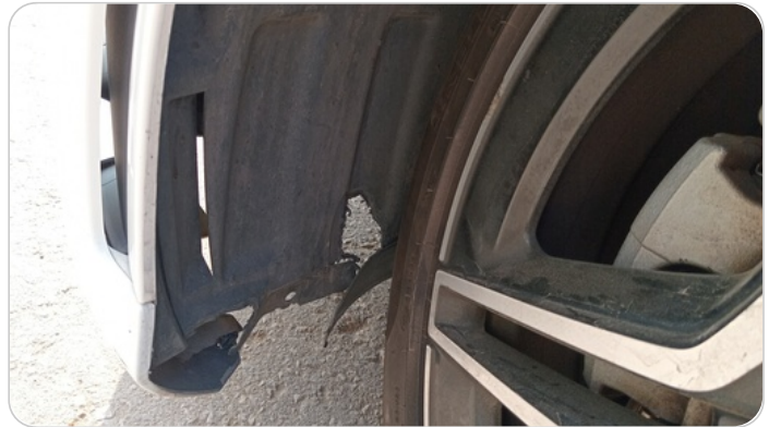
كرتيرة عجل امامي شمال : كسر