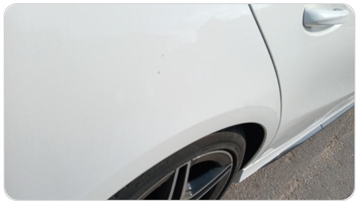
الرفرف الخلفي يمين : فبريكة (خرابيش)