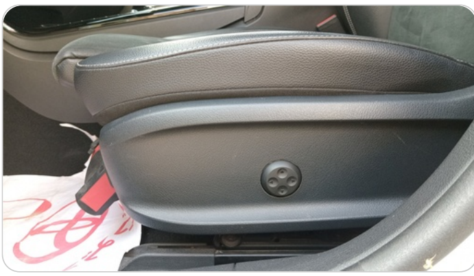
DRIVER SEAT SWITCHES