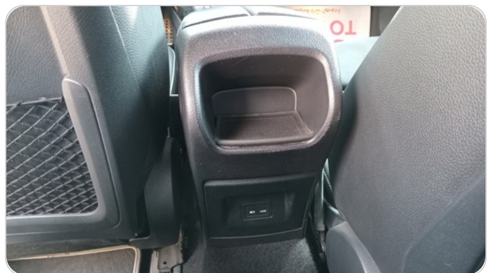
RR AC GRILL