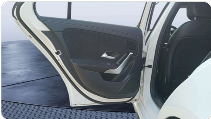
RR L DOOR