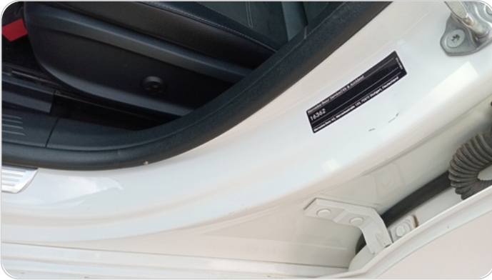
دواخل وقوائم باب الأمامي شمال : فبريكة (خرابيش)