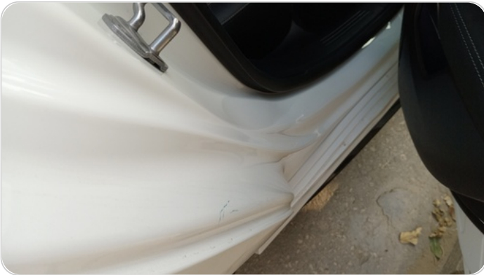
دواخل وقوائم باب خلفي يمين : فبريكة (خرابيش)