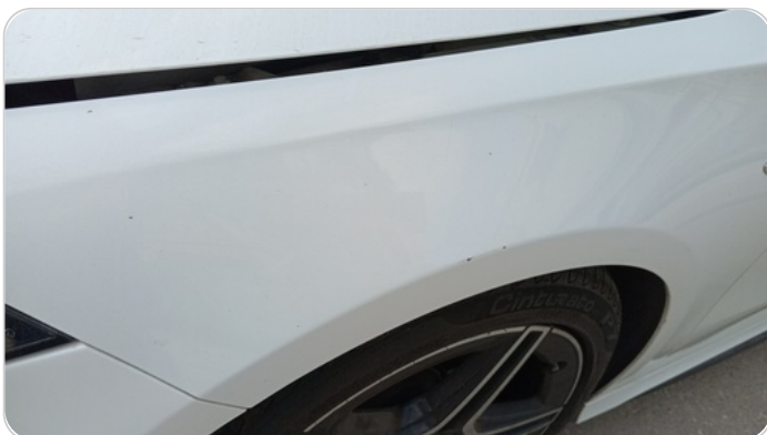
الرفرف الأمامي شمال : فبريكة (خرابيش)