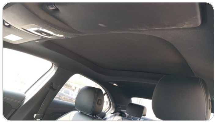
CAR ROOF MAT