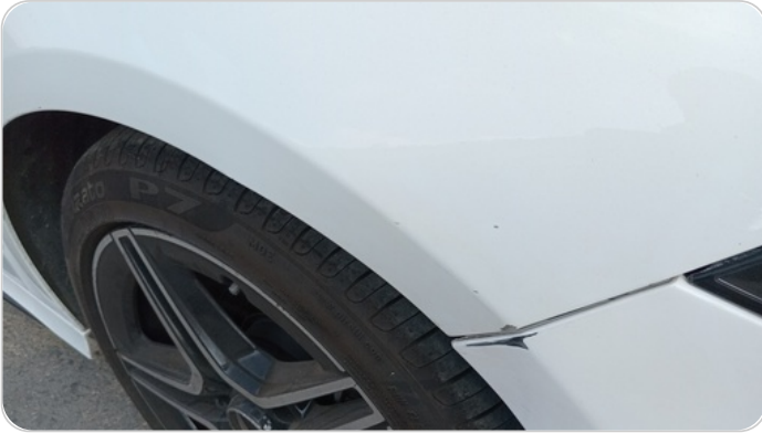
الرفرف الأمامي يمين : فبريكة (خرابيش)