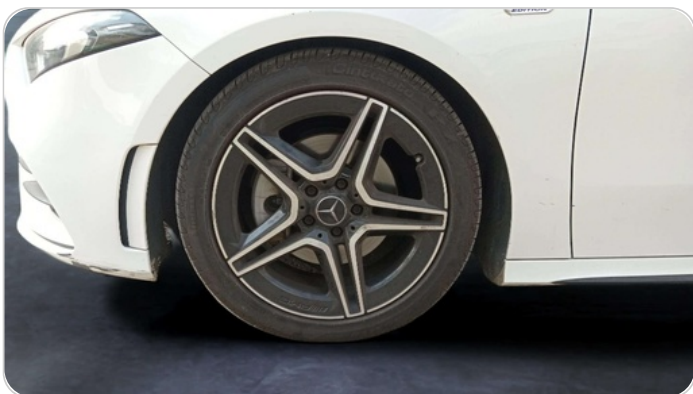
FR L TIRE