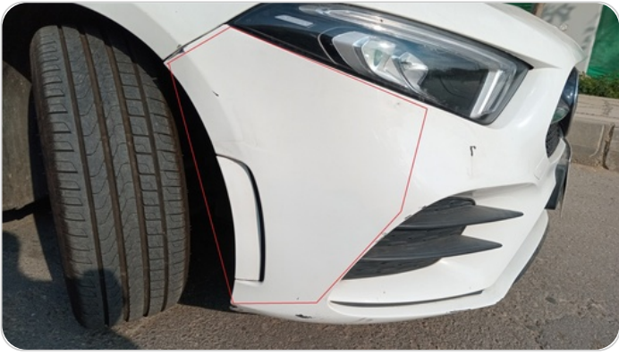
اکصدام امامي : رش جزئي بدون معجون