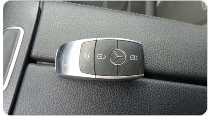
حالة الريموت / المفتاح : يعمل بكفاءة