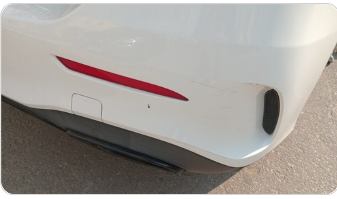
الاكصدام الخلفي : فبريكة (خرابيش)