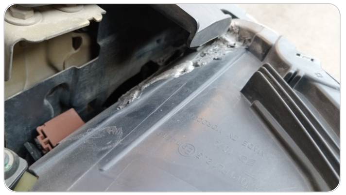
الكشاف الأمامي يمين : كسر في قواعد الكشاف