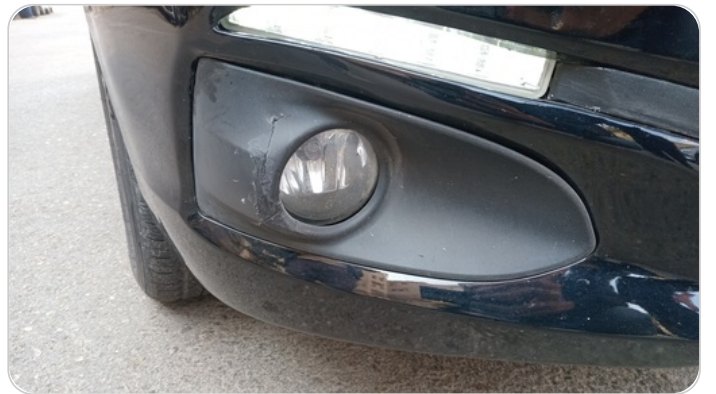
فبرة شبوره يمين : لحام