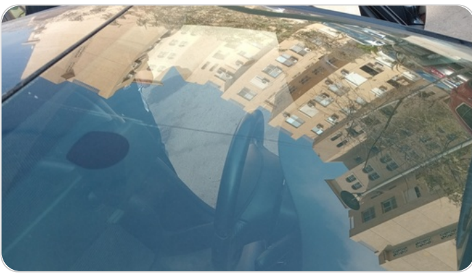
زجاج السيارة الأمامي : شروخ أو كسور