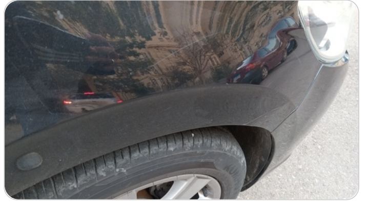
الرفرف الأمامي يمين : فبريكة (خرابيش - خبطات)