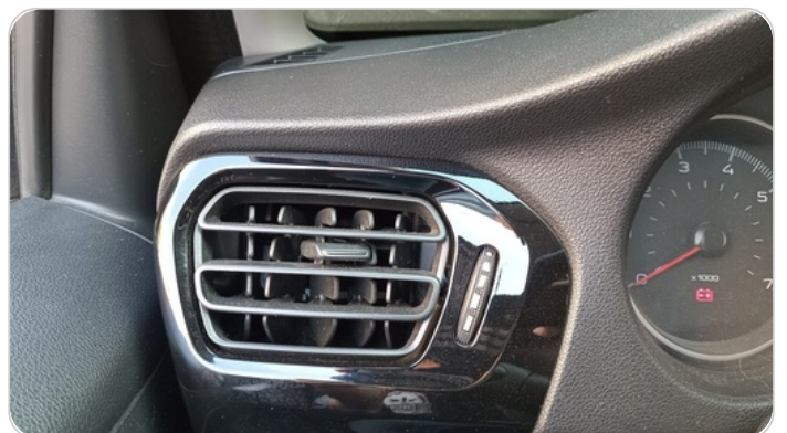
هوايات التكييف : كسر (هواية واحدة)