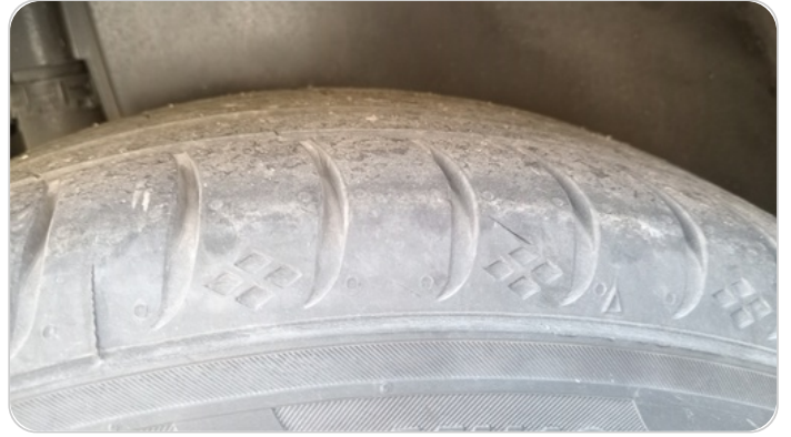
حالة الكاوتش الخلفي : تشققات/قطع بسيط