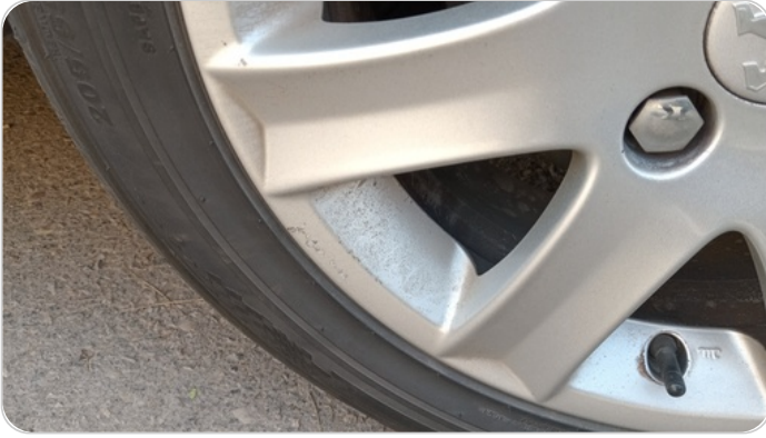
حالة الجنوط الخلفي : تجريحات بسيطة