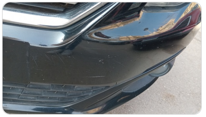
الاكصدام الأمامي : رش مع معجون (خرابيش)