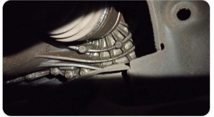
اويل سيل كوبلن داخلي شمال : تسريب زيت