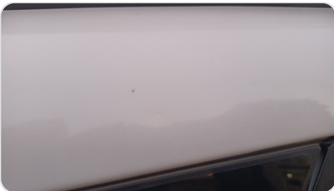
قائم خارجي خلفي يمين : فبريكة ( خرابيش )