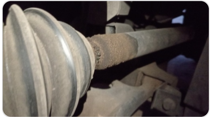
كوبلن خارجي يمين : تسريب شحم