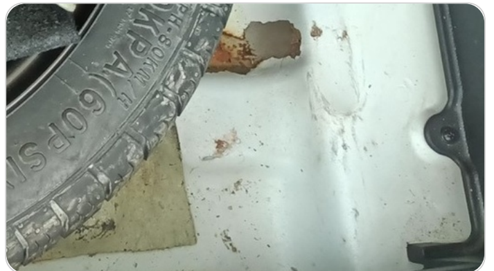
أرضية الشنطة : اثار صدأ