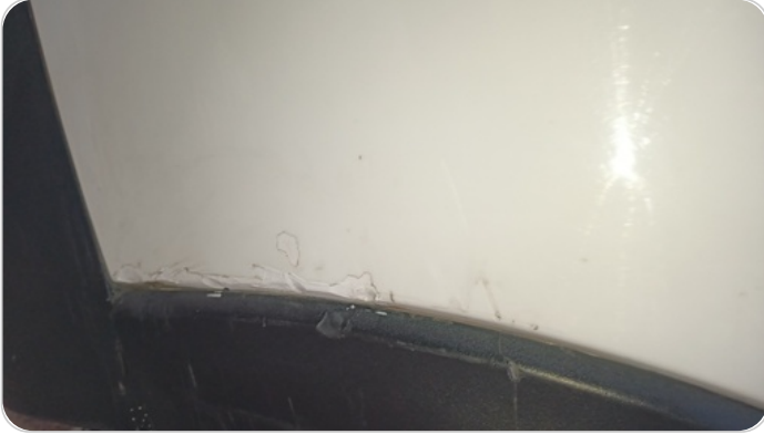
الاكصدام الخلفي : فبريكة (خرابيش - خبطات)