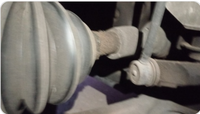
كوبلن خارجي شمال : تسريب شحم