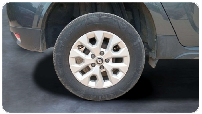
RR R TIRE