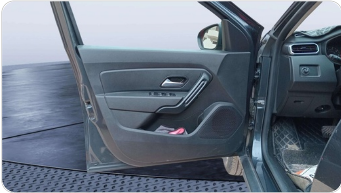
FR L DOOR