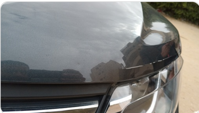
الكبوت : فبريكة (خرايبش)