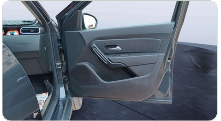
FR R DOOR