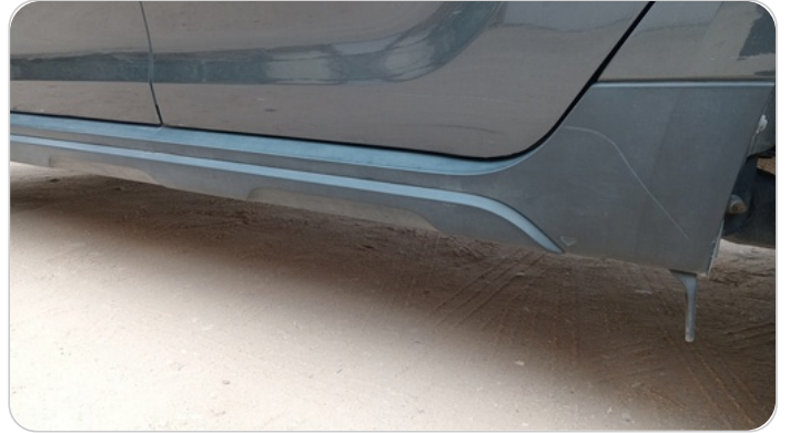
العتب السفلي شمال : فبريكة (خرابيش)