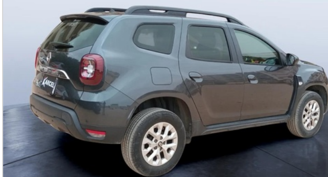
RR R 45