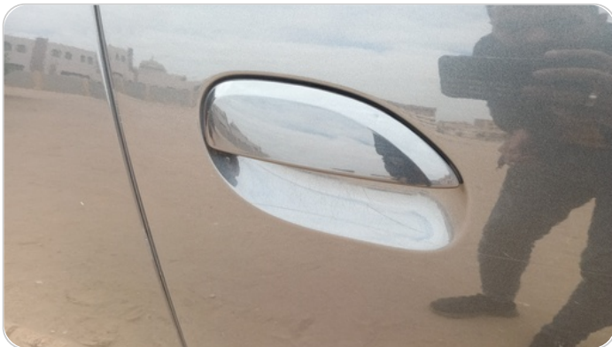
الباب الأمامي يمين : فبريكة (خرابيش)