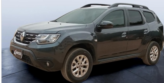
FR L 45