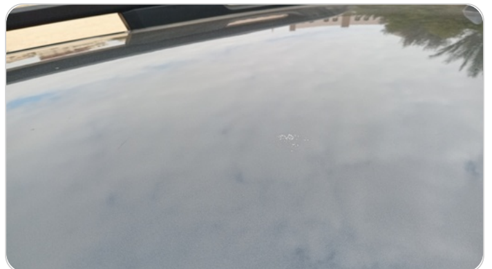
السقف : فبريكة (خرايبش)