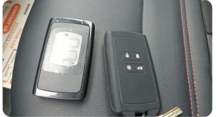
الريموت /المفتاح الاضافي : يعمل بكفاءة