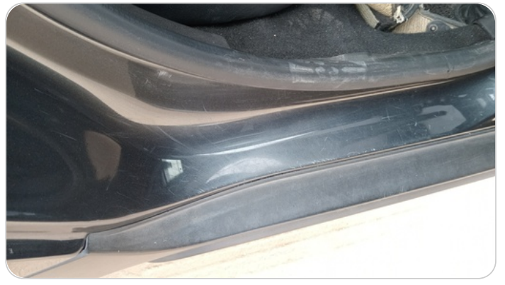
دواخل وقوائم باب خلفي يمين : فبريكة (خرابيش)