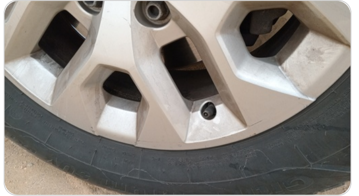
حالة الجنوط الأمامي : تجريحات بسيطة