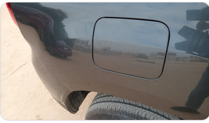
الرفرف الخلفي يمين : فبريكة (خرابيش)