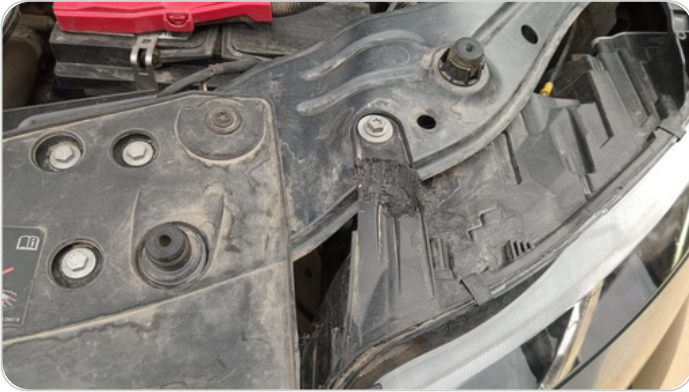
الكشاف الأمامي شمال : كسرفي قواعد الكشاف