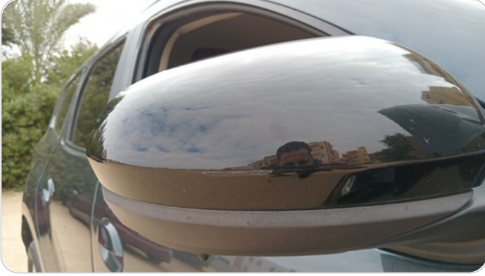
مراية الباب الأمامي يمين : فبريكة (خرابيش)