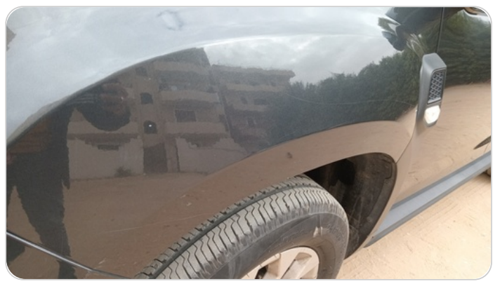
الرفرف الأمامي شمال : فبريكة (خرابيش)