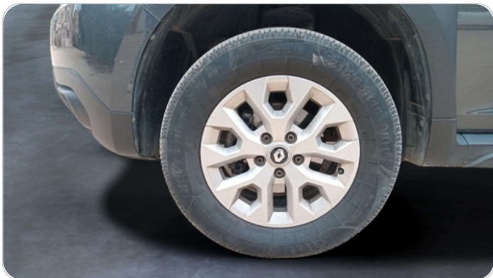
FR L TIRE