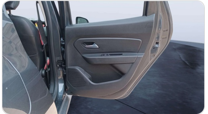
RR R DOOR