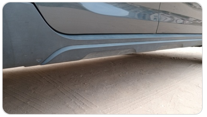
العتب السفلي يمين : فبريكة (خرابيش)