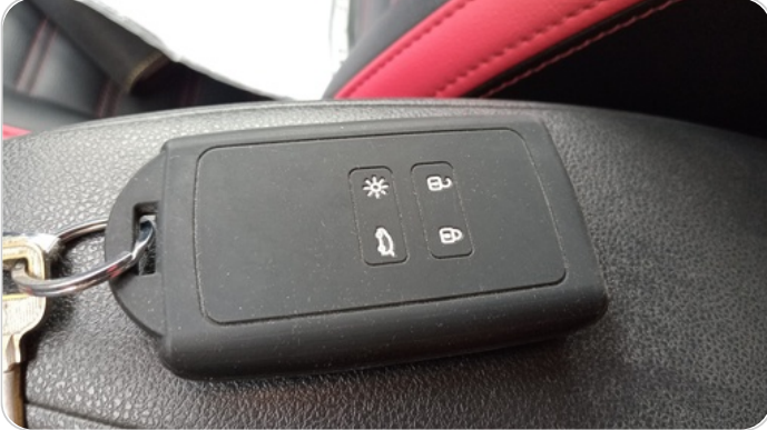
حالة الريموت / المفتاح : يعمل بكفاءة