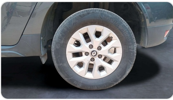
RR L TIRE