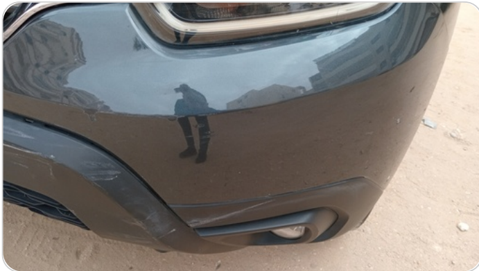
الاكصدام الأمامي : فبريكة (خرابيش - خبطات)