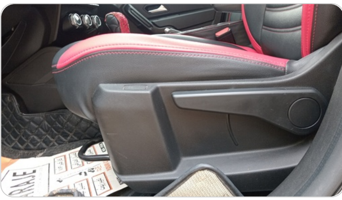
DRIVER SEAT SWITCHES