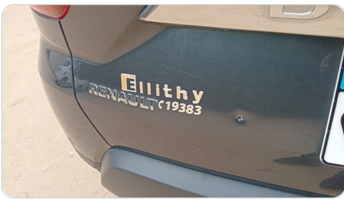
باب الشنطة : فبريكة ( خرابيش - خبطات )