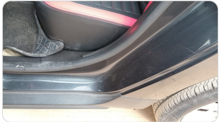
دواخل وقوائم باب الخلفي شمال : فبريكة (خرابيش)