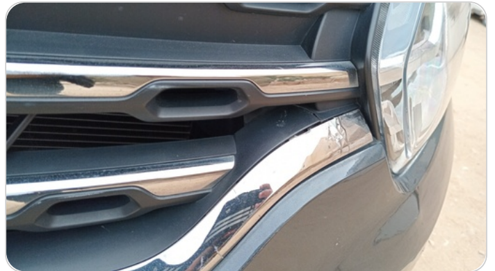
شبكة أمامية : شرخ / كسر