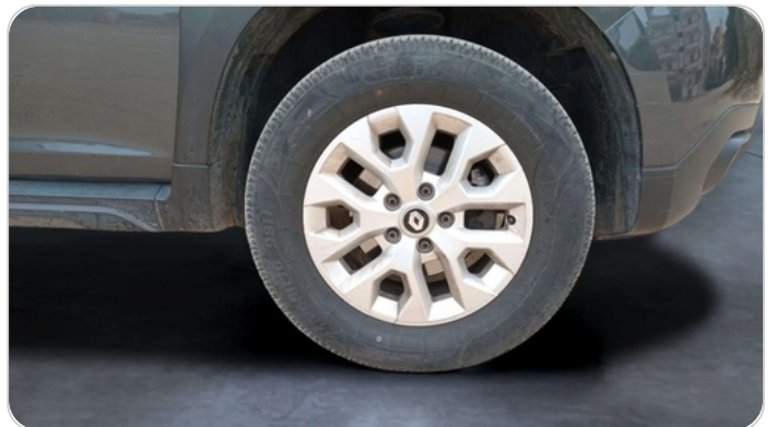
FR R TIRE