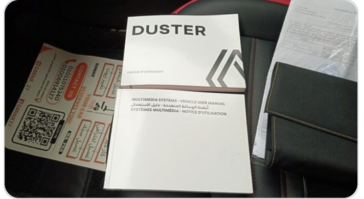
كتالوج السيارة : موجود