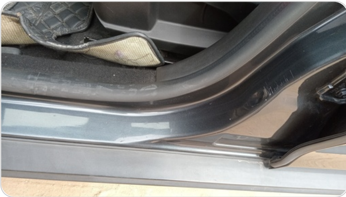
دواخل وقوائم باب الأمامي شمال : فبريكة (خرابيش)