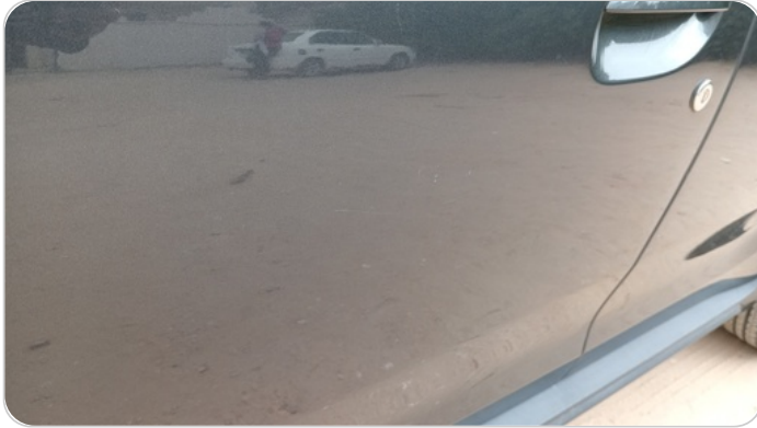
الباب الأمامي شمال : فبريكة (خرابيش)