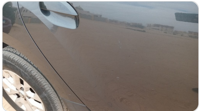
الباب الخلفي يمين : فبريكة (خرابيش)