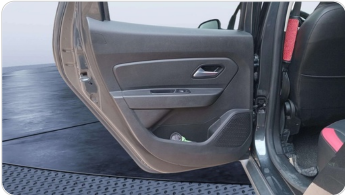
RR L DOOR