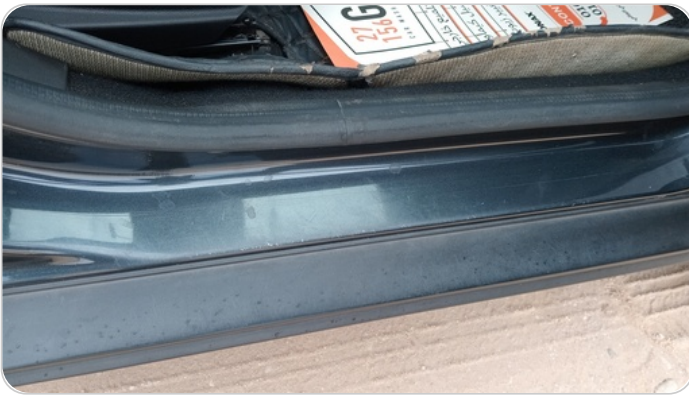
دواخل وقوائم باب أمامي يمين : فبريكة (خرابيش)