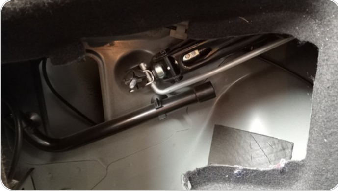
العدة وأدوات الأمان : متوفرة (بحالة جيدة)