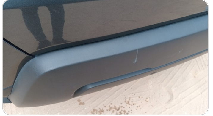
الاكصدام الخلفي : فبريكة (خرابيش)