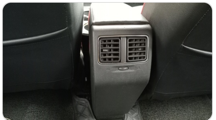
RR AC GRILL