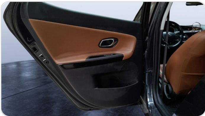
RR L DOOR