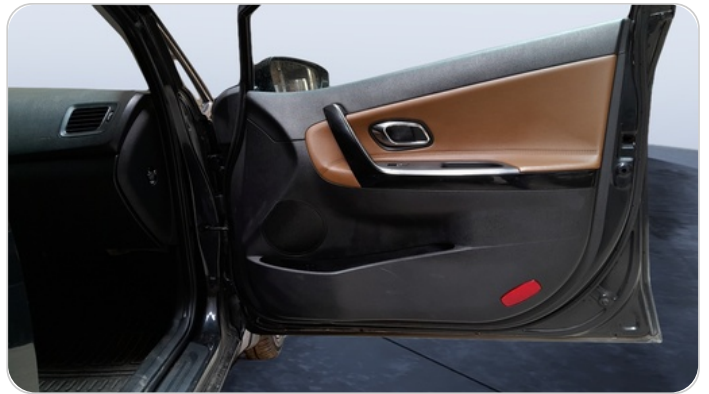
FR R DOOR