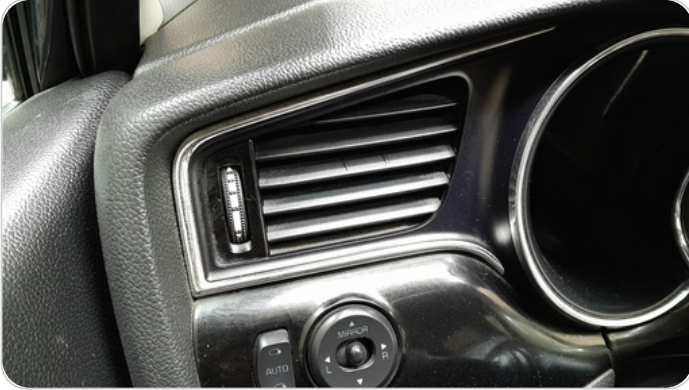
هوايات التكييف : كسر (أكثر من هواية)