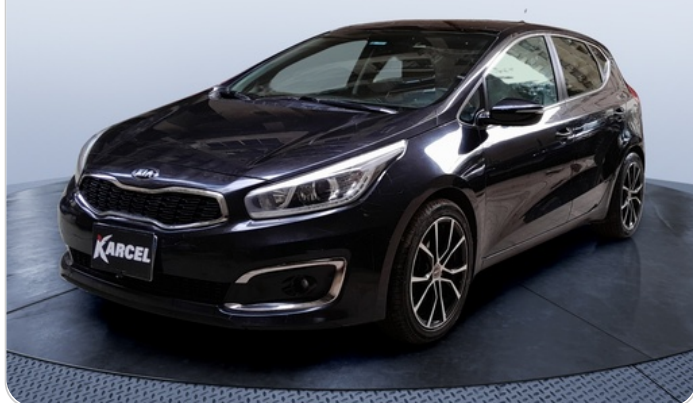
FR L 45