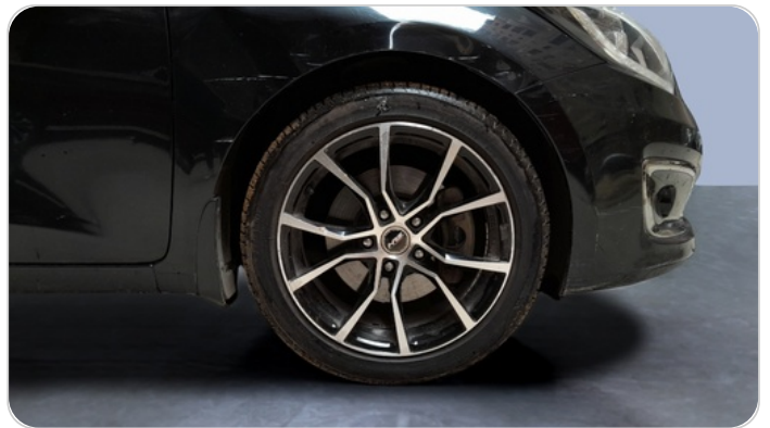
FR R TIRE