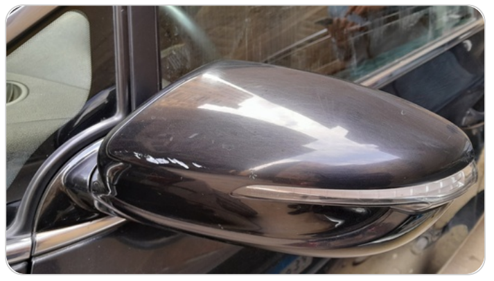
مراية الباب الأمامي شمال : فبريكة (خرابيش)