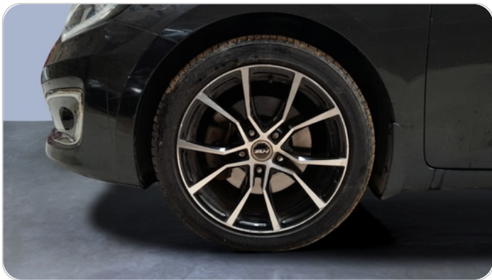
FR L TIRE