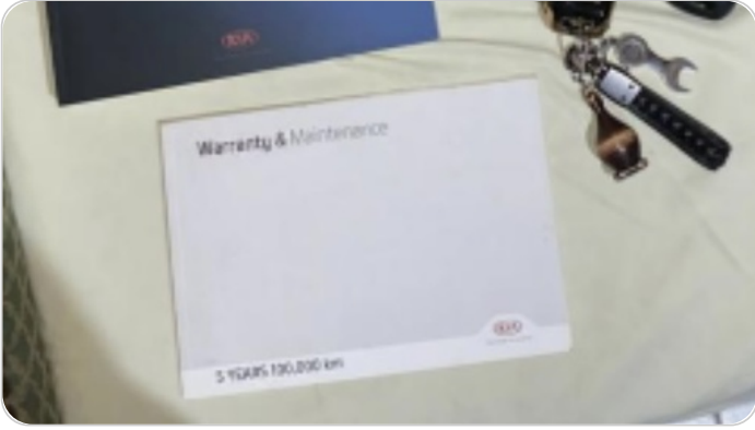
كتيب الضمان : موجود