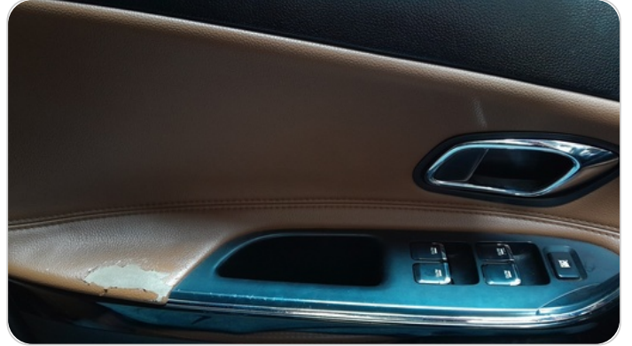
فرش الباب الأمامي شمال : قطع/كسر/شرخ/تلف