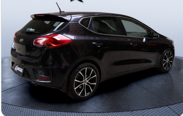
RR R 45