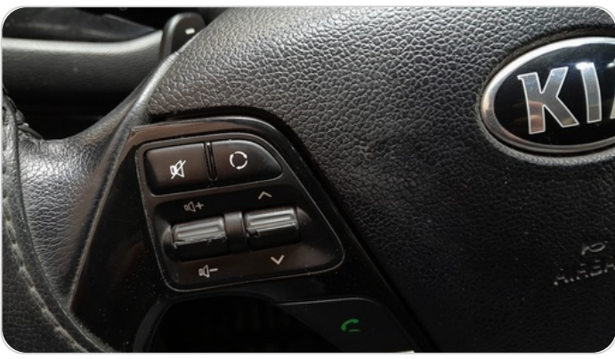
زر تحكم في الصوت : تاكل