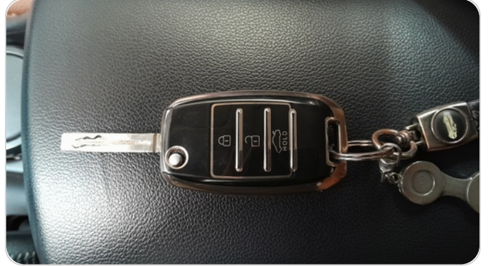
حالة الريموت / المفتاح : يعمل بكفاءة