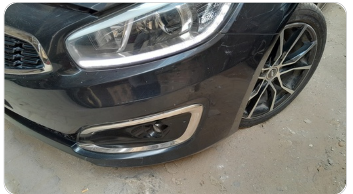
الاكصدام الامامي :