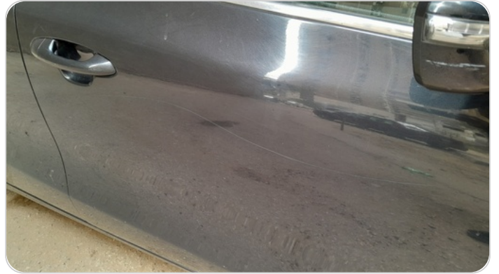
الباب الأمامي يمين : فبريكة (خرابيش)