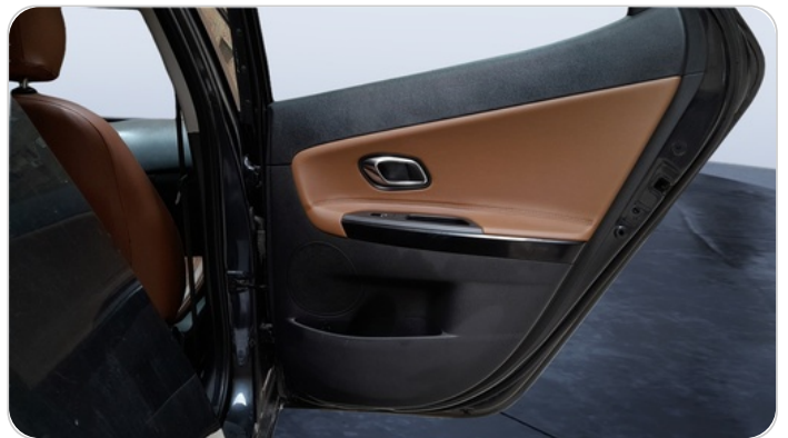
RR R DOOR