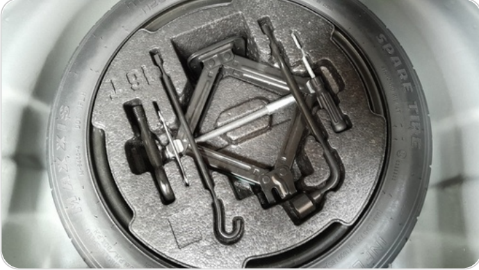
العدة وأدوات الأمان : متوفرة (بحالة جيدة)