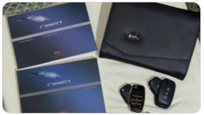
كتالوج السيارة : موجود