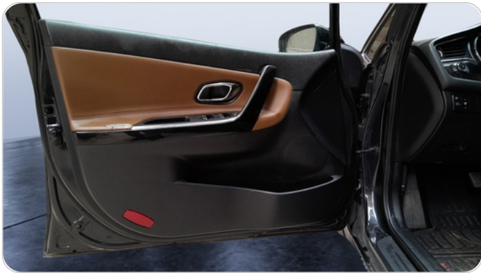
FR L DOOR