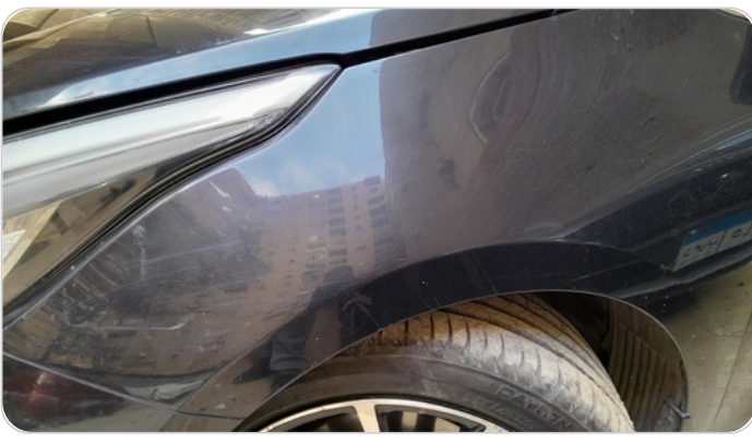
الرفرف الخلفي شمال : فبريكة (خرابيش)