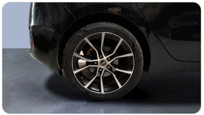
RR R TIRE