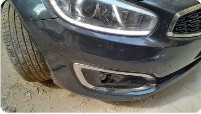
الاكصدام الأمامي : رش بدون معجون (خرابيش)