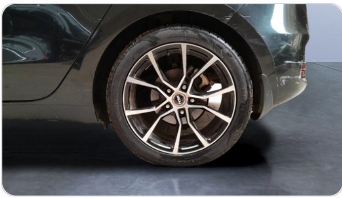
RR L TIRE