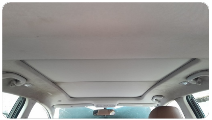
CAR ROOF MAT