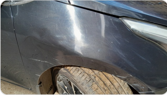
الرفرف الأمامي يمين : فبريكة (خبطات)