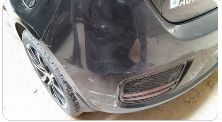
الاكصدام الخلفي : رش بدون معجون (خرابيش)