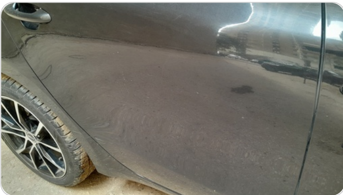
الباب الخلفي يمين : فبريكة (خرابيش)