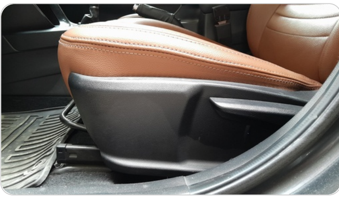
DRIVER SEAT SWITCHES