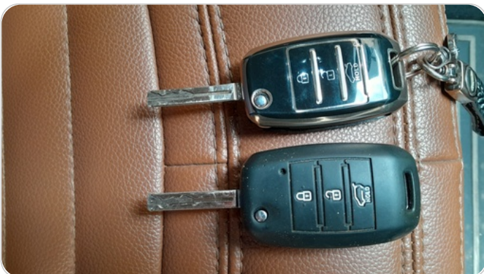
الريموت /المفتاح الاضافي : يعمل بكفاءة