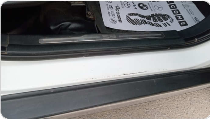
دواخل وقوائم باب أمامي يمين : فبريكة (خرايش)