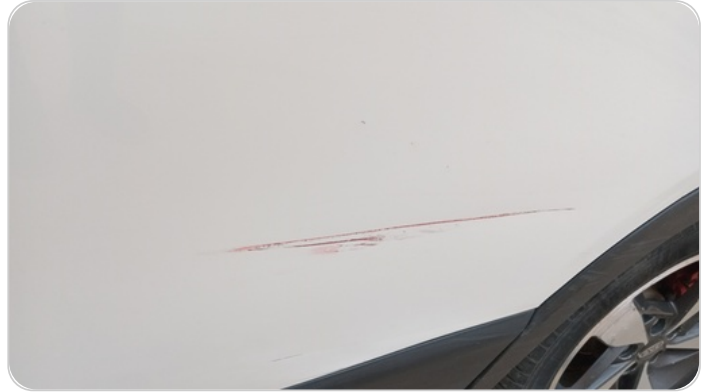
الباب الخلفي شمال : رش مع معجون (خرابيش)