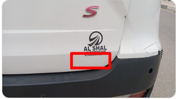
باب الشنطة : رش جزئي بدون معجون