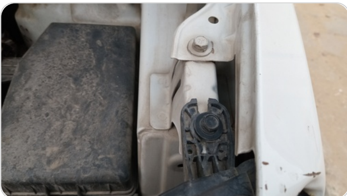
الكشاف الأمامي شمال : كسر في قواعد الكشاف