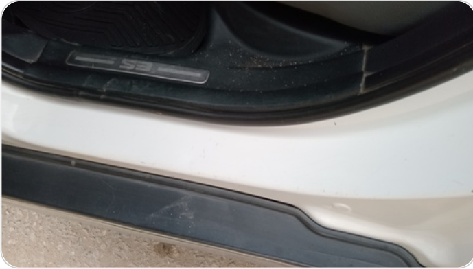
دواخل وقوائم باب الخلفي شمال : فبريكة (خرايش)