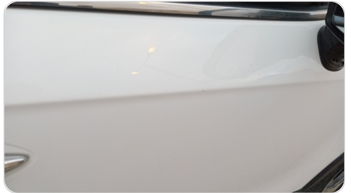
الباب الأمامي يمين : فبريكة (خرابيش)