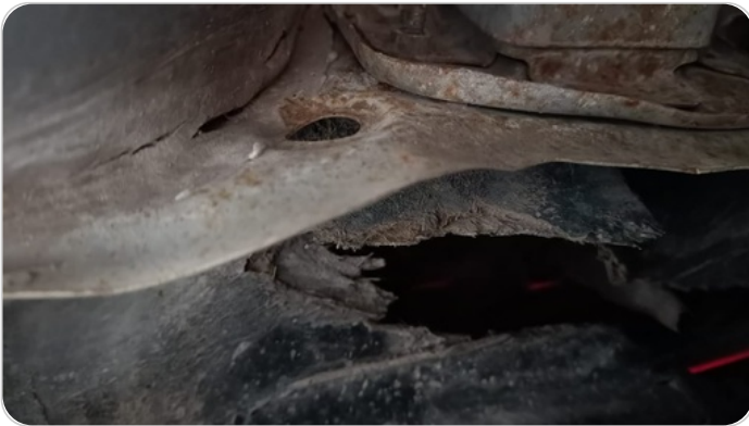
شاشية اكصدام خلفي : كسر