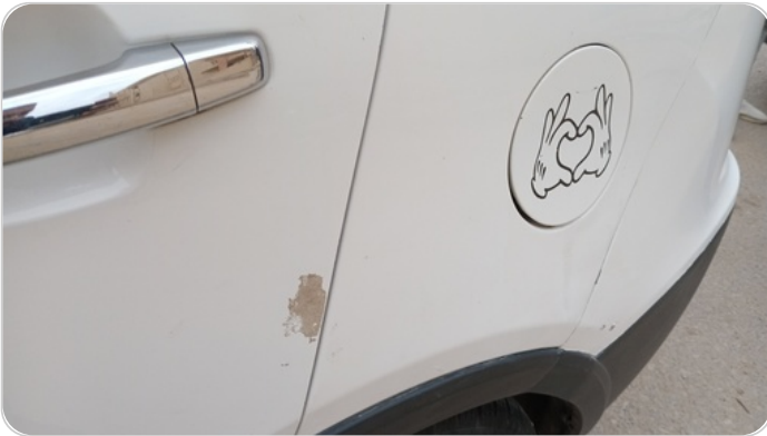
الرفرف الخلفي شمال : رش مع معجون (خرابيش)