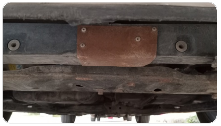
صدر امامي يمين : لحام