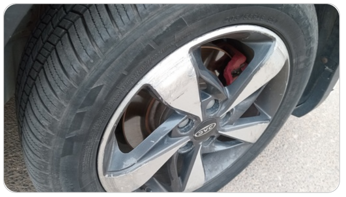
حالة الجنوط الأمامي : تجريحات بسيطة