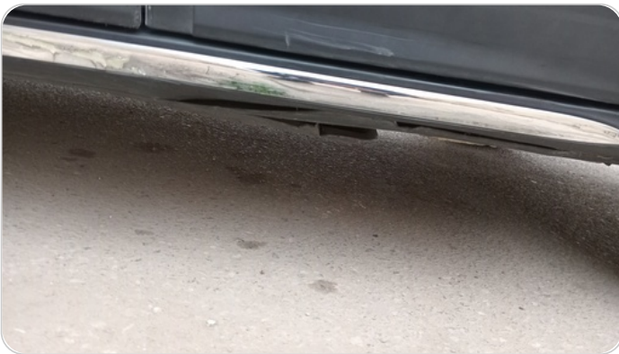
عتب شمال : كسر