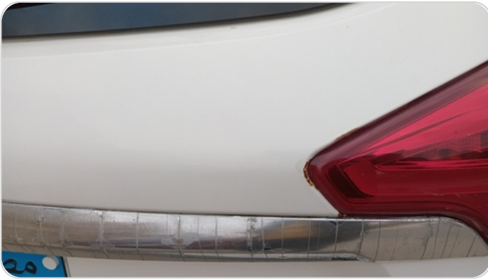
باب الشنطة : نقاط صدأ