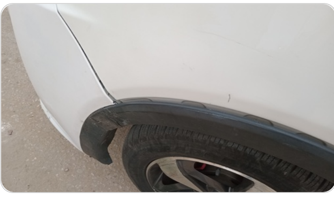
داير رفرف امامي شمال : كسر