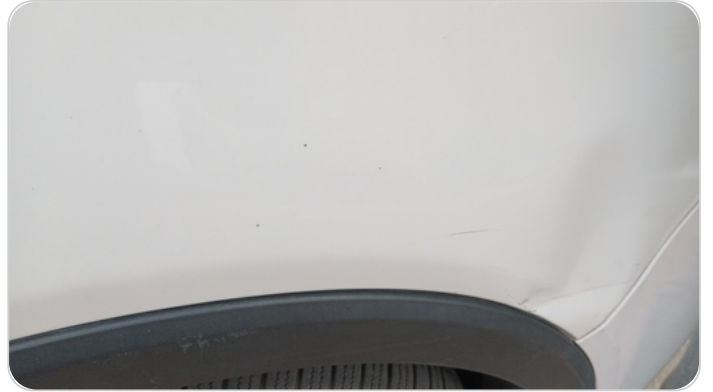
الرفرف الأمامي يمين : رش بدون معجون (خبطات)