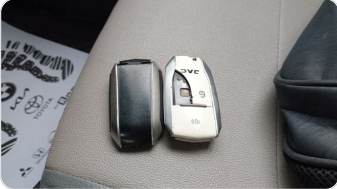
الريموت /المفتاح الاضافي : كسر