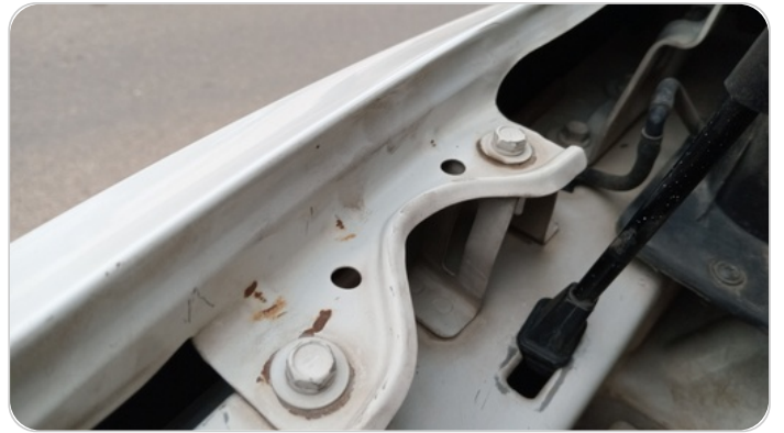
رفرف امامي يمين : اثار فك وتركيب