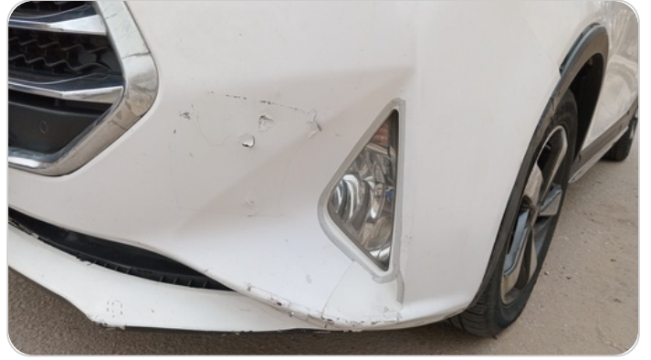
اكصدام امامي : رش مع معجون (خبطات)