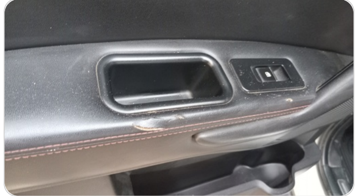
فرش الباب الخلفي شمال : قطع /كسر/شرخ /تلف