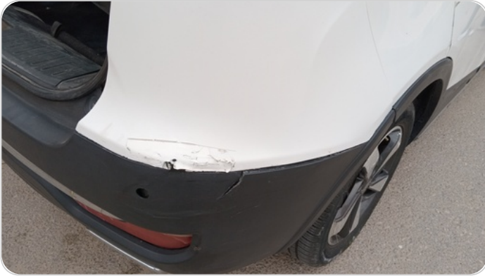
الاكصدام الخلفي : رش بدون معجون (خبطات)