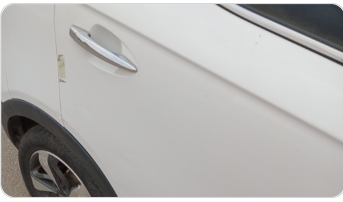
الباب الخلفي يمين : فبريكة (خرابيش - خبطات)