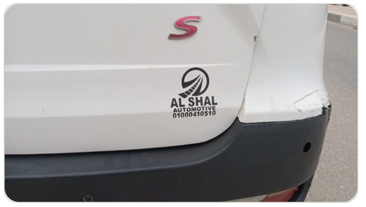
باب الشنطة : رش بدون معجون (خرابيش)