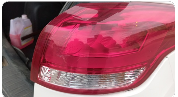
الكشاف الخلفي يمين : كسر بالباغة