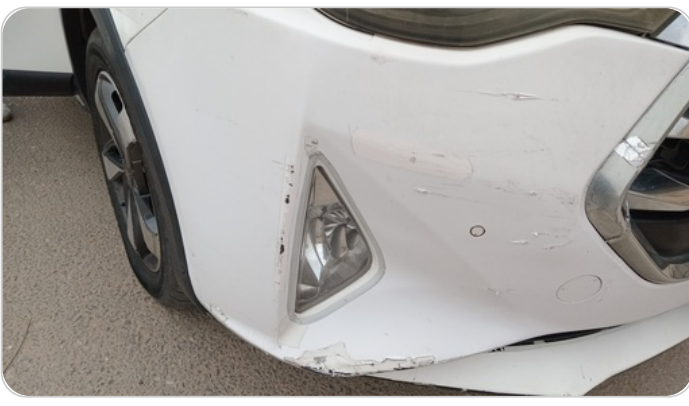
الاكصدام الأمامي : رش مع معجون (خبطات)