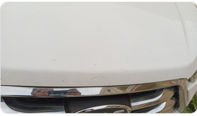
الكبوت : فبريكة (خرابيش)