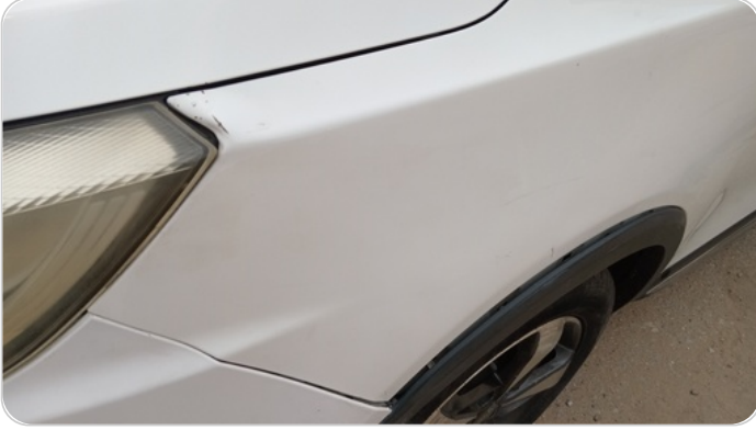
الرفرف الأمامي شمال : رش بدون معجون (خرابيش)