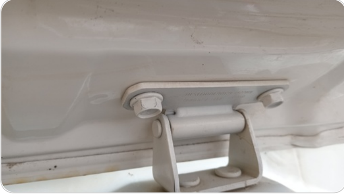
مفصلات ومسامير الشنطة : آثار فك وتركيب