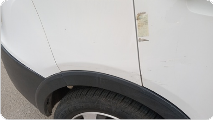
الرفرف الخلفي يمين : فبريكة (خرابيش - خبطات)