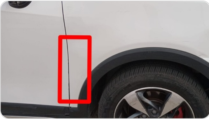
رفرف امامي يمين : رش جزئي بدون معجون