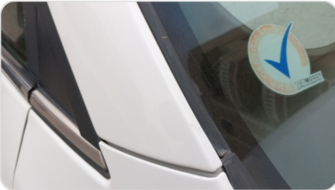
قائم خارجي أمامي يمين : فبريكة (خرابيش)