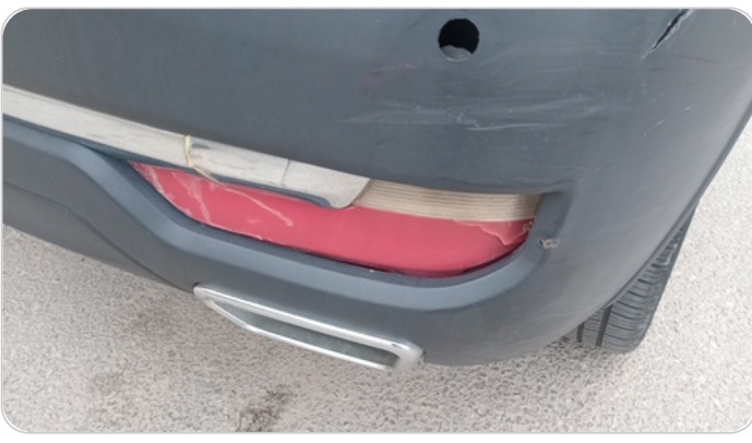
كشافات شبورة خلفي : كسر بالباغة