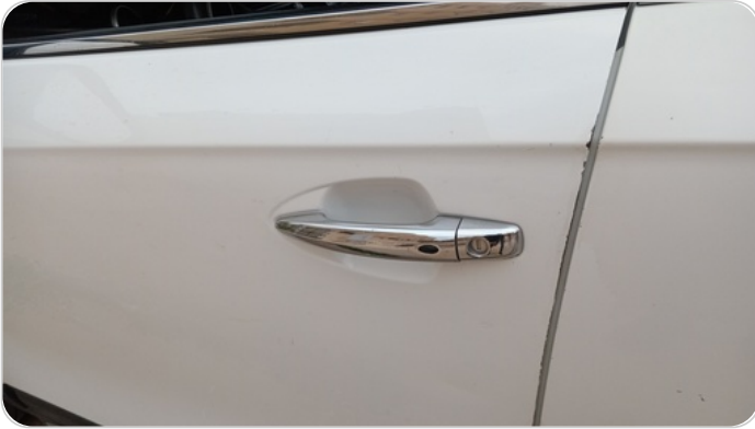
الباب الأمامي شمال : فبريكة (خرابيش)