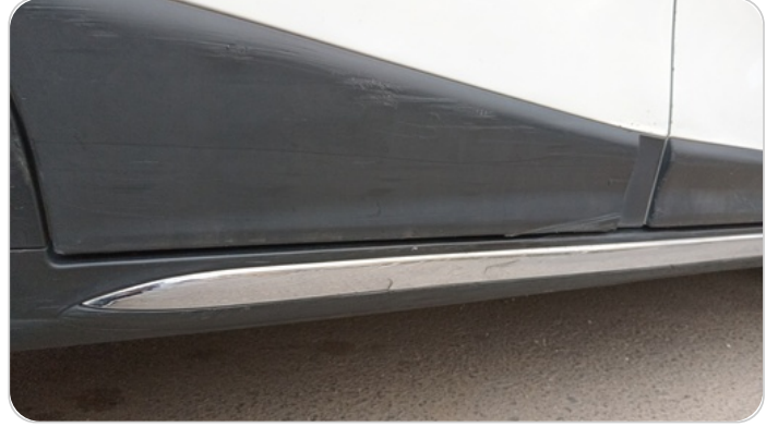
العتب السفلي يمين : فبريكة (خرابيش - خبطات)