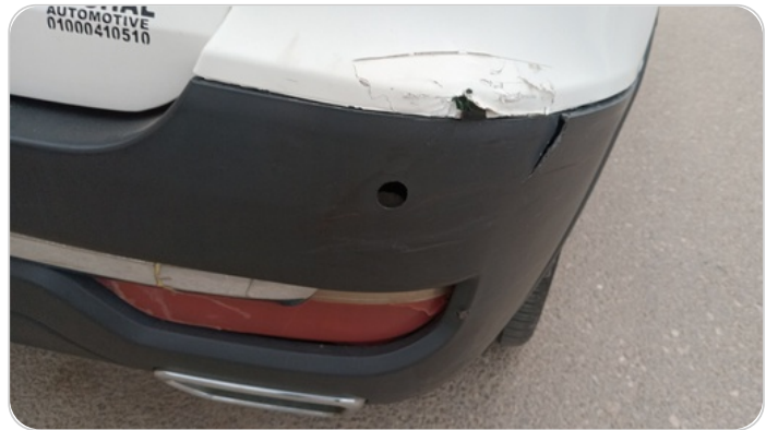
احد حساسات خلفية : فقد