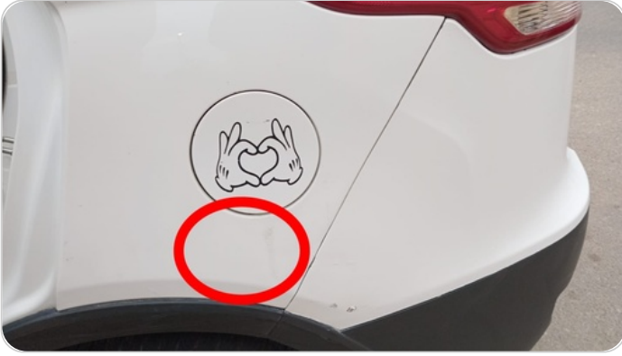
رفرف خلفي شمال : رش جزئي بدون معجون