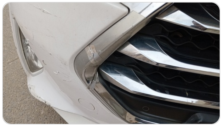
شبكة أمامية : شرخ / كسر