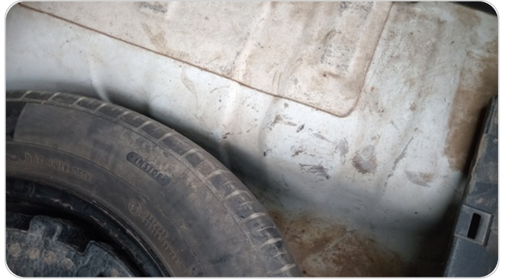
دواخل وأرضية الشنطة : فبريكة (خرايش)