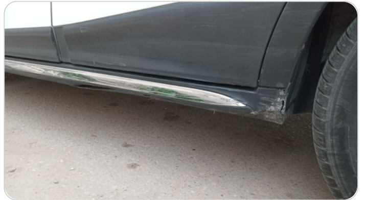
العتب السفلي شمال : فبريكة (خرابيش - خبطات)