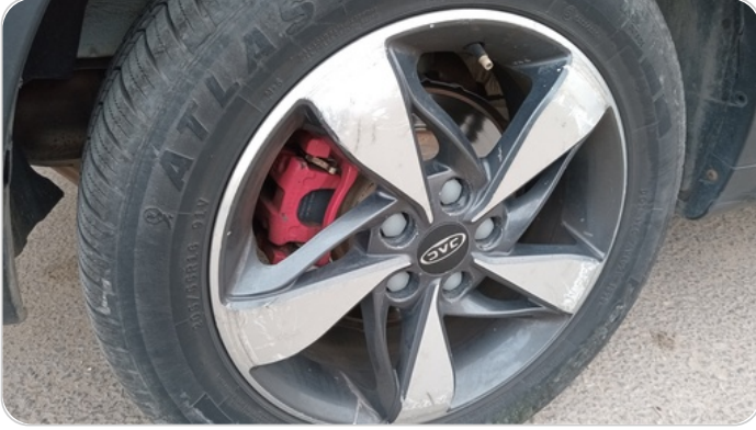
حالة الجنوط الخلفي : تجريحات بسيطة