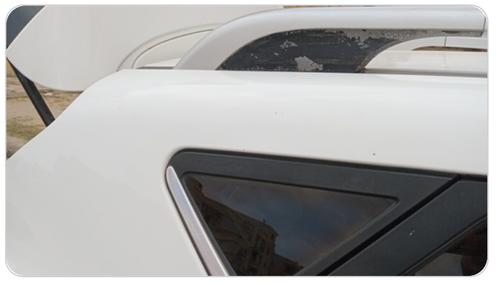
قائم خارجي خلفي يمين : فبريكة ( خرابيش )