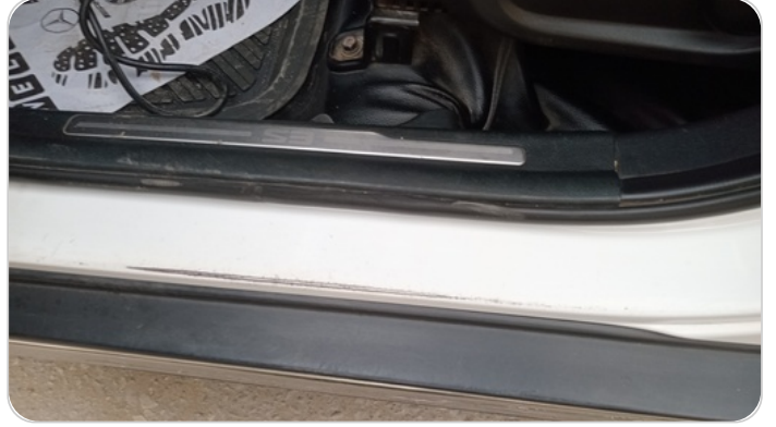
دواخل وقوائم باب الأمامي شمال : فبريكة (خرايش)