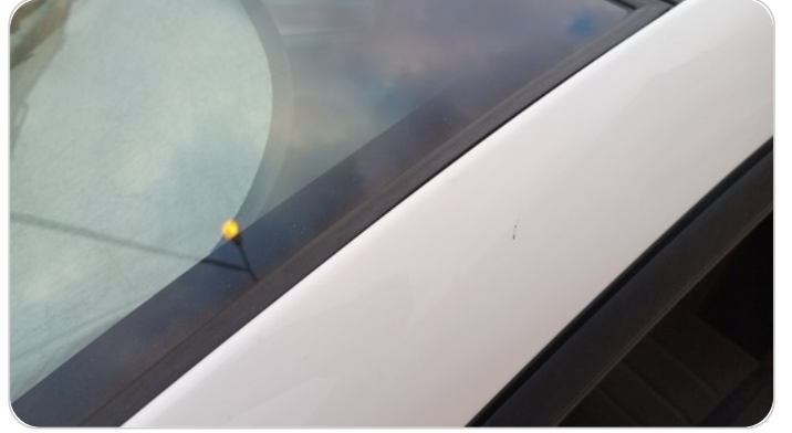
قائم خارجي أمامي شمال : فبريكة (خرابيش)