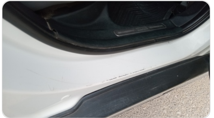
دواخل وقوائم باب خلفي يمين : فبريكة (خرايش)