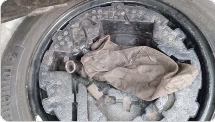
العدة وأدوات الأمان : لا يوجد كوريك