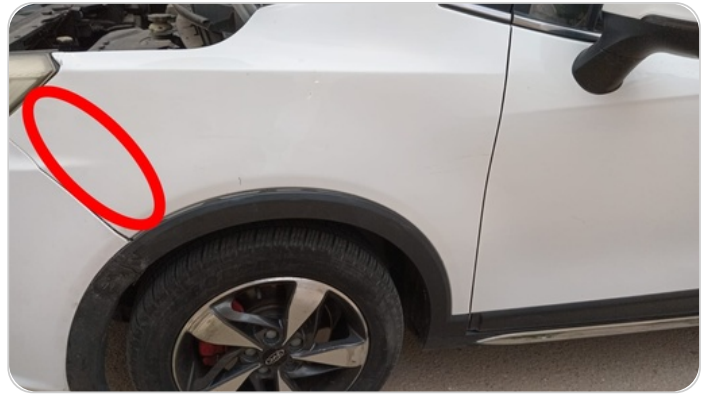
رفرف امامي شمال : رش جزئي بدون معجون