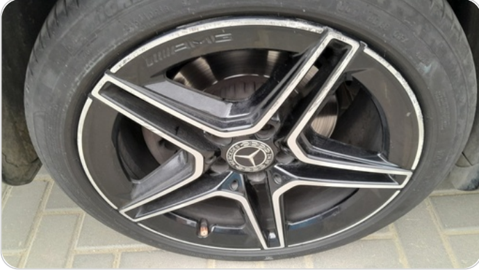
حالة الجنوط الخلفي : تجريحات بسيطه