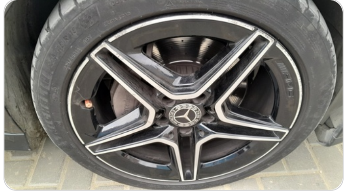
حالة الجنوط الأمامي : تجريحات بسيطة