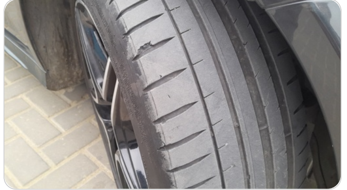
حالة الكاوتش الأمامي : النقشة متآكلة