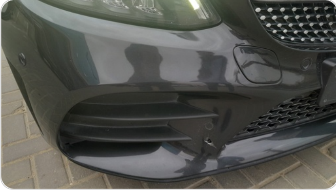
الاكصدام الأمامي : فبريكة (خرابيش)