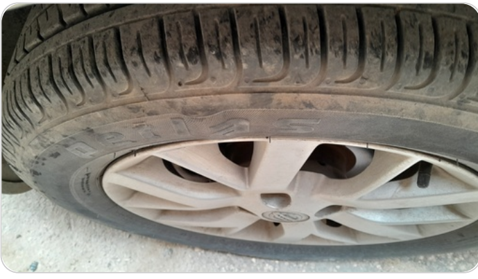
حالة الكاوتش الأمامي : بلونة في الكاوتش