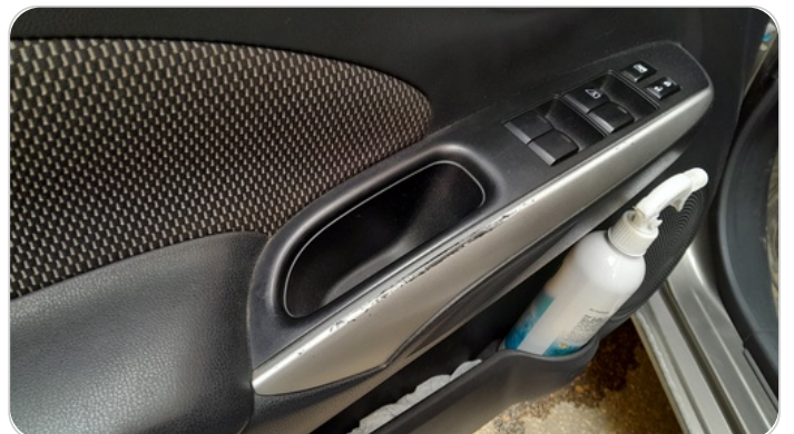
فرش الباب الأمامي شمال : قطع/كسر/شرخ/تلف