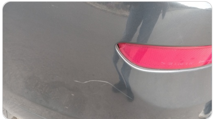
كشافات شبورة خلفي : كسر بالباغة