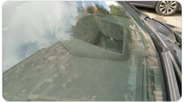
زجاج السيارة الأمامي : نقرة