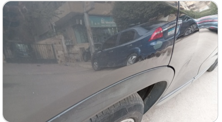
الرفرف الخلفي يمين : فبريكة (سمكره على البارد)