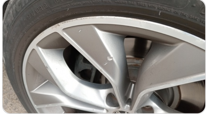
حالة الجنوط الخلفي : تجريحات بسيطه