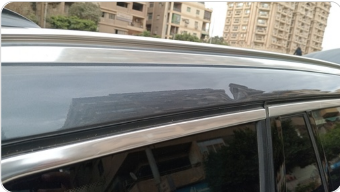
قائم خارجي خلفي يمين : فبريكة (خبطات)