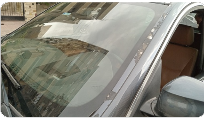
قائم خارجي أمامي شمال : فبريكة (خرابيش)