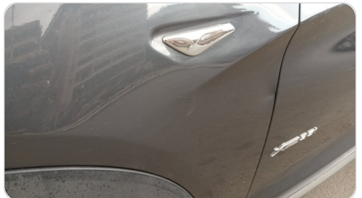
الرفرف الأمامي شمال : فبريكة (خرايش - خبطات)