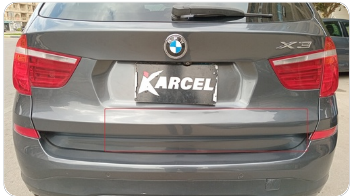
الجزء السفلي لباب الشنطة : رش بمعجون