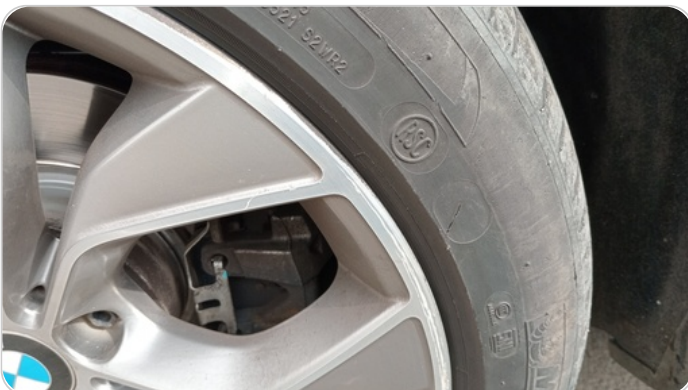
حالة الكاوتش الأمامي : تشققات/قطع بسيط