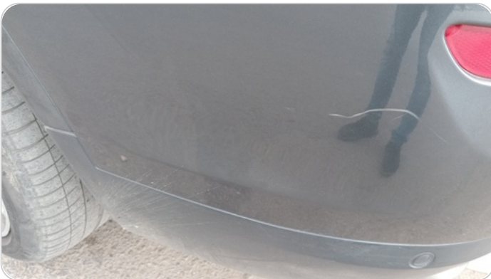
الاكصدام الخلفي : رش مع معجون (خرابيش)