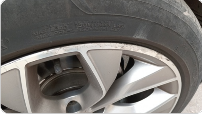
حالة الجنوط الأمامي : تجريحات بسيطة