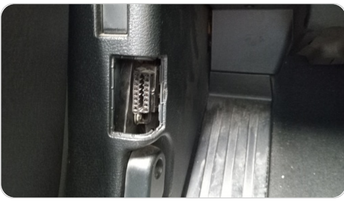
غطاء ال OBD : فقد