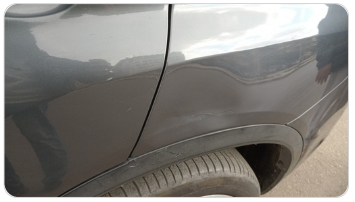
الرفرف الخلفي شمال : فبريكة (خبطات)