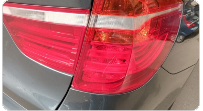
الكشاف الخلفي يمين : كسر بالباعة