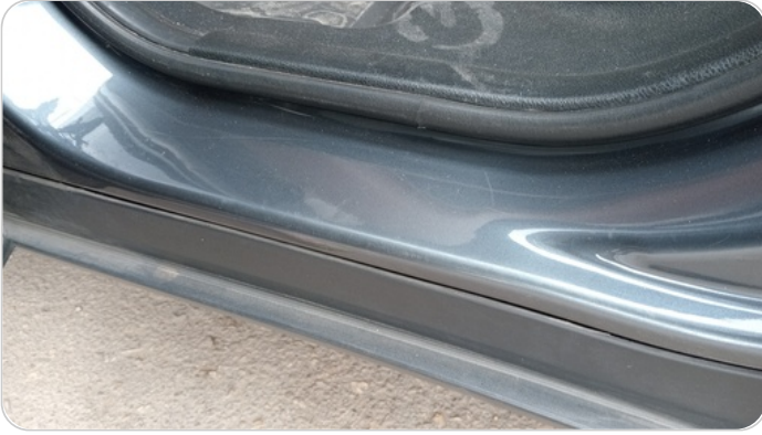
دواخل وقوائم باب الخلفي شمال : فبريكة (خرابيش)