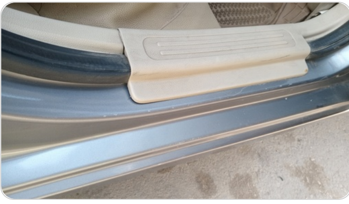
دواخل وقوائم باب خلفي يمين : فبريكة (خرابيش)