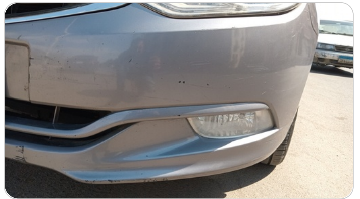
الاكصدام الأمامي : رش بدون معجون (خبطات)