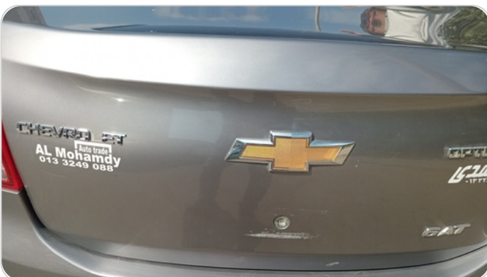
باب الشنطة : فبريكة (خرايش)