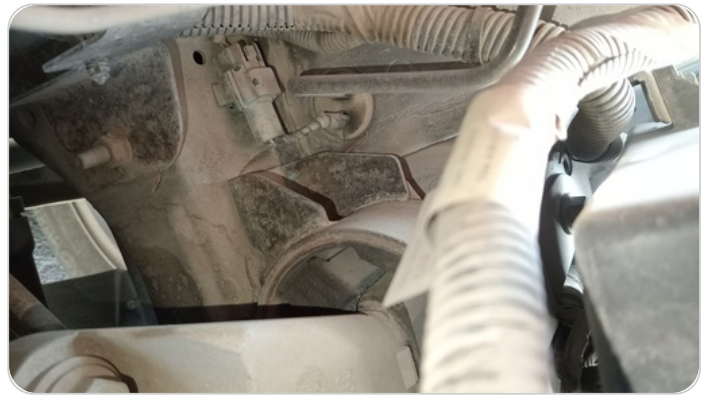
قاعدة محرك شمال(قاعدة فتييس) : يوجد تشققات / قطع