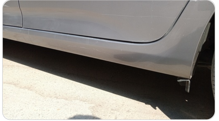
العتب السفلي شمال : فبريكة (خرابيش)