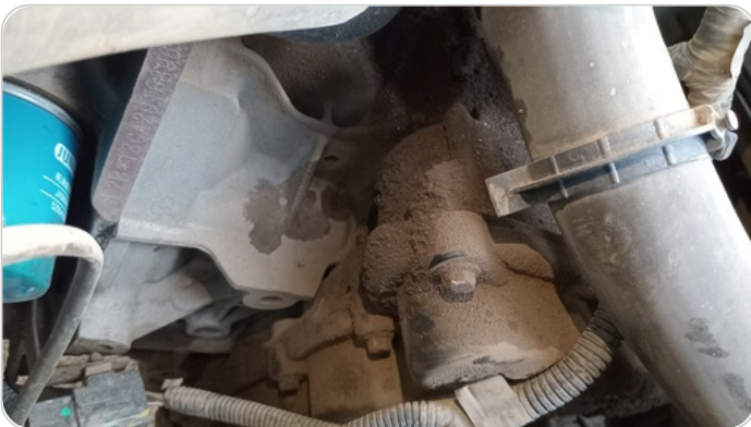
الفيتيس : اثار تسريبات زيت قديمة