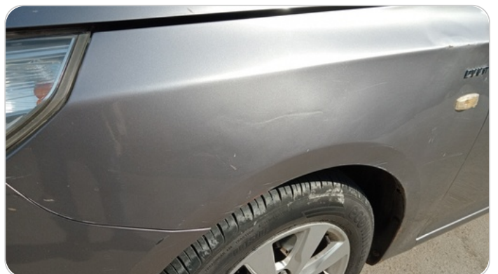
الرفرف الأمامي شمال : فبريكة (سمكره على البارد)