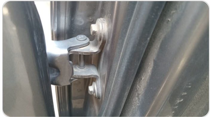
مفصلات ومسامير الباب الخلفي يمين : آثار فك وتركيب