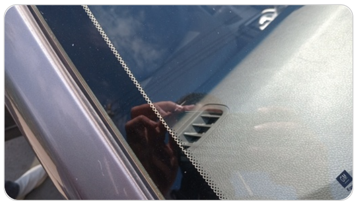
قائم خارجي أمامي يمين : فبريكة (الدهان متآكل)