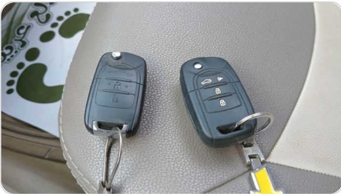
الريموت / المفتاح الاضافي : يعمل بكفاءة