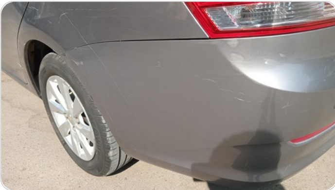
الاكصدام الخلفي : رش بدون معجون (خرابيش)