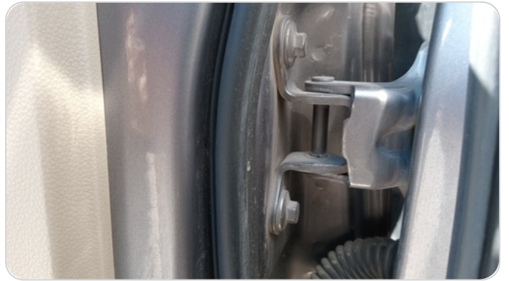
مفصلات ومسامير الباب الأمامي شمال : آثار فك وتركيب