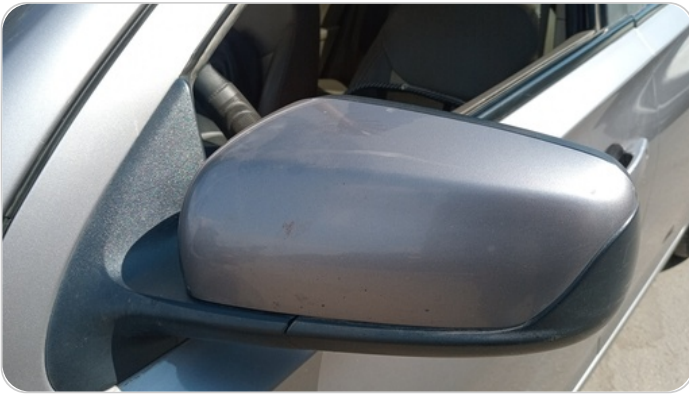
مرآة الباب الأمامي شمال : فبريكة (خرابيش)