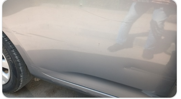
الباب الخلفي يمين : فبريكة (خرابيش - خبطات)