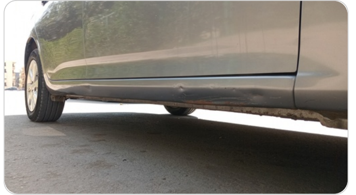
العتب السفلي يمين : فبريكة (خرابيش - خبطات)