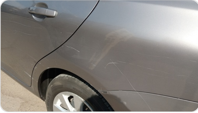
الرفرف الخلفي شمال : فبريكة (خرابيش - خبطات)