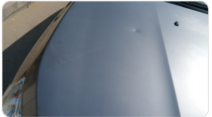
الكبوت : فبريكة (خبطات)