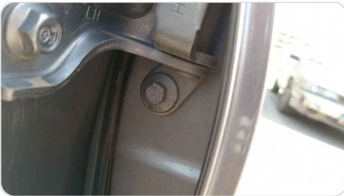
مفصلات ومسامير الباب الخلفي شمال : آثار فك وتركيب