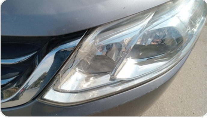
الكشاف الأمامي شمال : كسر بالباغة