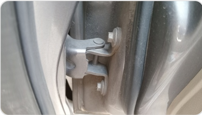
مفصلات ومسامير الباب الأمامي يمين : آثار فك وتركيب