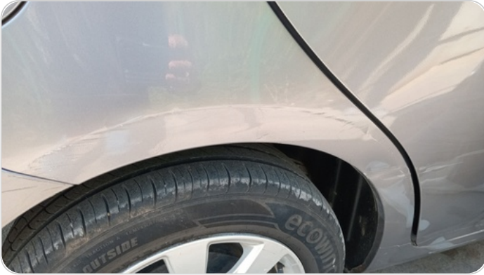
الرفرف الخلفي يمين : فبريكة (خرابيش - خبطات)