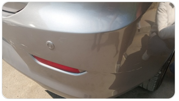
الاكصدام الخلفي : رش بدون معجون (خرابيش)