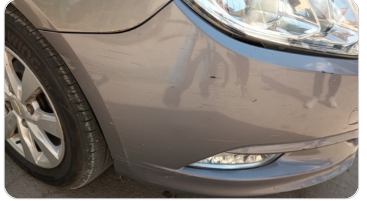
الاكصدام الأمامي : رش بدون معجون (خرابيش)