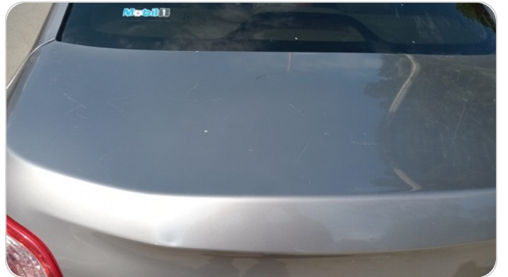
باب الشنطة : فبريكة (خرابيش)