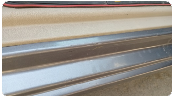
دواخل وقوائم باب أمامي يمين : فبريكة (خرابيش)