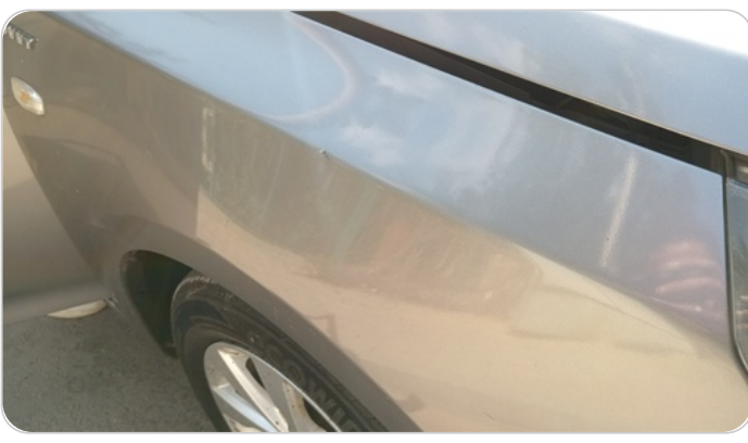
الرفرف الأمامي يمين : فبريكة (خرابيش)