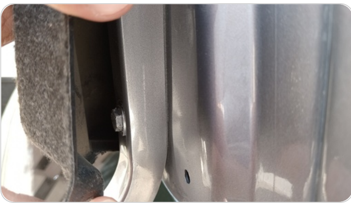
مفصلات ومسامير الشنطة : آثار فك وتركيب