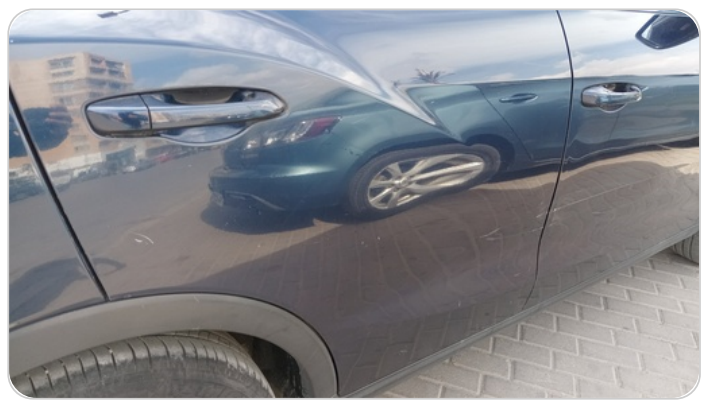
الباب الخلفي يمين : فبريكة (خرابيش - خبطات)