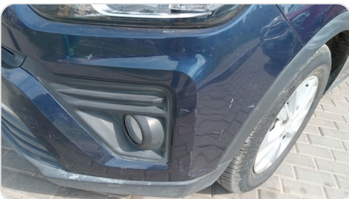
الاكصدام الأمامي : فبريكة ( خرابيش )