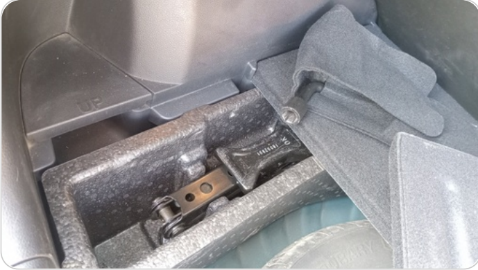
العدة وأدوات الأمان : متوفرة ( بحالة جيدة )