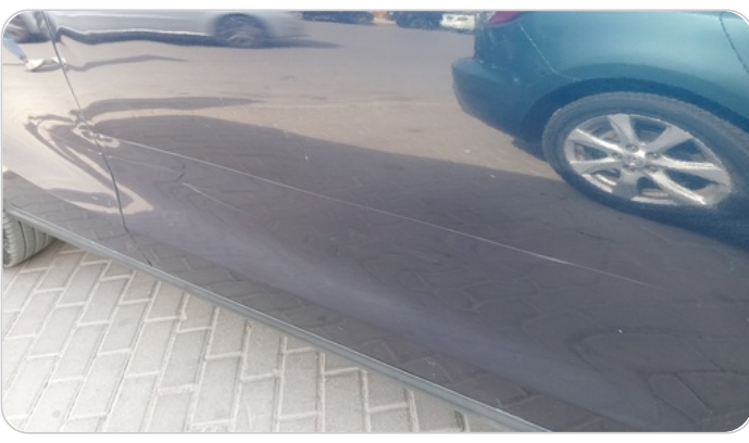
الباب الأمامي يمين : فبريكة (خرابيش - خبطات)