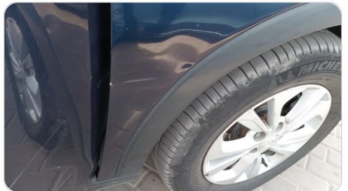
الرفرف الأمامي يمين : فبريكة (خرابيش - خبطات)