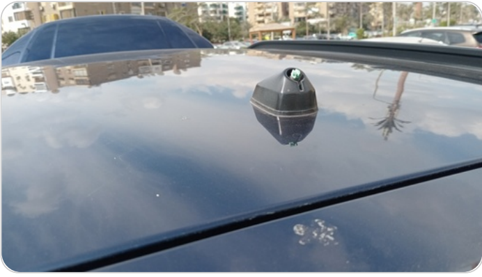
الارياال : فقد