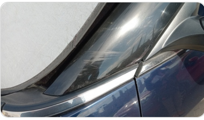
قائم خارجي أمامي شمال : فبريكة (خرابيش)