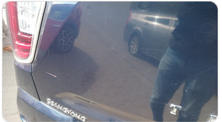
باب الشنطة : فبريكة ( خرابيش - خبطات )