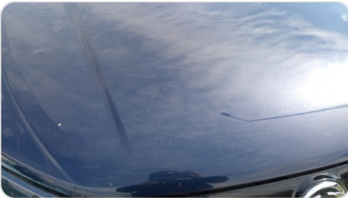
الكبوت : فبريكة ( خرابيش )