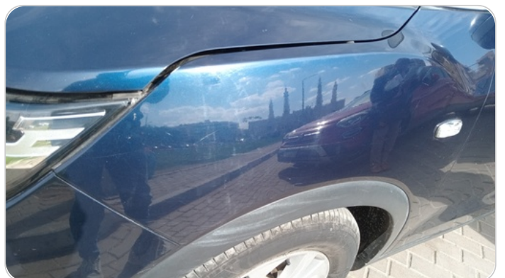
الرفرف الأمامي شمال : فبريكة ( خرابيش - خبطات )