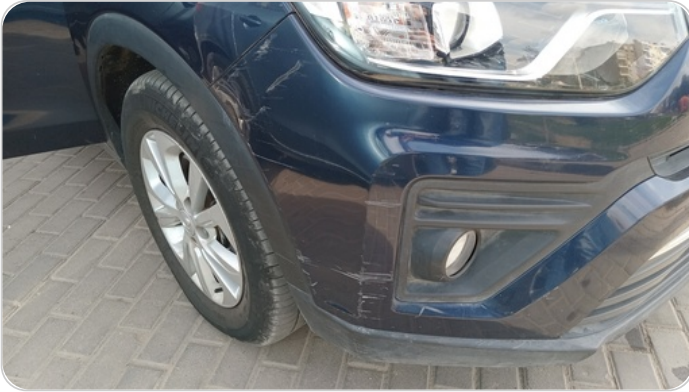
الاكصدام الامامي : فبريكة (خرابيش)