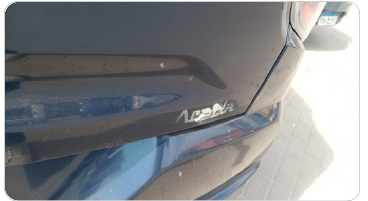
بابا الشنتطه : فبريكة (خرابيش)