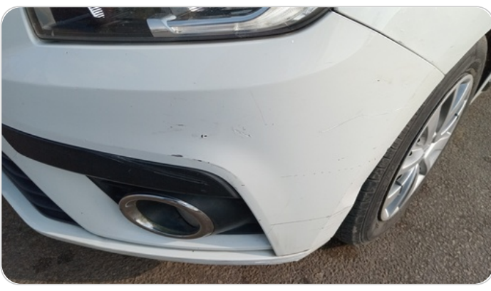
الاكصدام الأمامي : فبريكة (كسر)