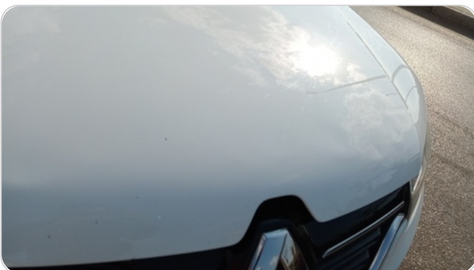
الكبوت : فبريكة (خرايش - خبطات)