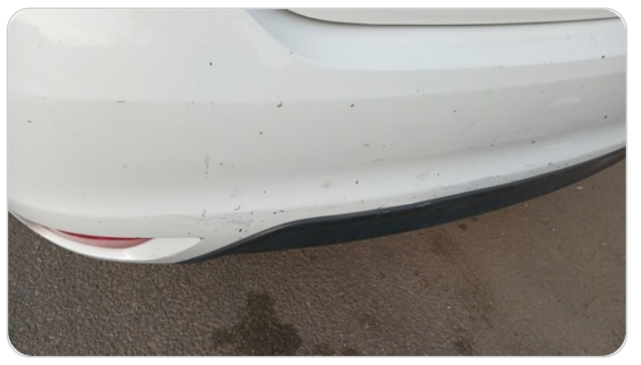
الاكصدام الخلفي : فبريكة (كسر)