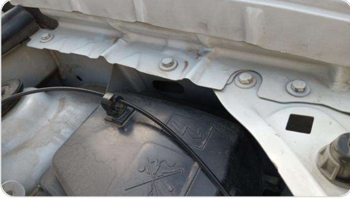
مسامير رفرف امامي شمال : اثار فك وتركيب