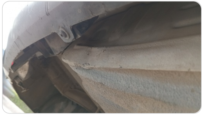
دواخل وأرضية الشنطة : آثار صدمة صغيرة