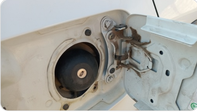
باب التنك : آثار فك وتركيب