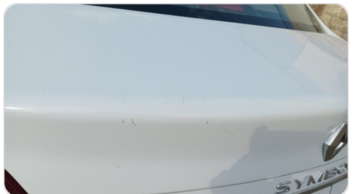
باب الشنطة : فبريكة (خرايش)