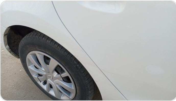
الرفرف الخلفي يمين : فبريكة (خرابيش - خبطات)