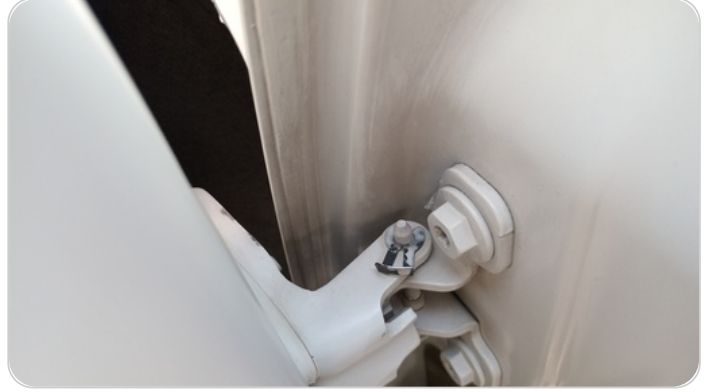
بنوز تثبيت مفصلات الابواب : تاكل