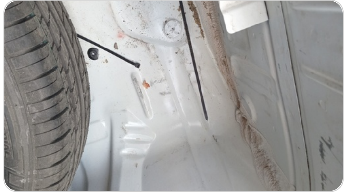
دواخل وأرضية الشنطة : أثار صدمة صغيرة