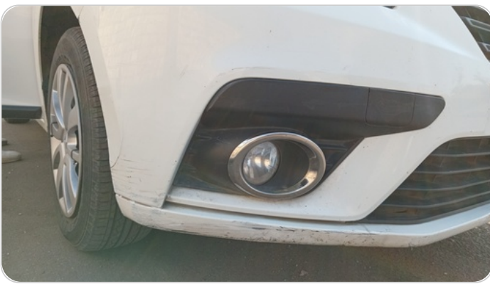
الاكصدام الأمامي : فبريكة (كسر)