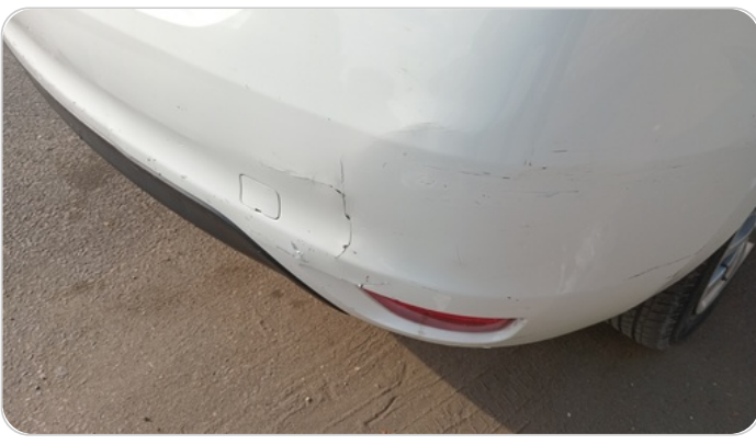
الاصدام الخلفي : فبريكة (كسر)