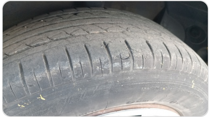
حالة الكاوتش الخلفي : تشققات/قطع بسيط