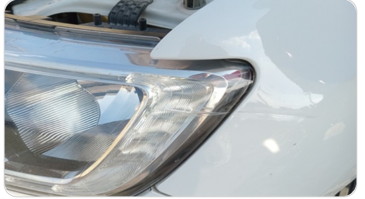
الكشاف الأمامي شمال : كسر بالباغة