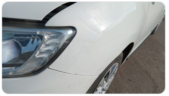
الرفرف الأمامي شمال : فبريكة (سمكره على البارد)