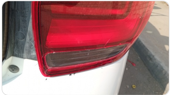
الكشاف الخلفي يمين : كسر بالباغة