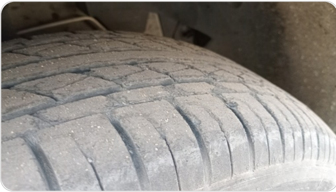
حالة الكاوتش الأمامي : تشققات/قطع بسيط