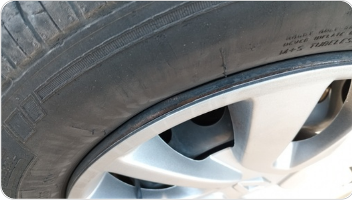
حالة الجنوط الأمامي : آثار خبط أو استعداد