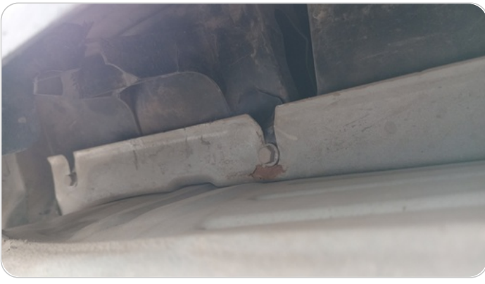
ستارة شنطة خلفية : صدمة بسيطة