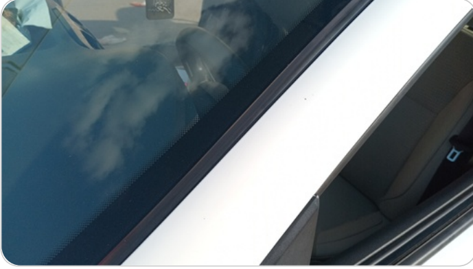
قائم خارجي أمامي شمال : فبريكة (خرابيش)