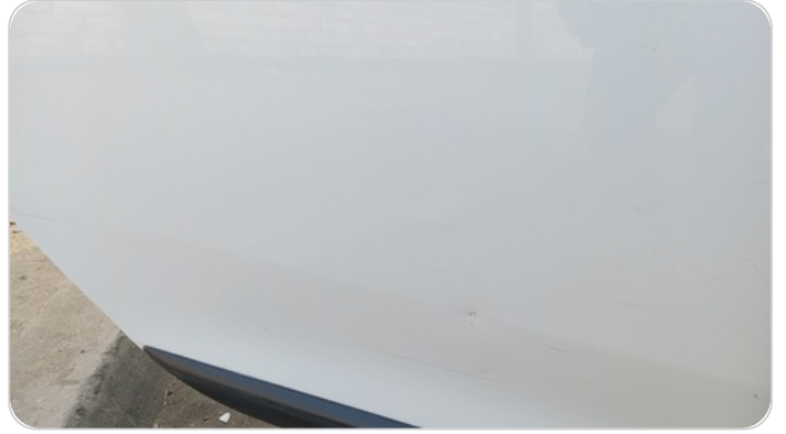
الباب الخلفي يمين : فبريكة (خرابيش - خبطات)