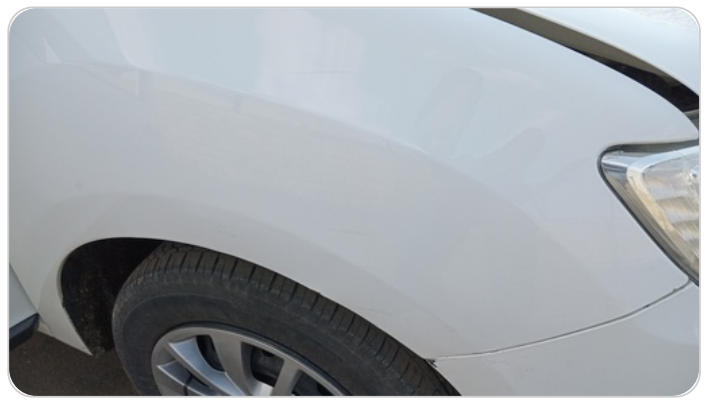
الرفرف الأمامي يمين : فبريكة (خرابيش - خبطات)