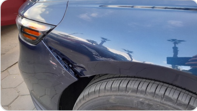
الرفرف الأمامي شمال : فبريكة (خبطات)