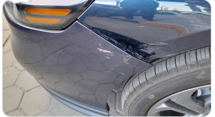
الاكصدام الأمامي : فبريكة (خبطات)