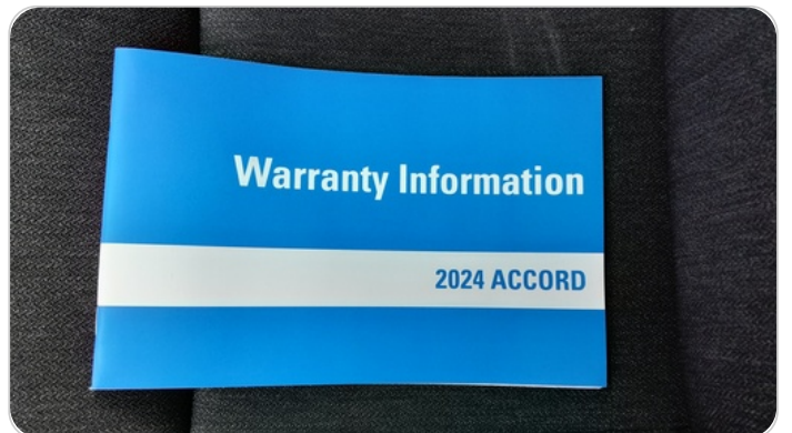
كتيب الضمان : موجود