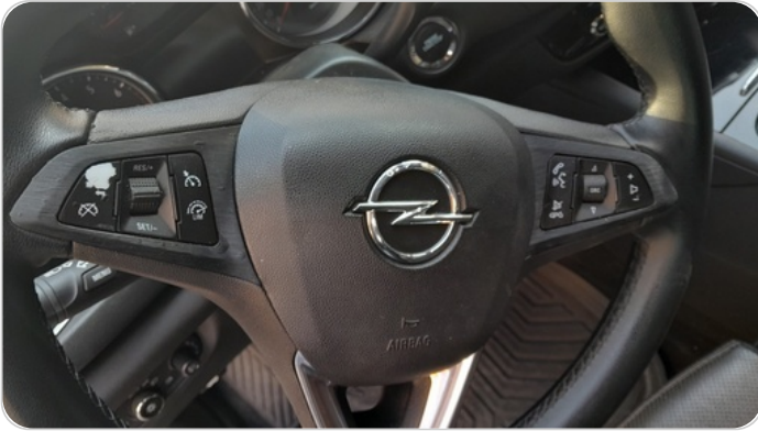
تحكم الصوت من الطاره : تاكل