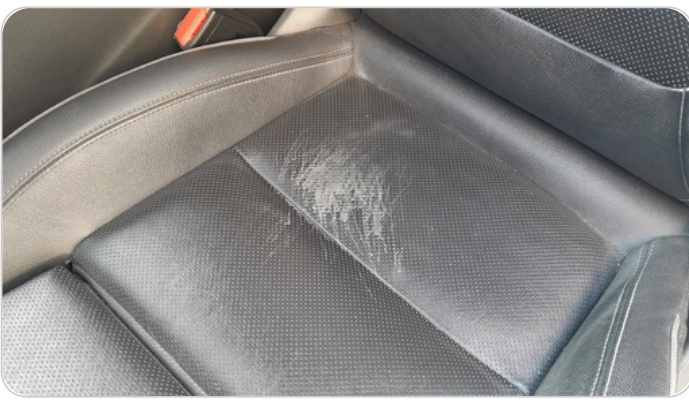
فرش كرسي أمامي شمال : قطع / كسر / شرخ / تلف