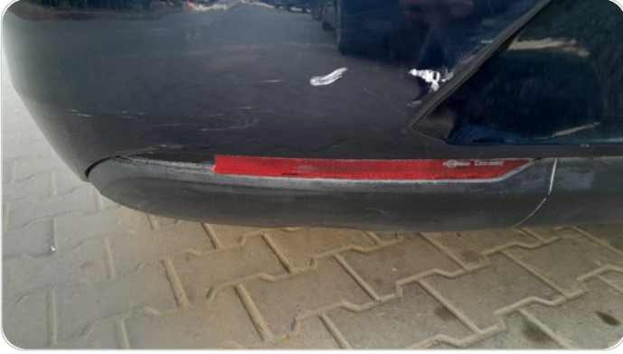
كشافات شبورة خلفي : كسر بالباقعة