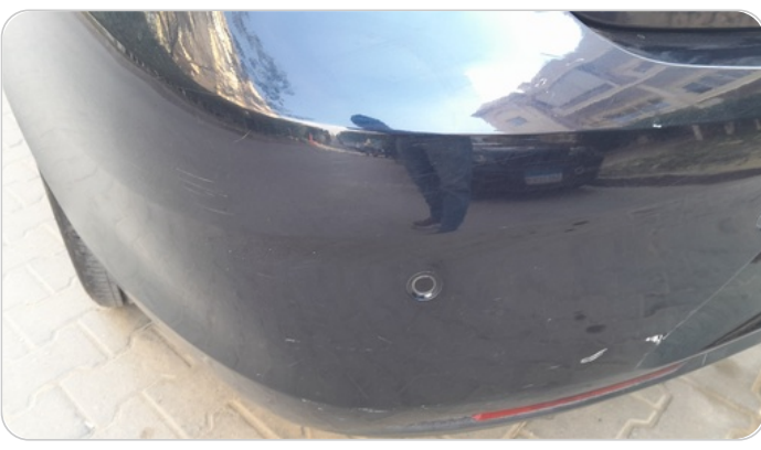
الاكصدام الخلفي : رش مع معجون (خرايش)