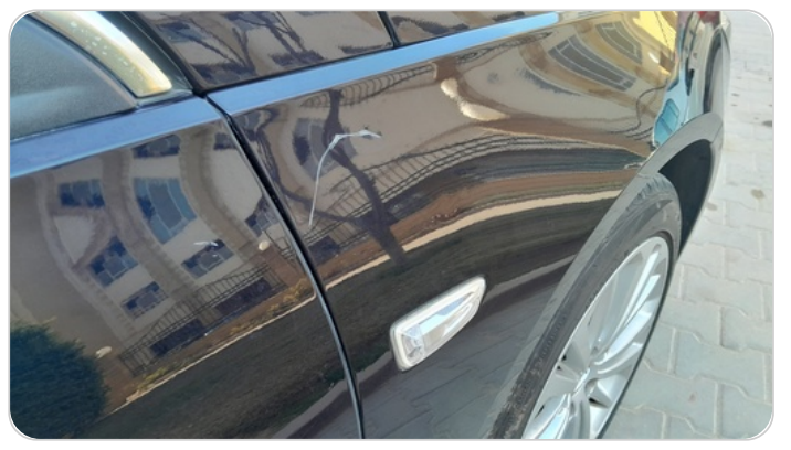
الرفرف الامامي يمين : فبريكة (خرايش)