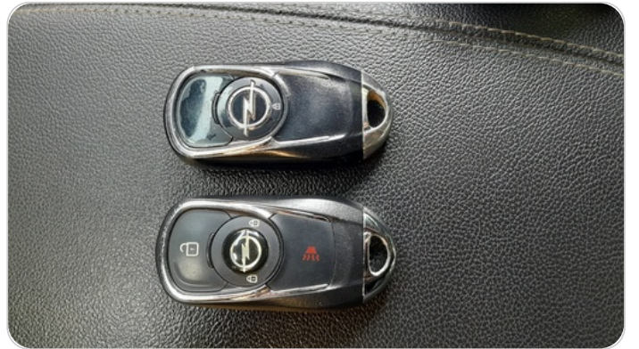
الريموت /المفتاح الاضافي : موجود (لم يتم التجربة)