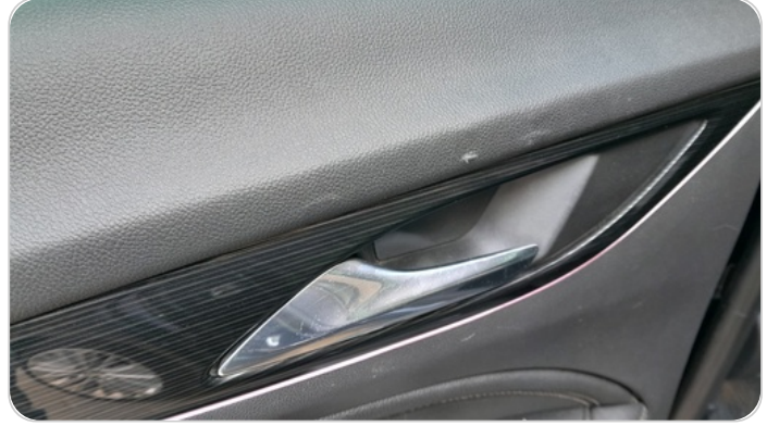
فرش الباب الخلفي شمال : قطع /كسر/شرخ/تلف