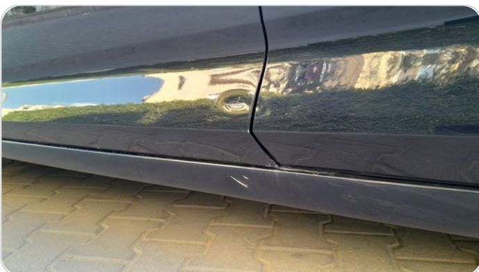
العتب السفلي شمال : فبريكة (خرابيش)