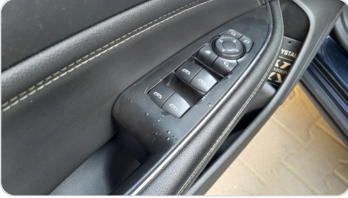
فرش الباب الأمامي شمال : قطع/كسر/شرخ/تلف