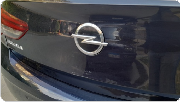
باب الشنطة : فبريكة (خرابيش)