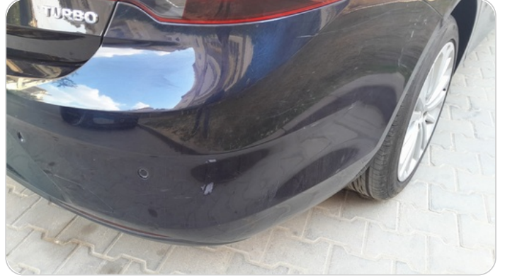
الاكصدام الخلفي :