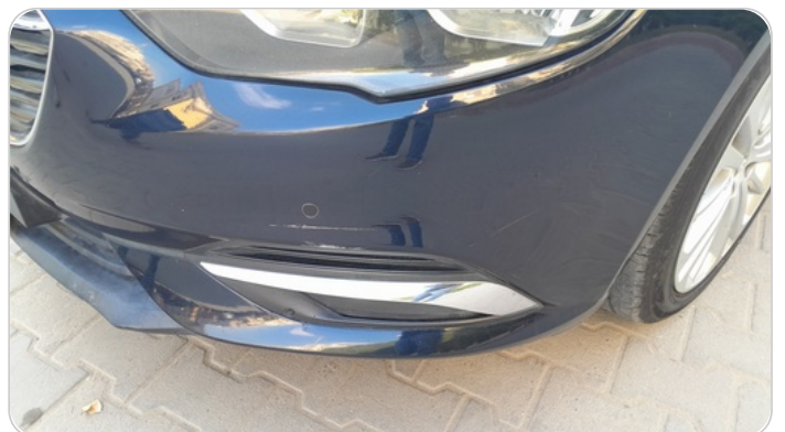
الاكصدام الأمامي : رش مع معجون (خرابيش)