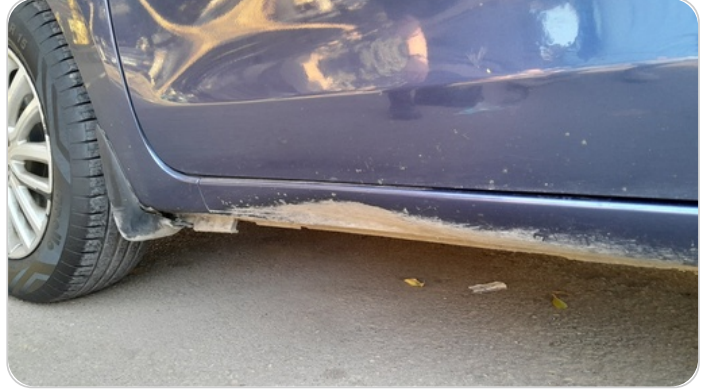
العتب السفلي شمال : فبريكة (خبطات)