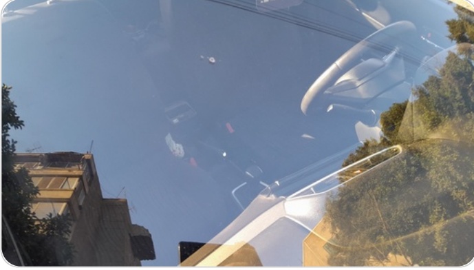
زجاج السيارة الأمامي : نقرة