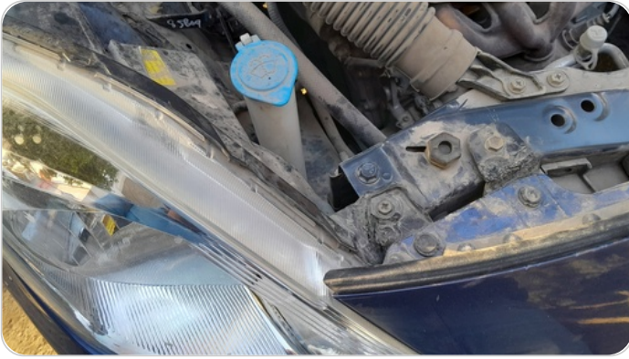
الكشاف الأمامي يمين : كسر في قواعد الكشاف