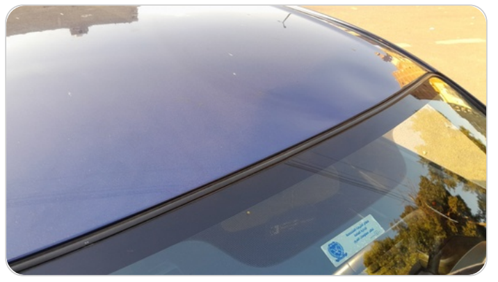
السقف : فبريكة (خبطات)