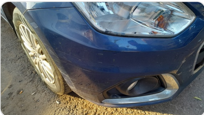
الاكصدام الأمامي : فبريكة (خبطات)