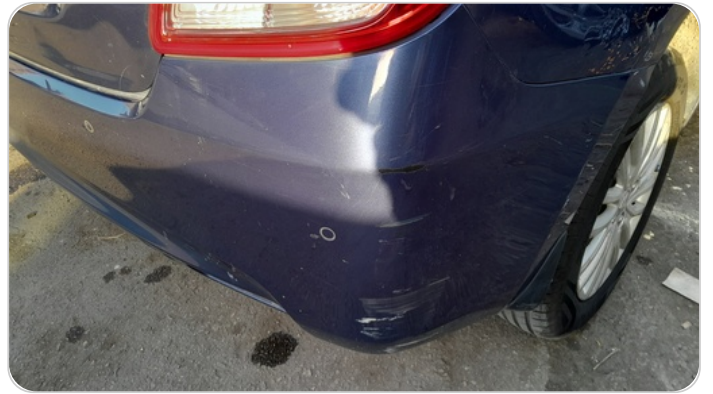
الاكصدام الخلفي :