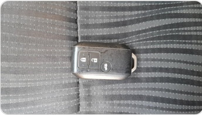
حالة الريموت / المفتاح : يحتاج بطارية