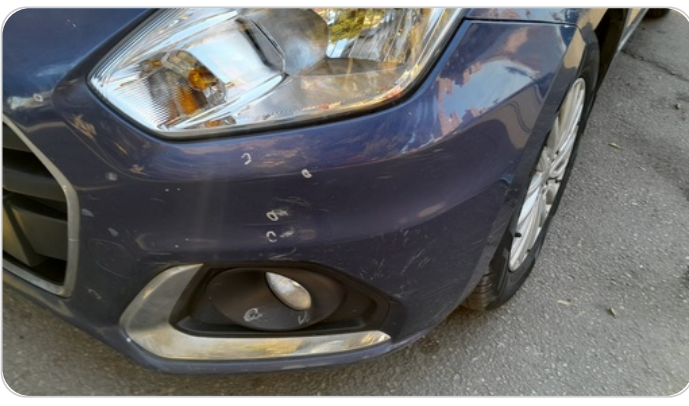
الكصدام الامامي :