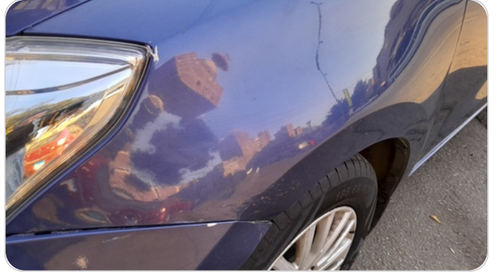
الرفرف الأمامي شمال : فبريكة (سمكره على البارد)