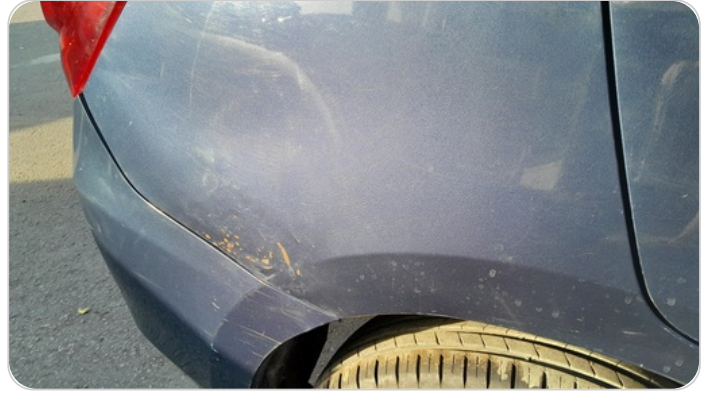
الرفرف الخلفي يمين : فبريكة (سمكره على البارد)