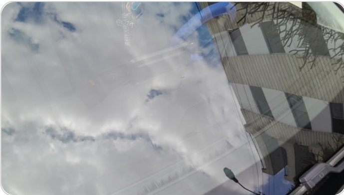
زجاج السيارة الأمامي : نقرة