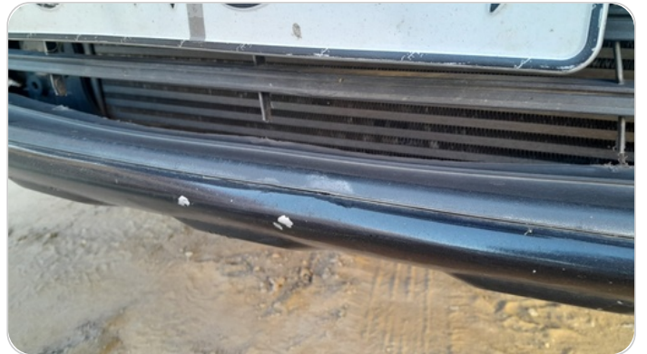
شبكة أمامية : شرخ / كسر