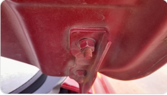
مفصلات ومسامير الكبوت : آثار فك وتركيب