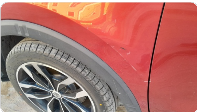
الرفرف الأمامي شمال : رش مع معجون (خرابيش)