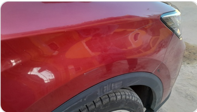
الرفرف الأمامي يمين : رش مع معجون (خرابيش)