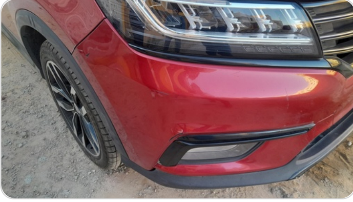
الاكصدام الامامي :