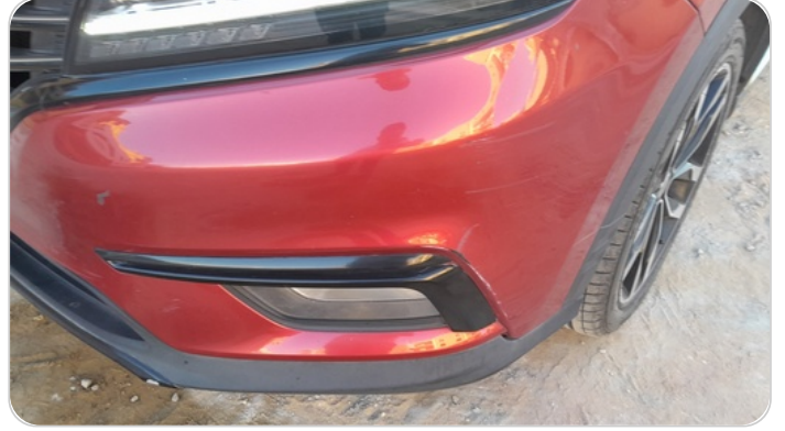
الاكصدام الأمامي : رش بدون معجون (خرابيش)