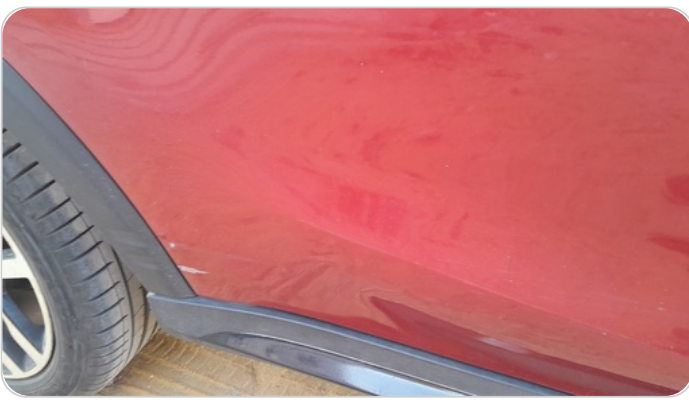
الباب الخلفي يمين : رش مع معجون (خرابيش)