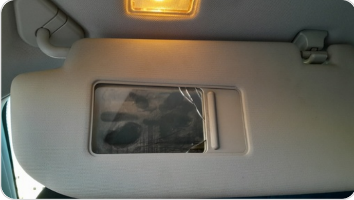
شماسات أمامية : تلف في الشمال