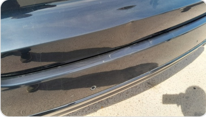
باب الشنطة : فبريكة (خبطات)