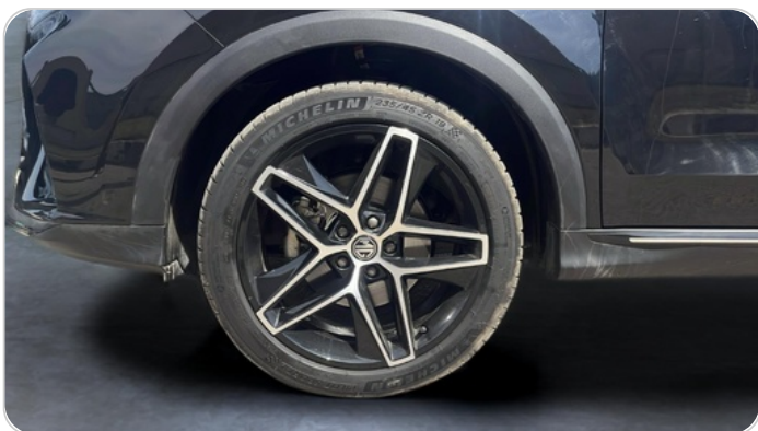
FR L TIRE