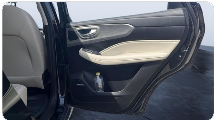
RR R DOOR