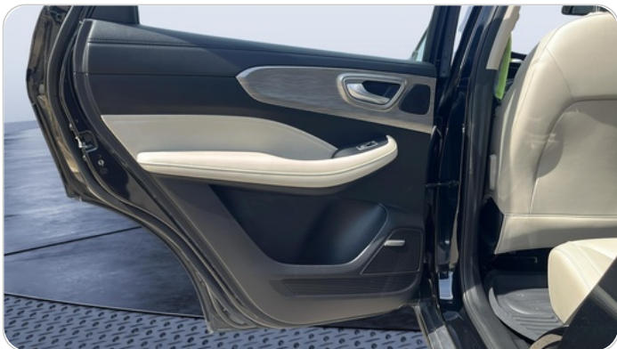
RR L DOOR