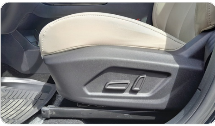
DRIVER SEAT SWITCHES