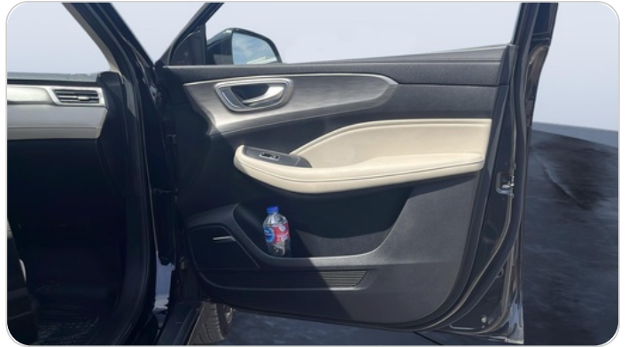
FR R DOOR