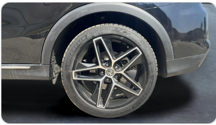
RR L TIRE