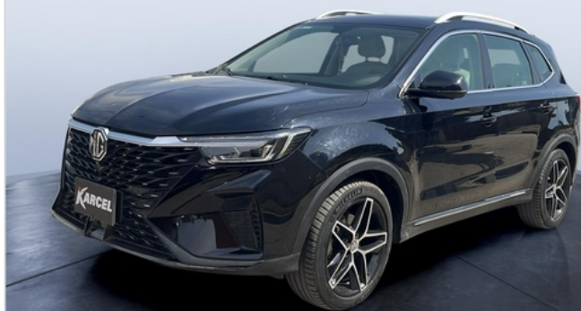
FR L 45