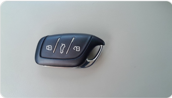
حالة الريموت / المفتاح : يعمل بكفاءة