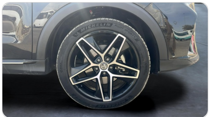
FR R TIRE