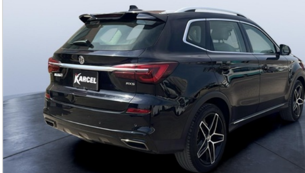
RR R 45