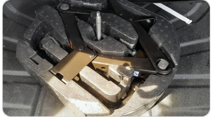
العدة وأدوات الأمان : متوفرة (بحالة جيدة)