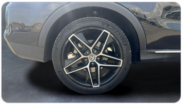
RR R TIRE