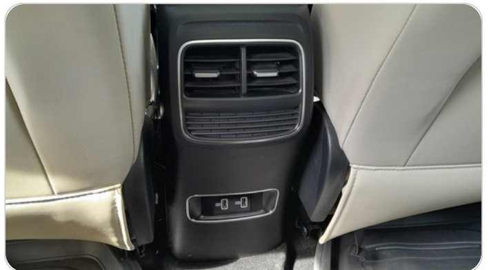
RR AC GRILL