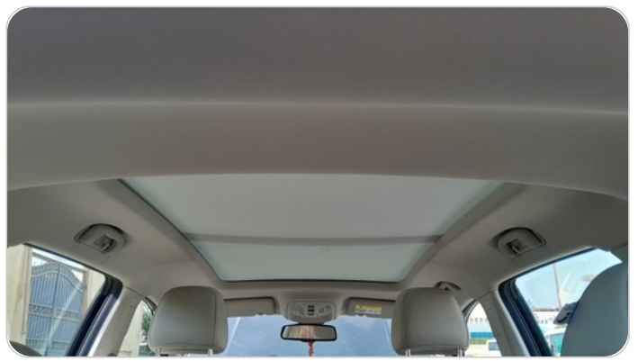
CAR ROOF MAT