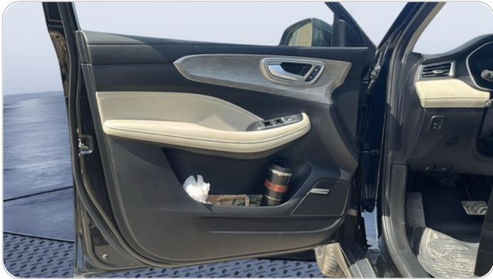
FR L DOOR