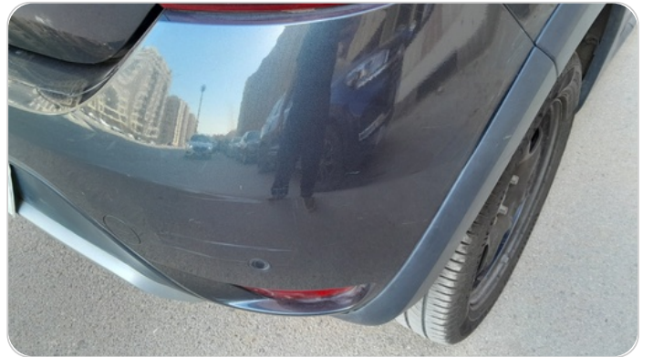
الكصدام الخلفي : فبريكة (خرابيش)