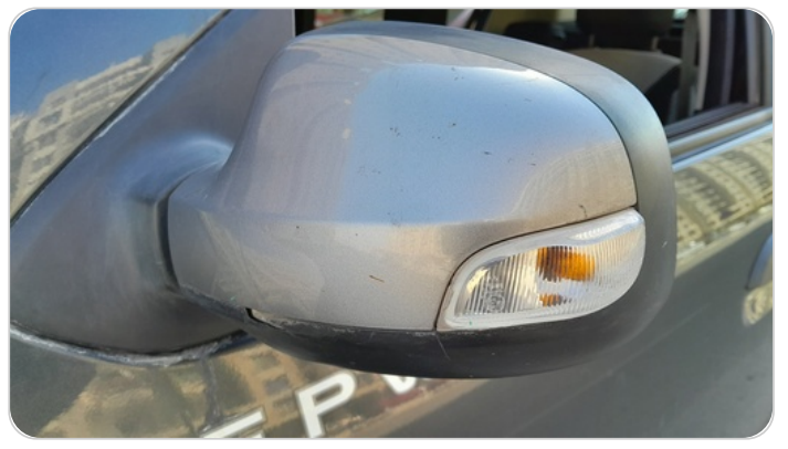
مراية الباب الأمامي شمال : كسر في الغطاء