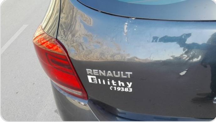
باب الشنطة : فبريكة (سمكره على البارد)