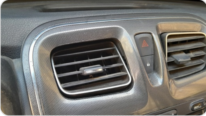
هوايات التكييف : كسر (هواية واحدة)