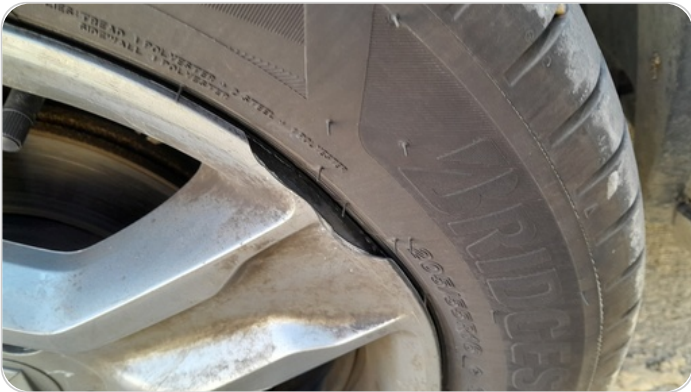
حالة الجنوط الأمامي : آثار خبط أو استبدال