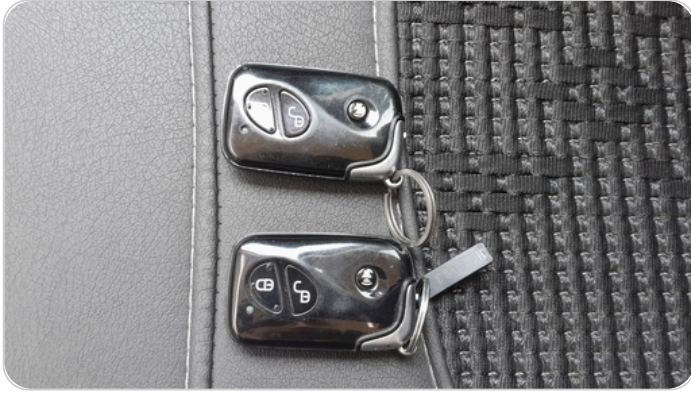
الريموت /المفتاح الاضافي : موجود (لم يتم التجربة)