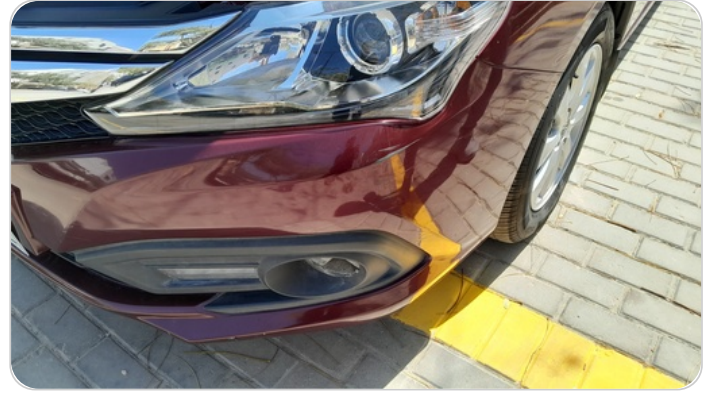
الاكصدام الامامي : فبريكة (خطات)