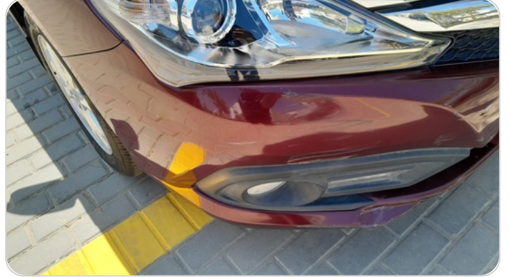
الاكصدام الأمامي : فبريكة (خبطات)