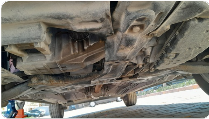
اسفل السيارة :