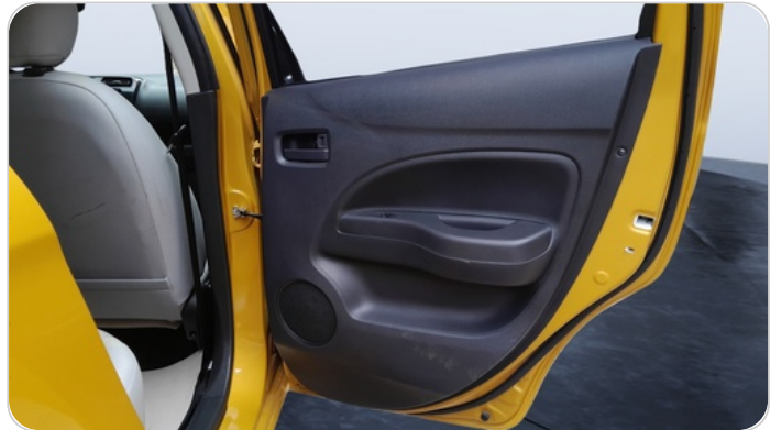
RR R DOOR