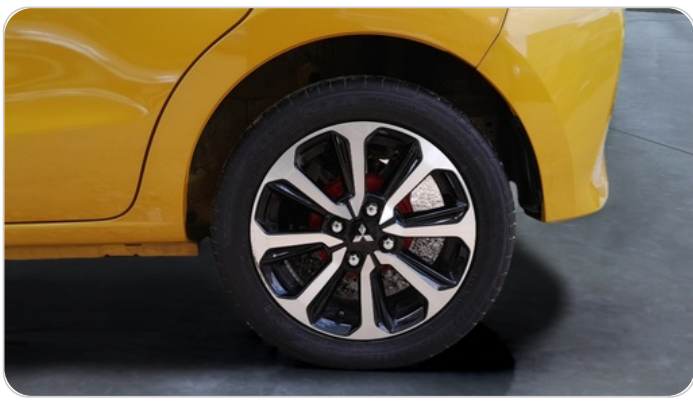
RR L TIRE