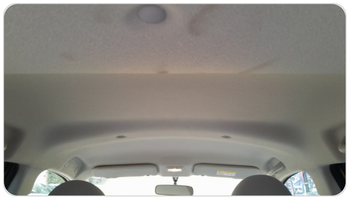
CAR ROOF MAT