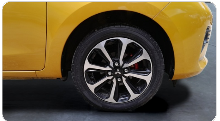
FR R TIRE