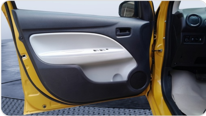
FR L DOOR