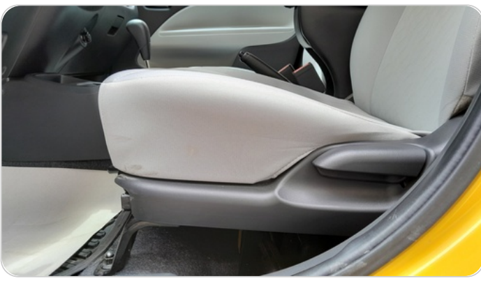
DRIVER SEAT SWITCHES