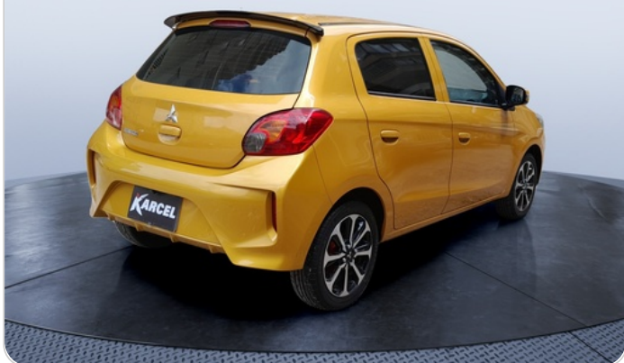
RR R 45