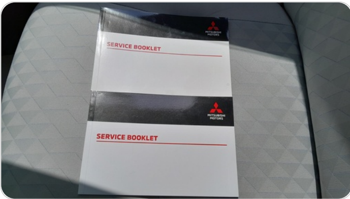
كتيب الضمان : موجود