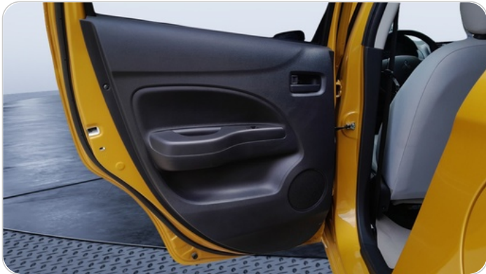
RR L DOOR