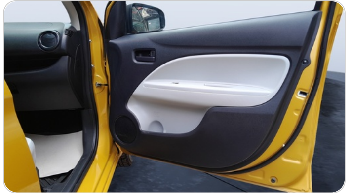
FR R DOOR