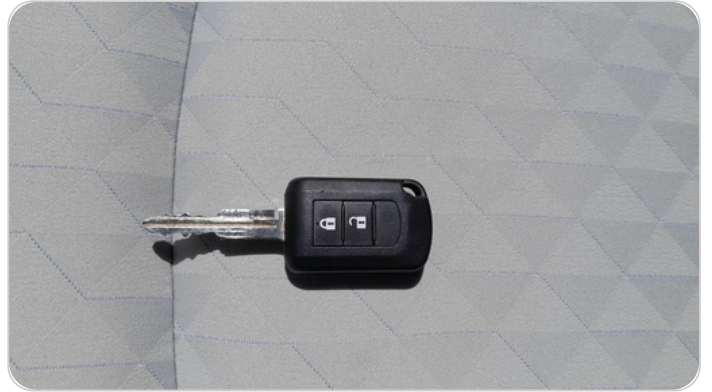
حالة الريموت / المفتاح : يعمل بكفاءة