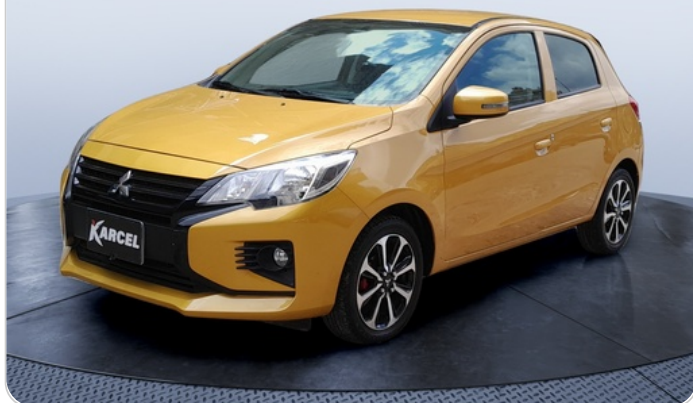
FR L 45