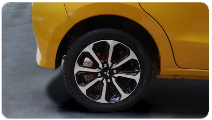
RR R TIRE