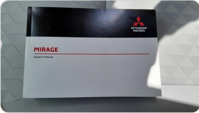
كتالوج السيارة : موجود