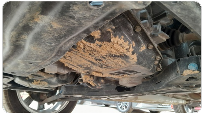
أسفل السيارة : تحتاج تنظيف