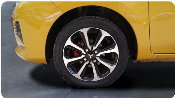
FR L TIRE