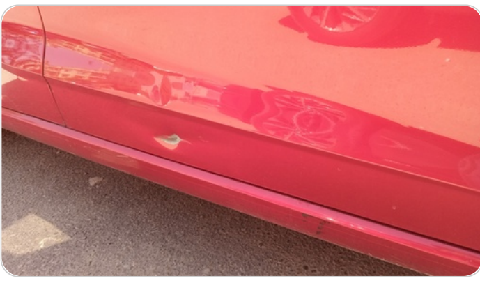
الباب الأمامي يمين : فبريكة (خبطات)