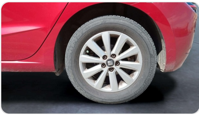
RR L TIRE