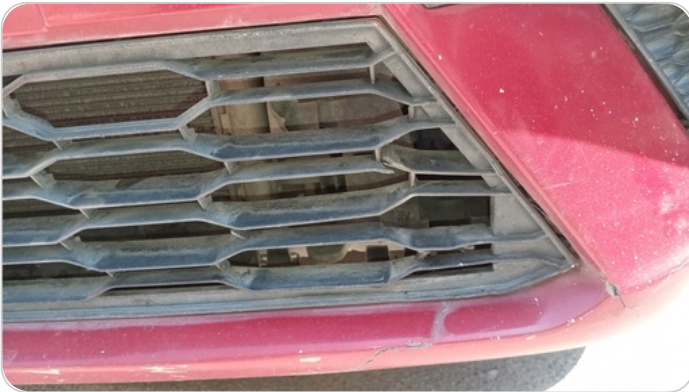
شبكة أمامية : شرخ / كسر