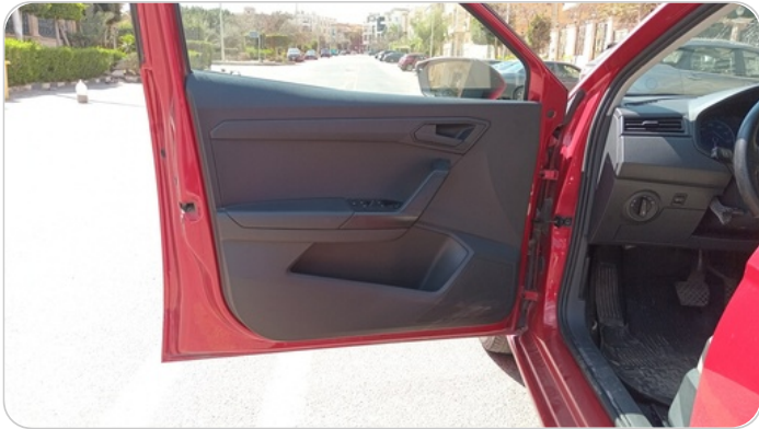
FR L DOOR