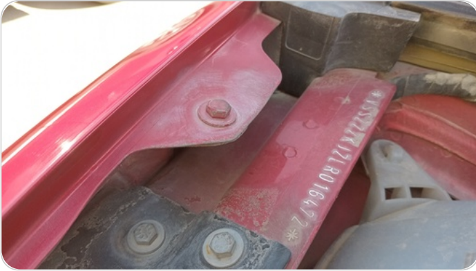
مسامير رفرف أمامي يمين : اثار فك وتركيب