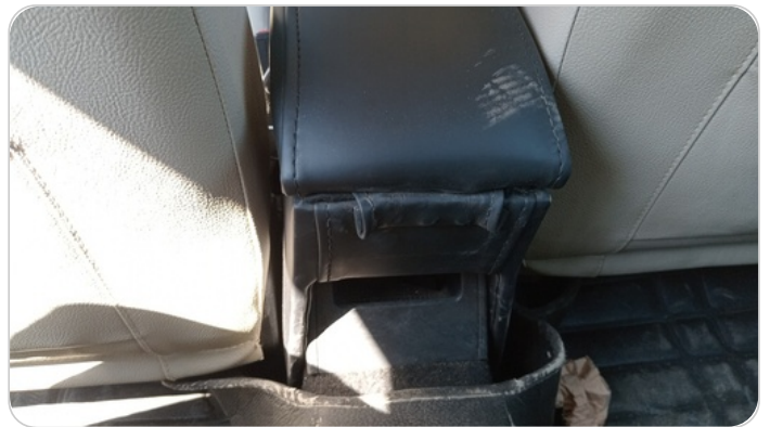
RR AC GRILL