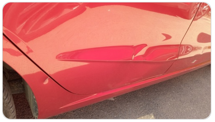
الباب الخلفي يمين : فبريكة (خرابيش - خبطات)