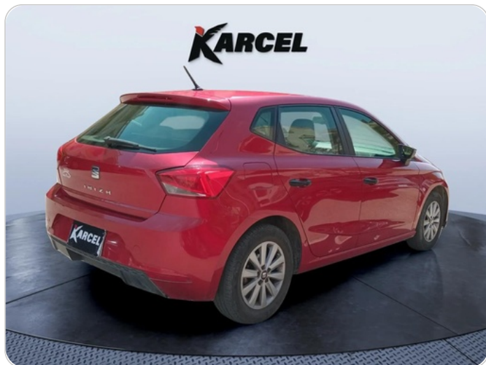
RR R 45