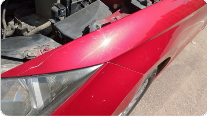
الرفرف الأمامي شمال : فبريكة (خرابيش)