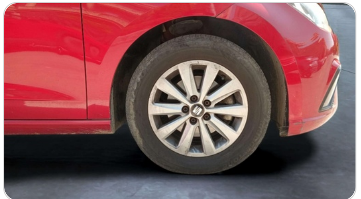
FR R TIRE