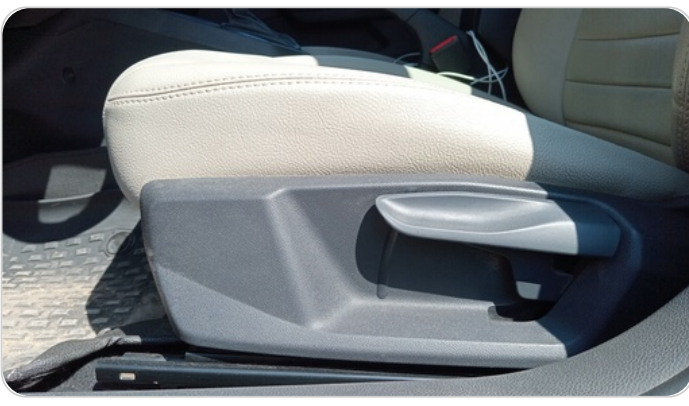
DRIVER SEAT SWITCHES