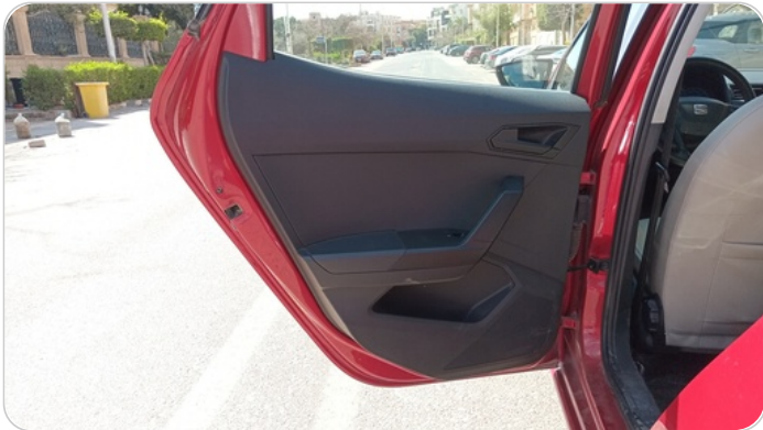
RR L DOOR