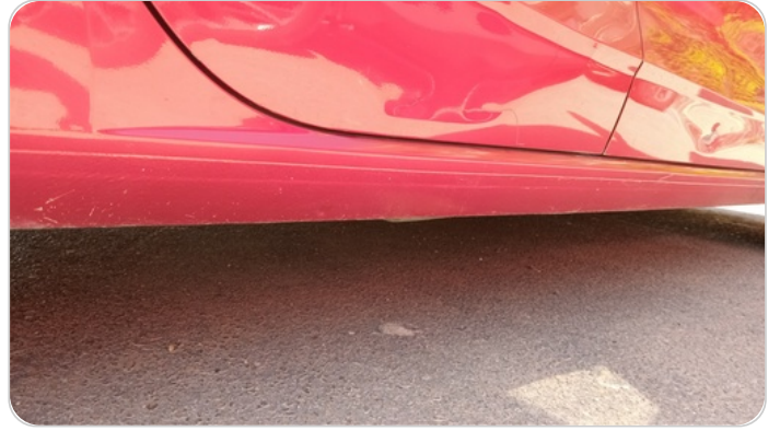
العتب السفلي يمين : فبريكة (خرابيش)