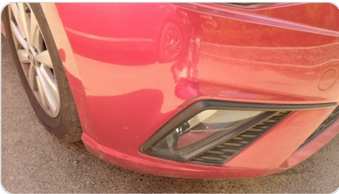
اكصدام أمامي : فبريكة (كسر)