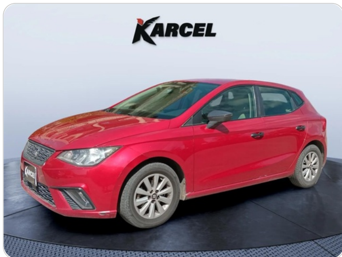
FR L 45