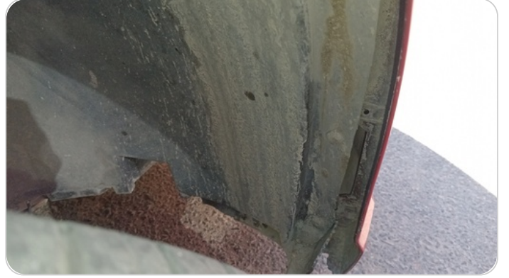
كرتيرة عجل أمامي يمين : كسر