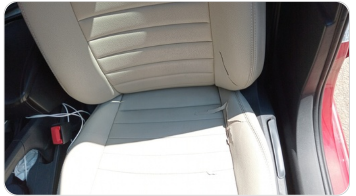
فرش كرسي أمامي شمال : قطع / كسر / شرخ / تلف