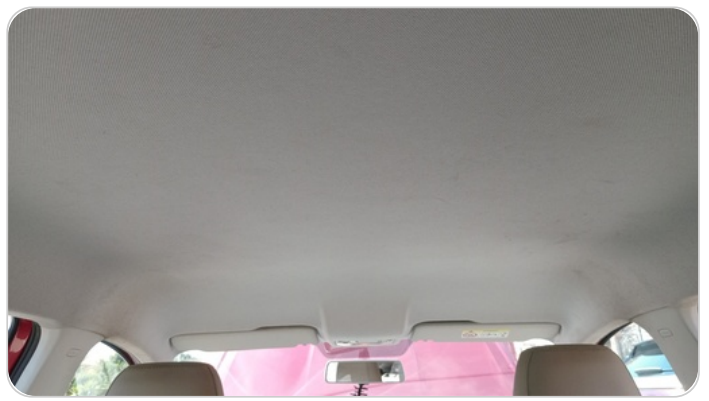
CAR ROOF MAT