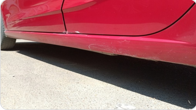
العتب السفلي شمال : فبريكة (خرابيش)