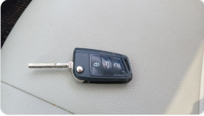
حالة الريموت / المفتاح : يعمل بكفاءة