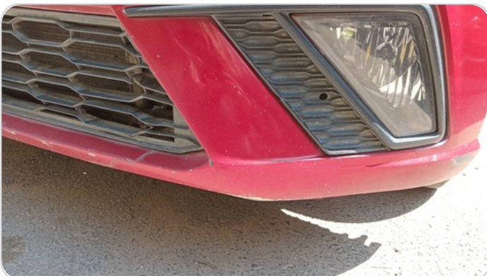
الاكصدام الأمامي : فبريكة (كس)