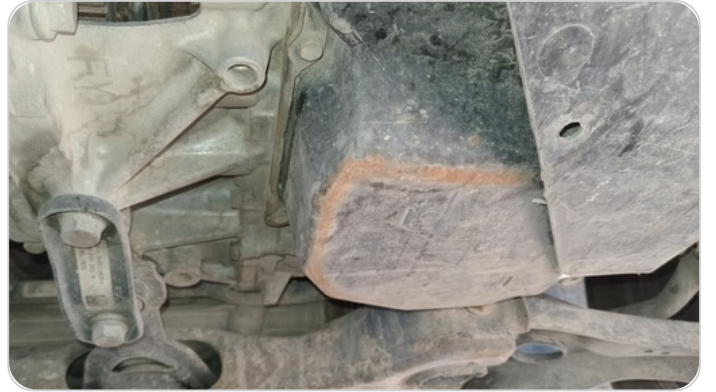
كرتيرة الفتيس : تجاريح