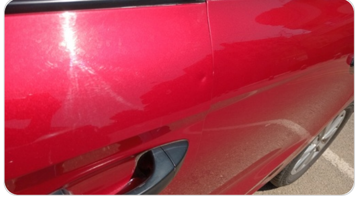
الباب الأمامي شمال : فبريكة (خبطات)