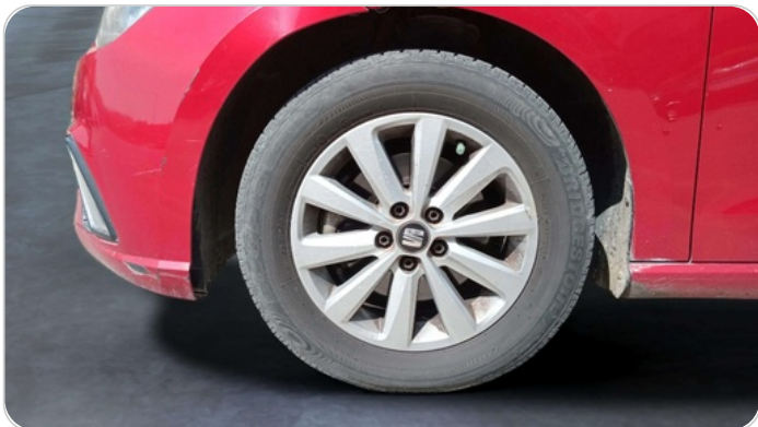
FR L TIRE