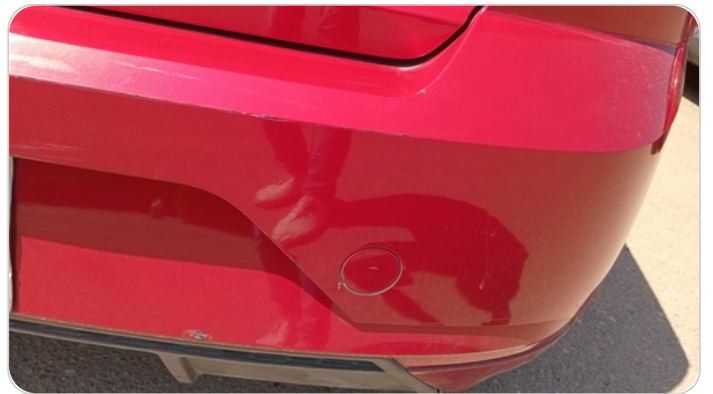
اكصدام خلفي : فبريكة (خرابيش)