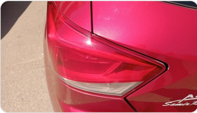
الكشاف الخلفي شمال : كسر بالباغة