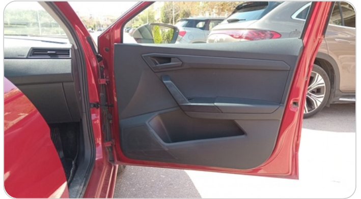
FR R DOOR