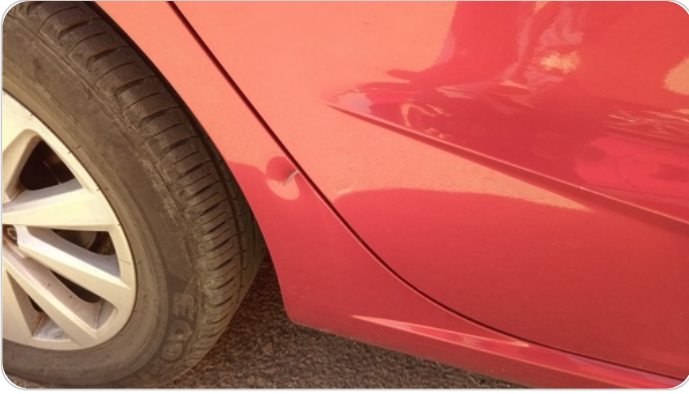
الرفرف الخلفي يمين : فبريكة (خبطات)