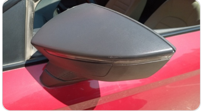
مراية الباب الأمامي شمال : فبريكة (خرابيش)