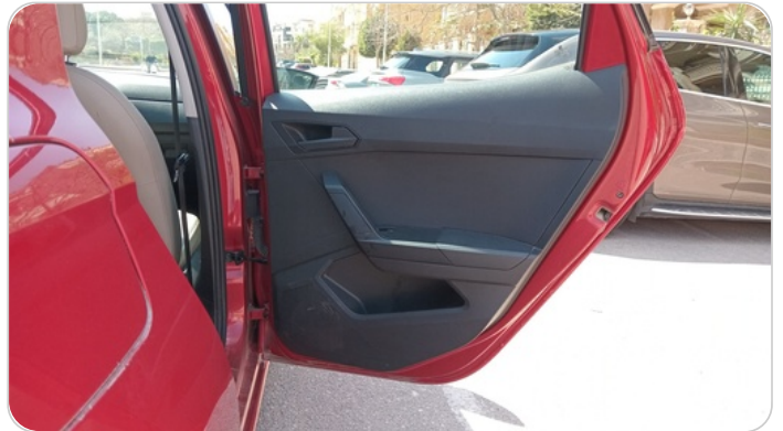
RR R DOOR