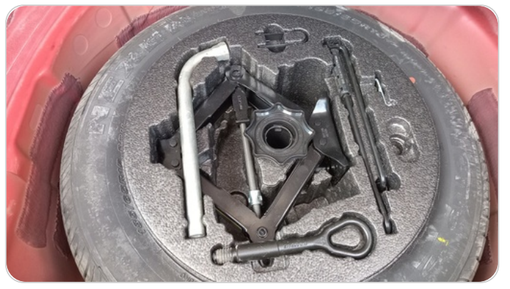
العدة وأدوات الأمان : متوفرة (بحالة جيدة)