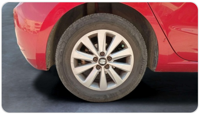
RR R TIRE