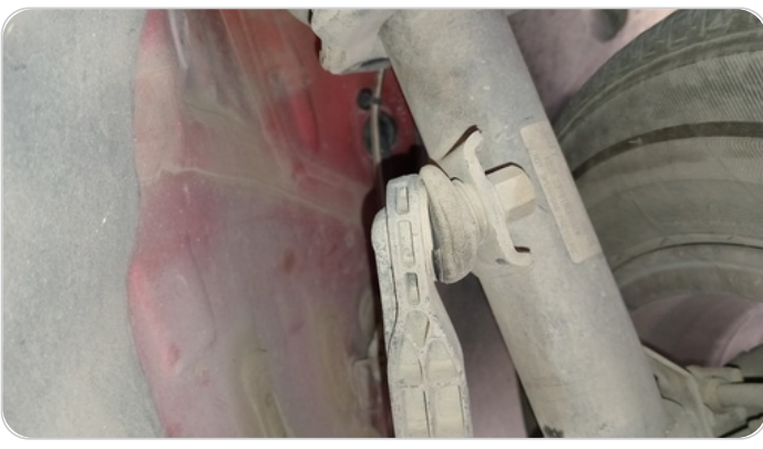
ذراع الميزان : تشققات (كاشيت الميزان)