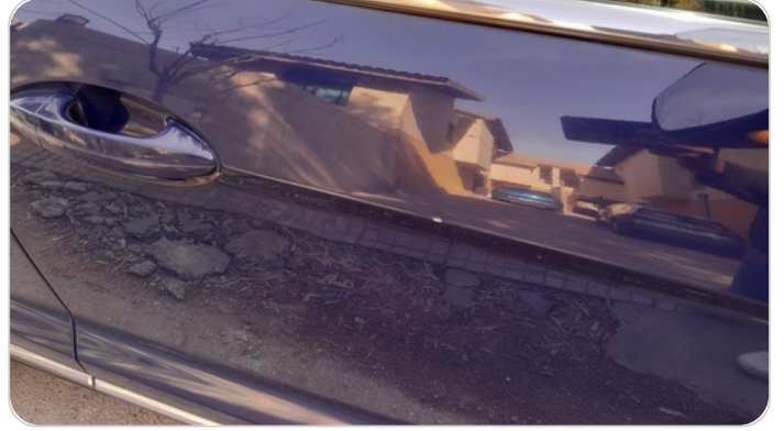
الباب الأمامي يمين : فبريكة (خرايش)