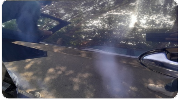
الباب الخلفي شمال : فبريكة (خرابيش)