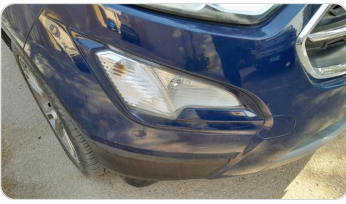
الاكصدام الأمامي : رش بدون معجون (خرايش)