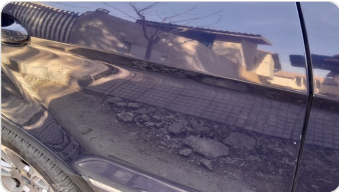
الباب الخلفي يمين : فبريكة (خرايش)