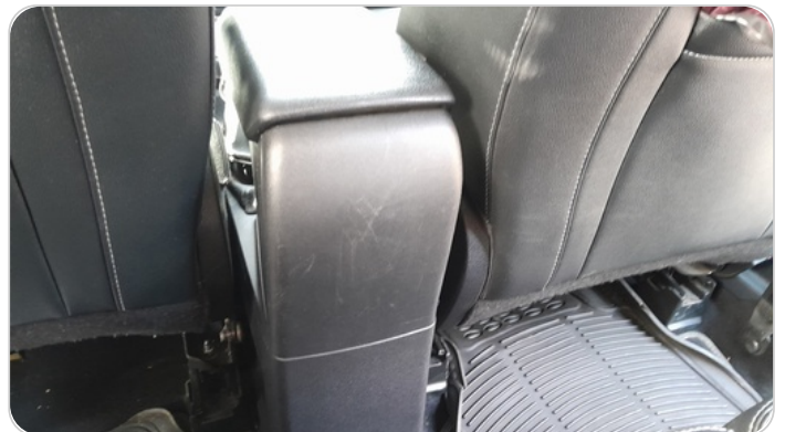
RR AC GRILL