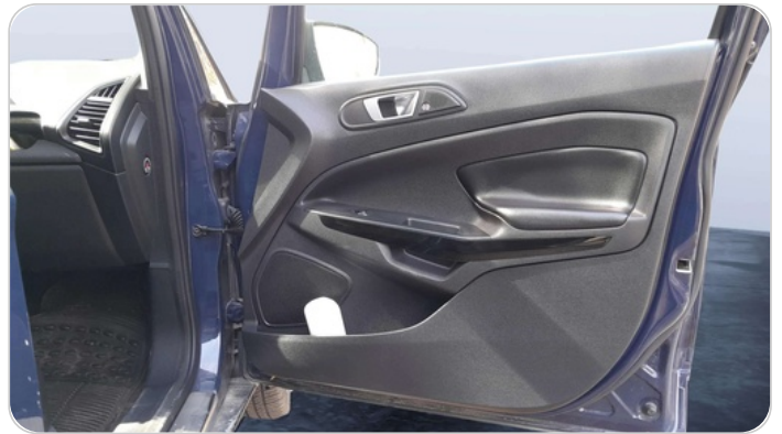
FR R DOOR