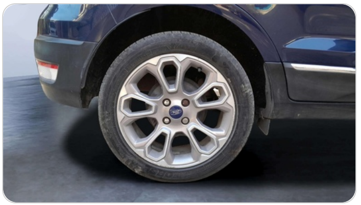
RR R TIRE