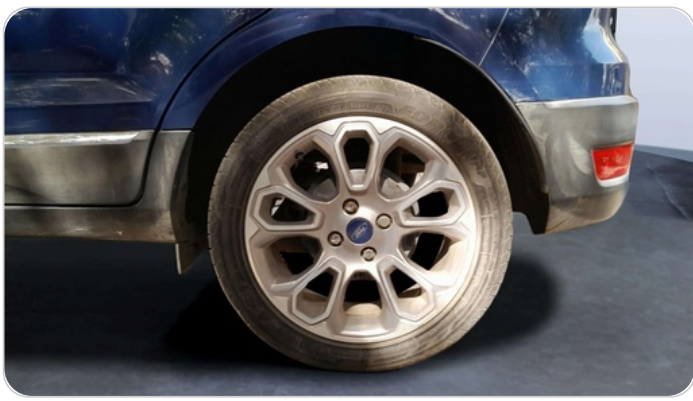
RR L TIRE