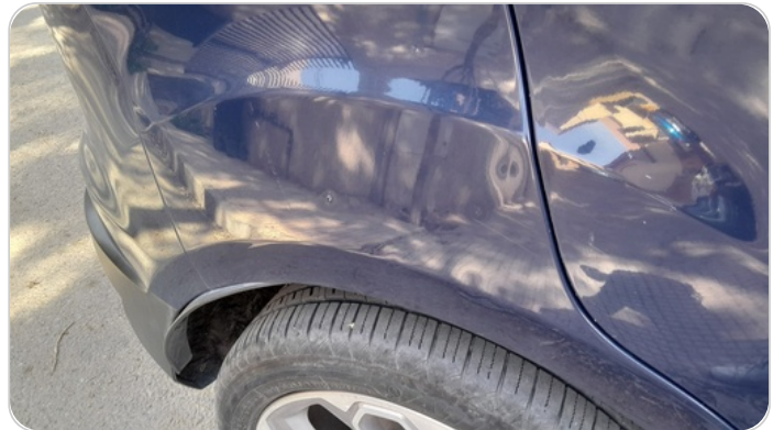
الرفرف الخلفي يمين : فبريكة (خرايش)