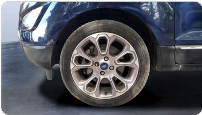
FR L TIRE