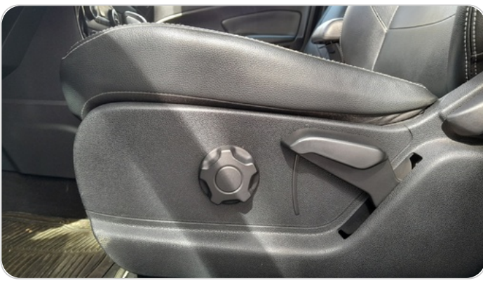
DRIVER SEAT SWITCHES