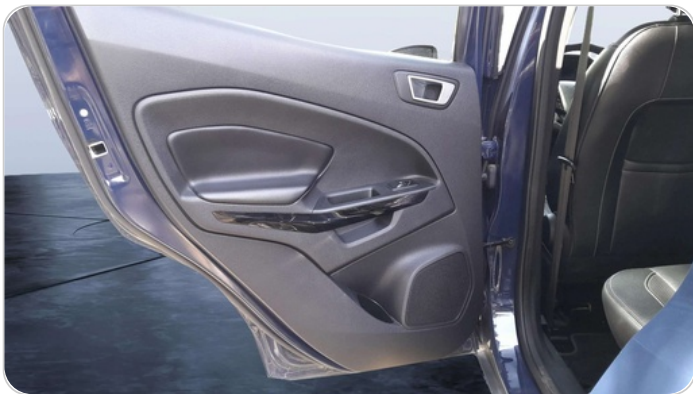
RR L DOOR