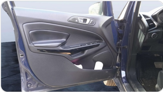
FR L DOOR