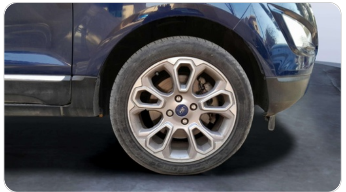
FR R TIRE