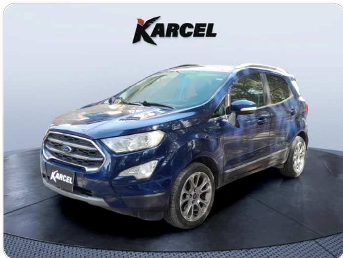
FR L 45