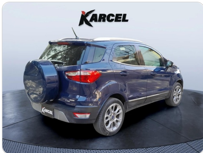
RR R 45