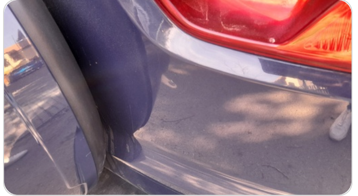
باب الشنطة : فبريكة (خرابيش)