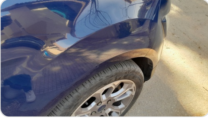
الرفرف الأمامي يمين : فبريكة (خرايش)