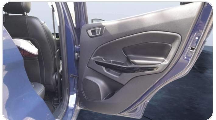
RR R DOOR