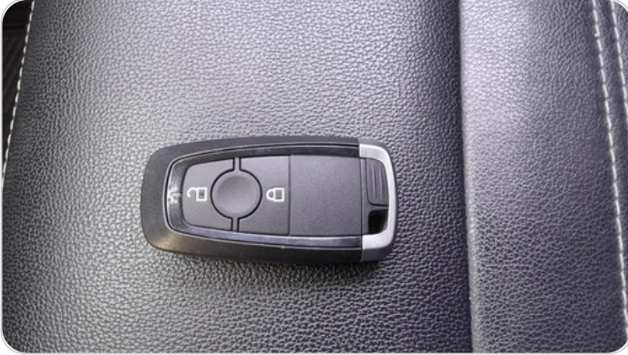
حالة الريموت / المفتاح : يعمل بكفاءة