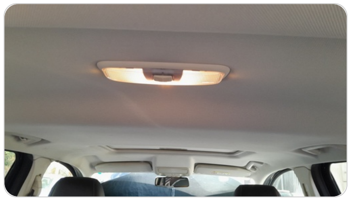
CAR ROOF MAT