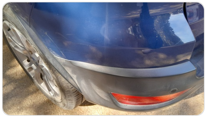
الاكصدام الخلفي : فبريكة (خرايش)