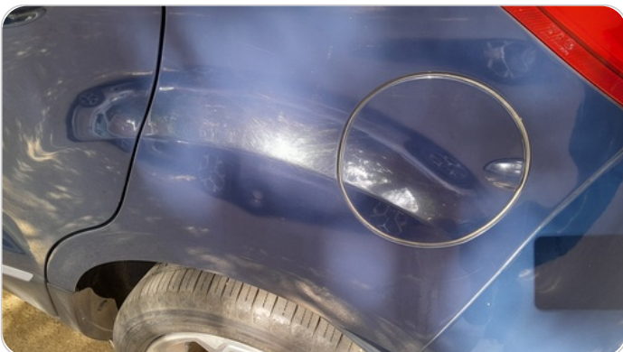
الرفرف الخلفي شمال : فبريكة (خرابيش)