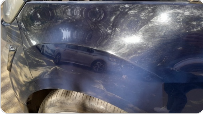
الرفرف الأمامي شمال : فبريكة (خبطات)