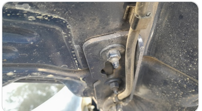
مفصلات ومسامير الكبوت : آثار فك وتركيب