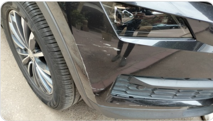
لاكصدام الأمامي : فبريكة (خرابيش)