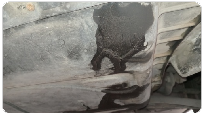
مصفحة محرك سفلية : كسر