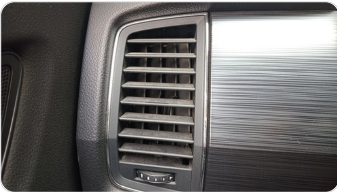
هوايات التكييف : كسر (هواية واحدة)