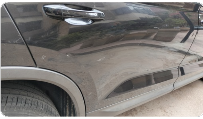
الباب الخلفي يمين : فبريكة (خرابيش - خبطات)