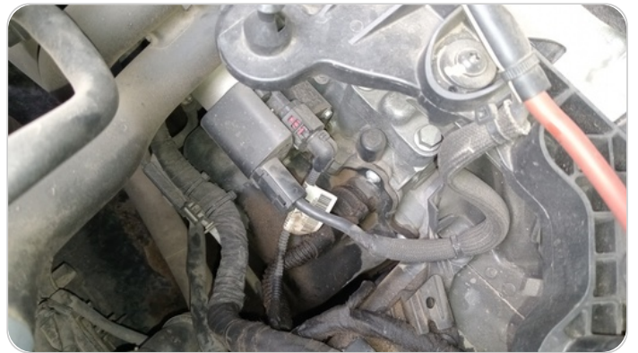
حالة الفتييس المرئية : تسريب (كارتيرة الزيت)