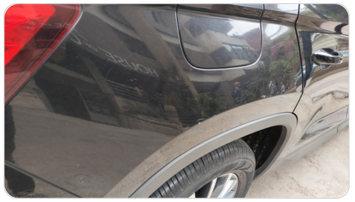
الرفرف الخلفي يمين : فبريكة (خرابيش - خبطات)