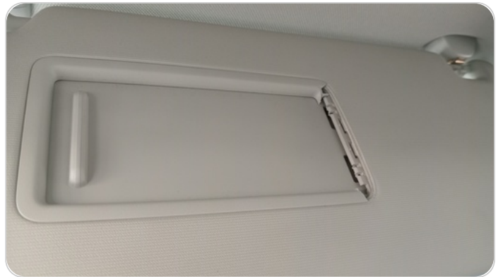
شماسات أمامية : تلف في الشمال