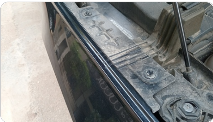
رفرف امامي يمين : اثار فك وتركيب