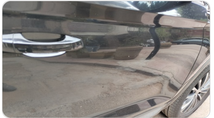
الباب الأمامي يمين : فبريكة (خبطات)