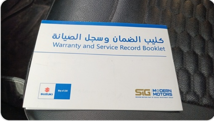
كتاب الضمان : موجود