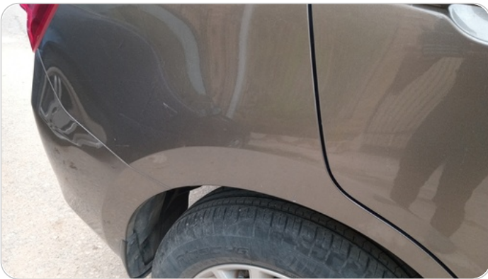
الرفرف الخلفي يمين : فبريكة (خرابيش - خبطات)