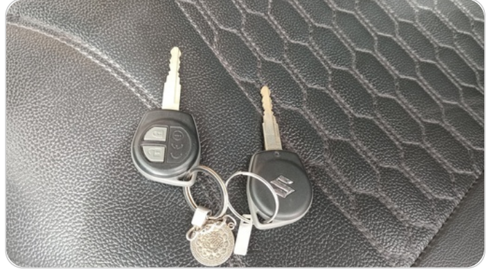
الريموت /المفتاح الاضافي : يعمل بكفاءة