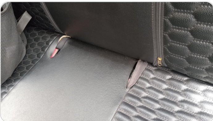
فرش كنية خلفي : قطع /كسر /شرح /تلف