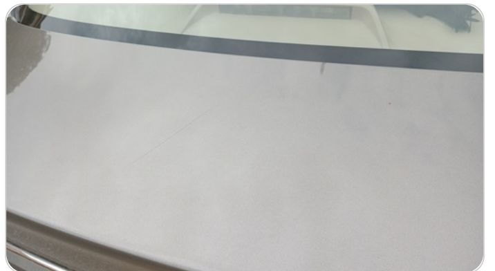
باب الشنطة : فبريكة (خرايش)