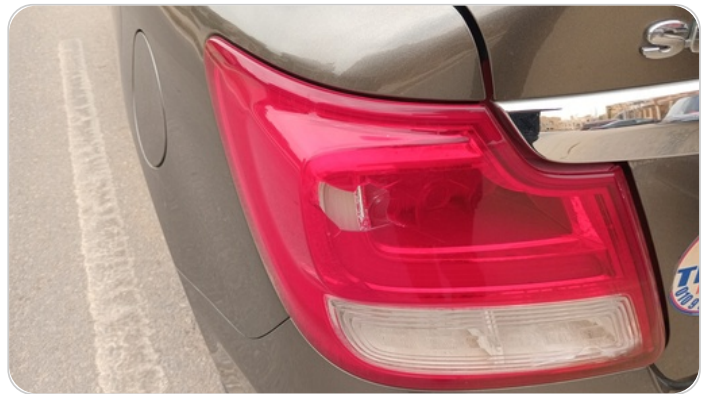
الكشاف الخلفي شمال : كسر بالباغة