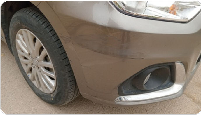
الاكصدام الأمامي : فبريكة (خرابيش - خبطات)