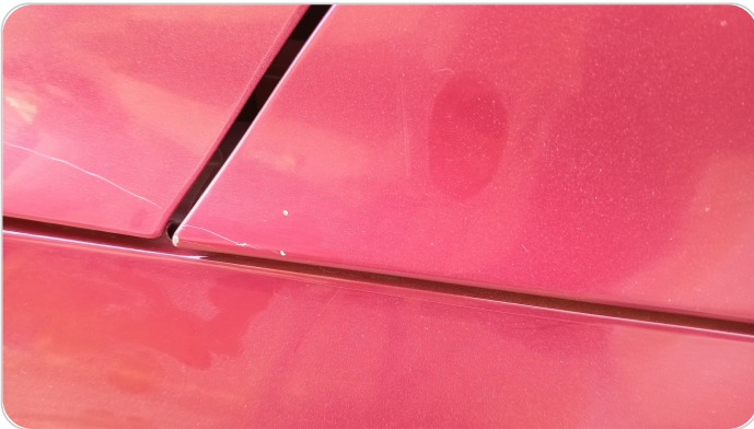
قائم خارجي أمامي شمال : فبريكة (خرابيش)