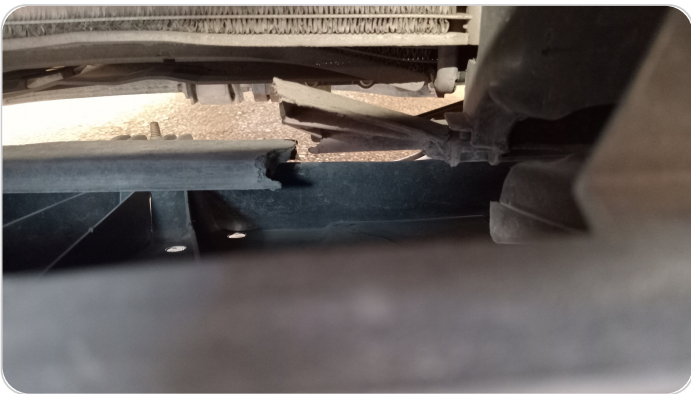
سريرنتينه التكيف : اعوجاج خفيف