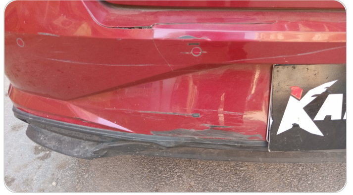
الاكصدام الخلفي : فبريكة (صدمة كبيرة)