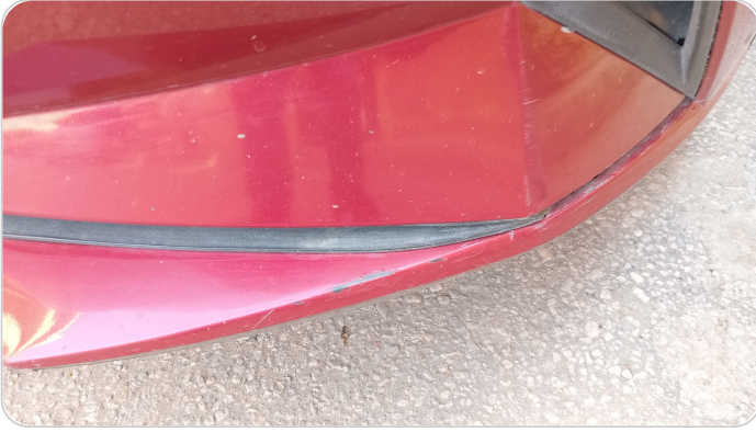
الاكصدام الأمامي : فبريكة (خرابيش - خبطات)