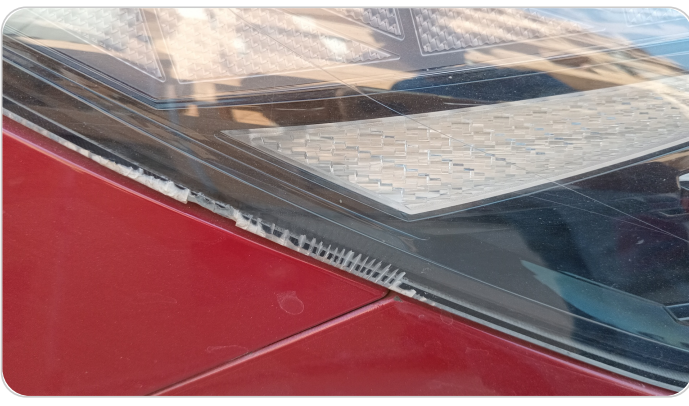
الكشاف الأمامي يمين : كسر بالباغة