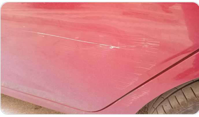
الباب الخلفي شمال : فبريكة (خرابيش - خبطات)