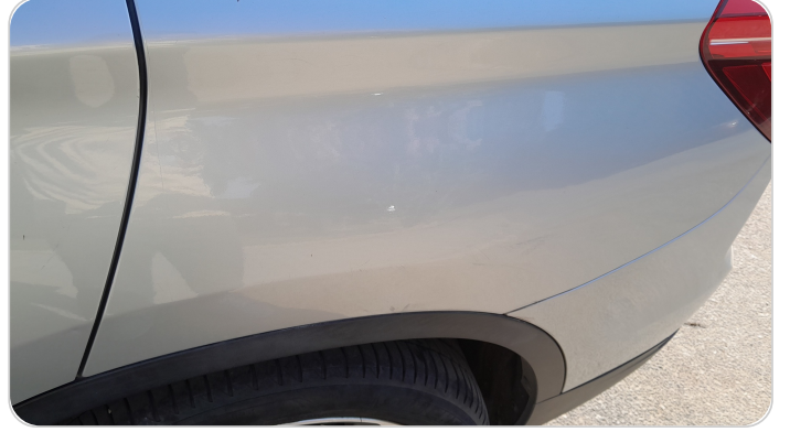
الرفرف الخلفي شمال : فبريكة (سمكره على البارد)