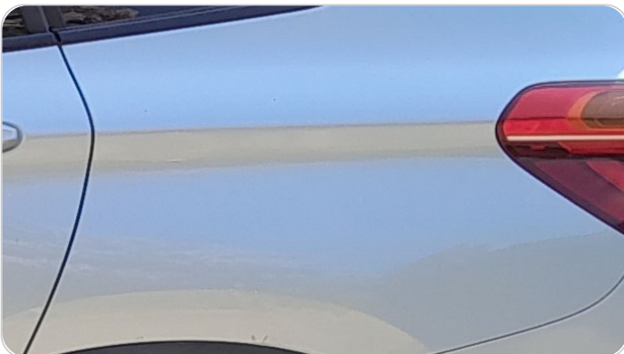
الرفرف الخلفي شمال : فبريكة (سمكره على البارد)