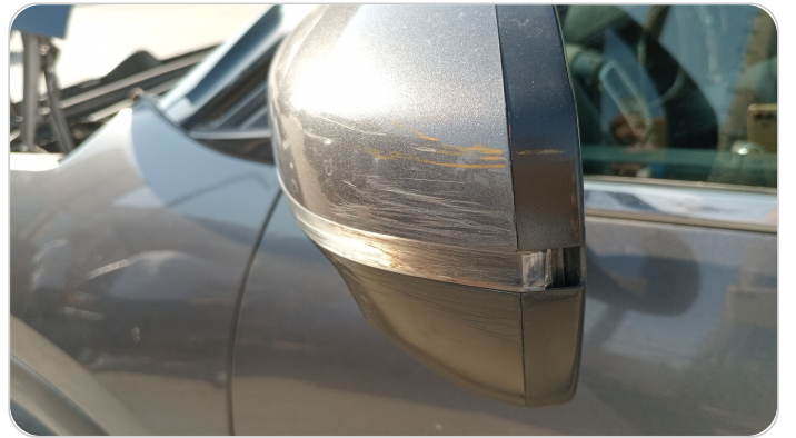
مرآية الباب الأمامي شمال : فبريكة (خرابيش)