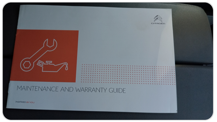
كتيب الضمان : موجود