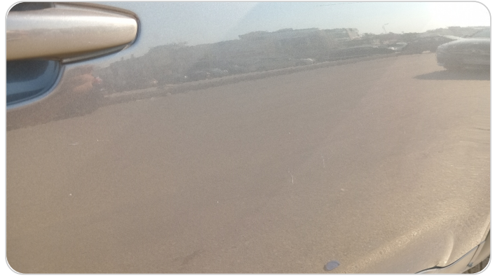
الباب الأمامي يمين : فبريكة (خرابيش - خبطات)