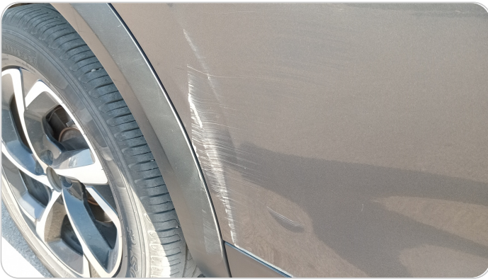
الباب الخلفي يمين : فبريكة (خرابيش - خبطات)