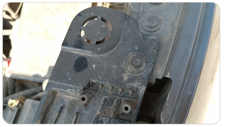
الكشاف الأمامي شمال : كسر في قواعد الكشاف