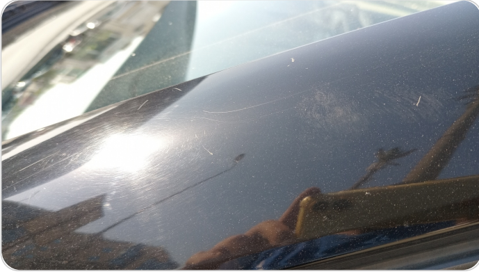
قائم خارجي أمامي شمال : فبريكة (خرابيش)