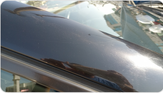
قائم خارجي أمامي يمين : فبريكة (خرابيش)